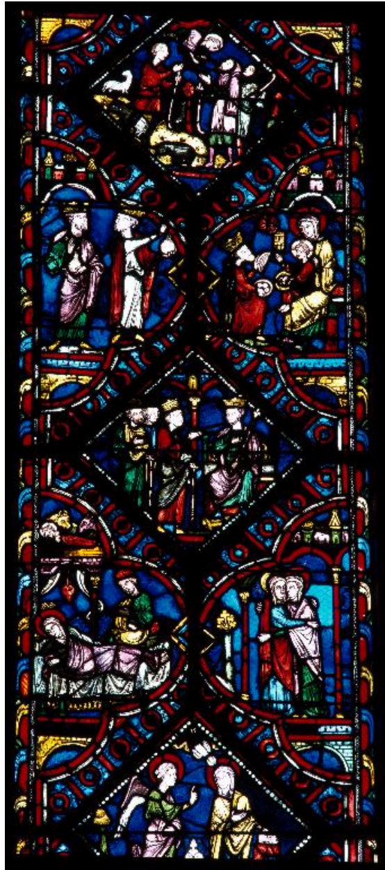
Vue de détail de la lancette droite : six scènes de l'Enfance du Christ de l'Annonciation à l'Annonce aux bergers.