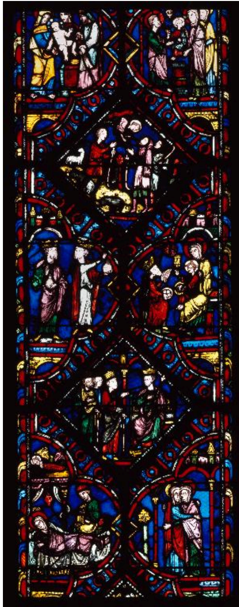
Vue de détail de la lancette droite : sept scènes de l'Enfance du Christ de la Visitation à la Présentation au temple.