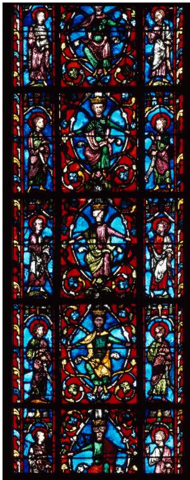
Vue de détail de la lancette gauche : cinq compartiments de l'arbre de Jessé.

Phot. Irwin Leullier IVR22_19996001713PA