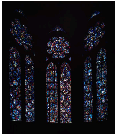
Vue d'ensemble des verrières de la chapelle d'axe (baie 0 au centre).

IVR22_19996001713PA