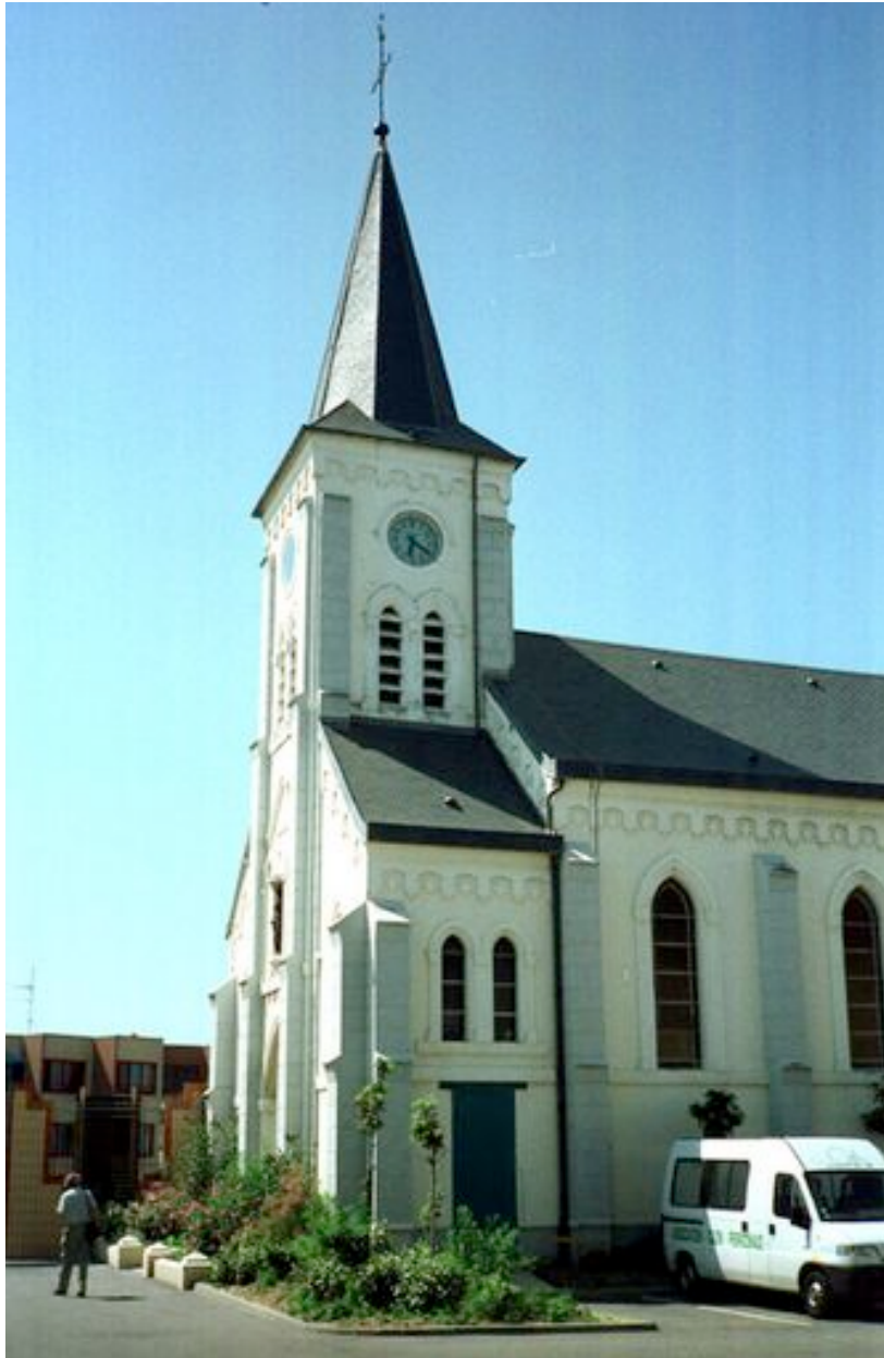
Vue générale de trois quarts de la chapelle en 1996.