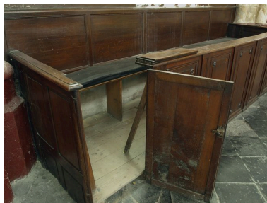
Un des bancs sud, porte ouverte