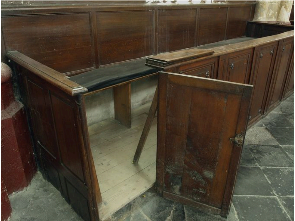
Un des bancs sud, porte ouverte