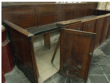
Un des bancs sud, porte ouverte IVR31_20106202761NUCA