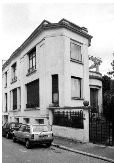
Logement patronal.