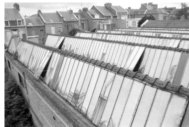
Ateliers de fabrication.