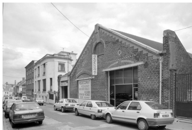
Vue générale. IVR22_19918000236Z