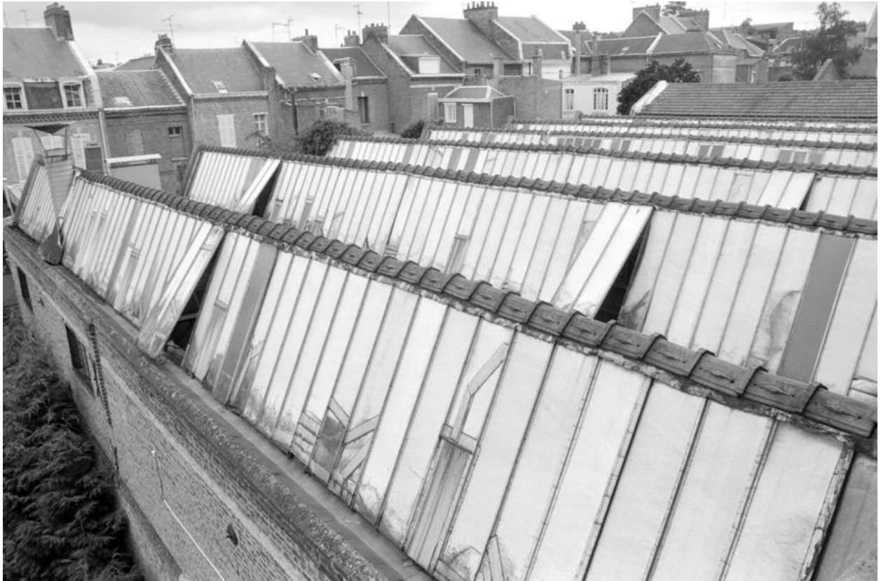
Ateliers de fabrication.