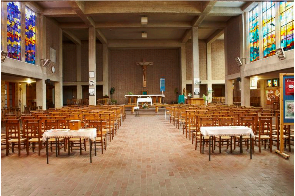
Vue intérieure vers l'autel.