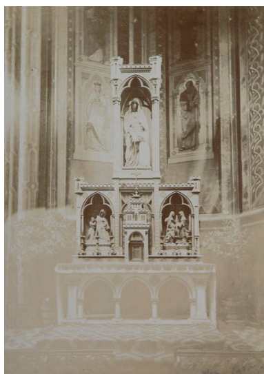
Vue d'une photographie de l'autel Sainte-Anne, antérieure à 1914.