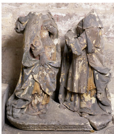
Vue générale. IVR22_20010202743XA