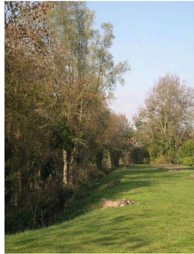
Vue de la douve, au nord.