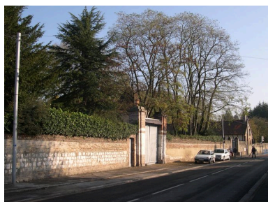
Vue de situation. IVR22_20048010550NUCA