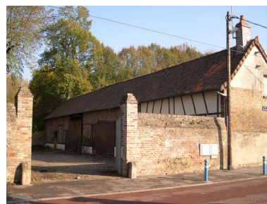
Vue des communs. IVR22_20048010552NUCA