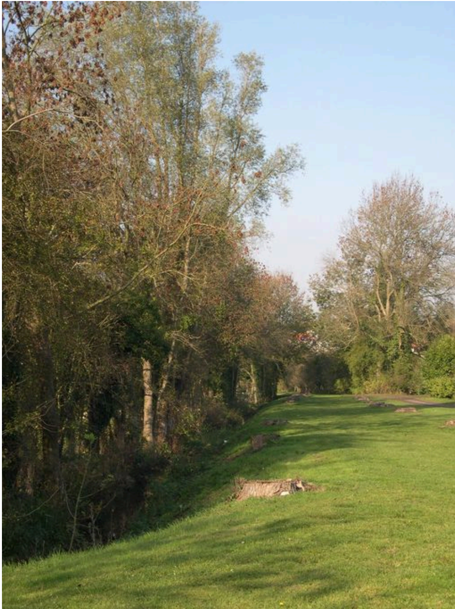
Vue de la douve, au nord.