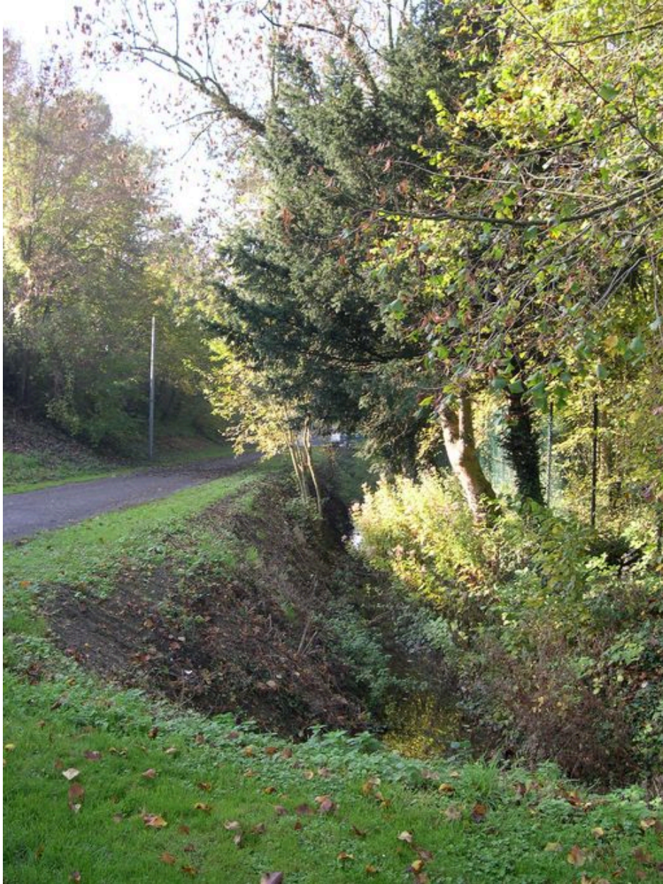
Vue de la douve, à l'est.