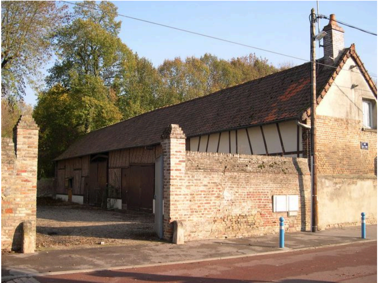
Vue des communs.