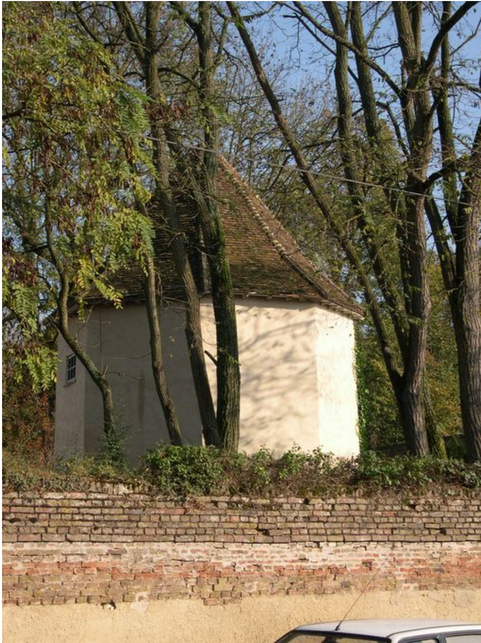
Vue du colombier.