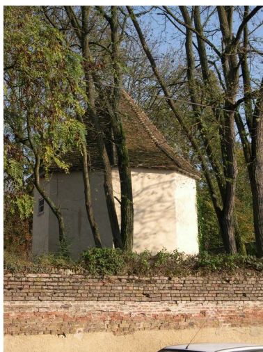
Vue du colombier.