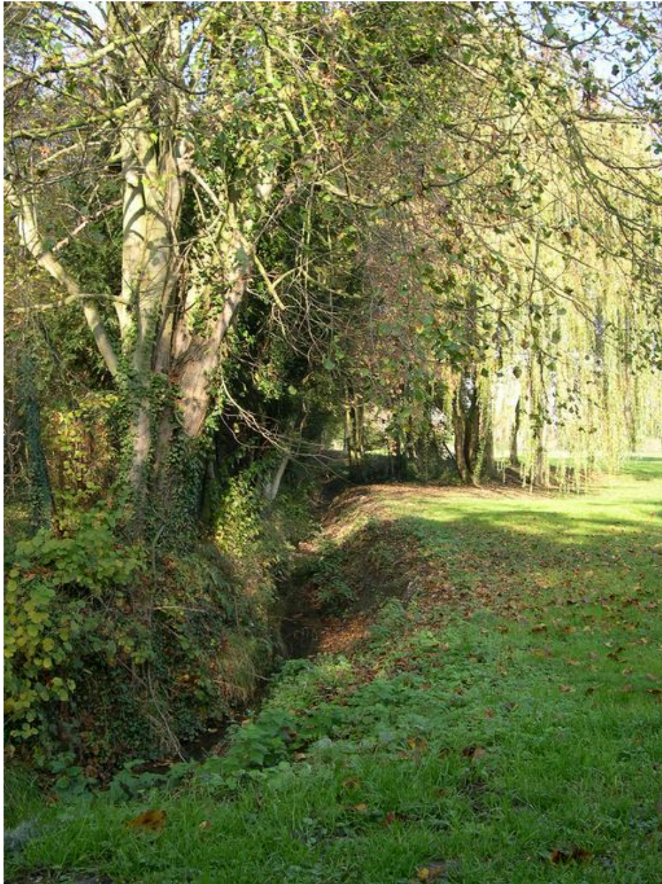
Vue de la douve, au nord-est.