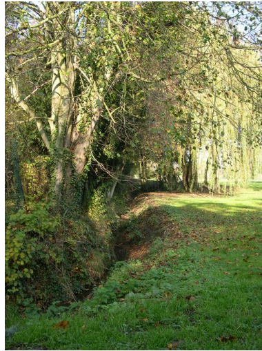
Vue de la douve, au nord-est. IVR22_20048010554NUCA