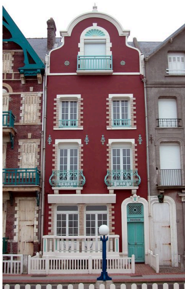
Vue d'ensemble de la maison dite Fantaisie. IVR22_20048001405NUCA