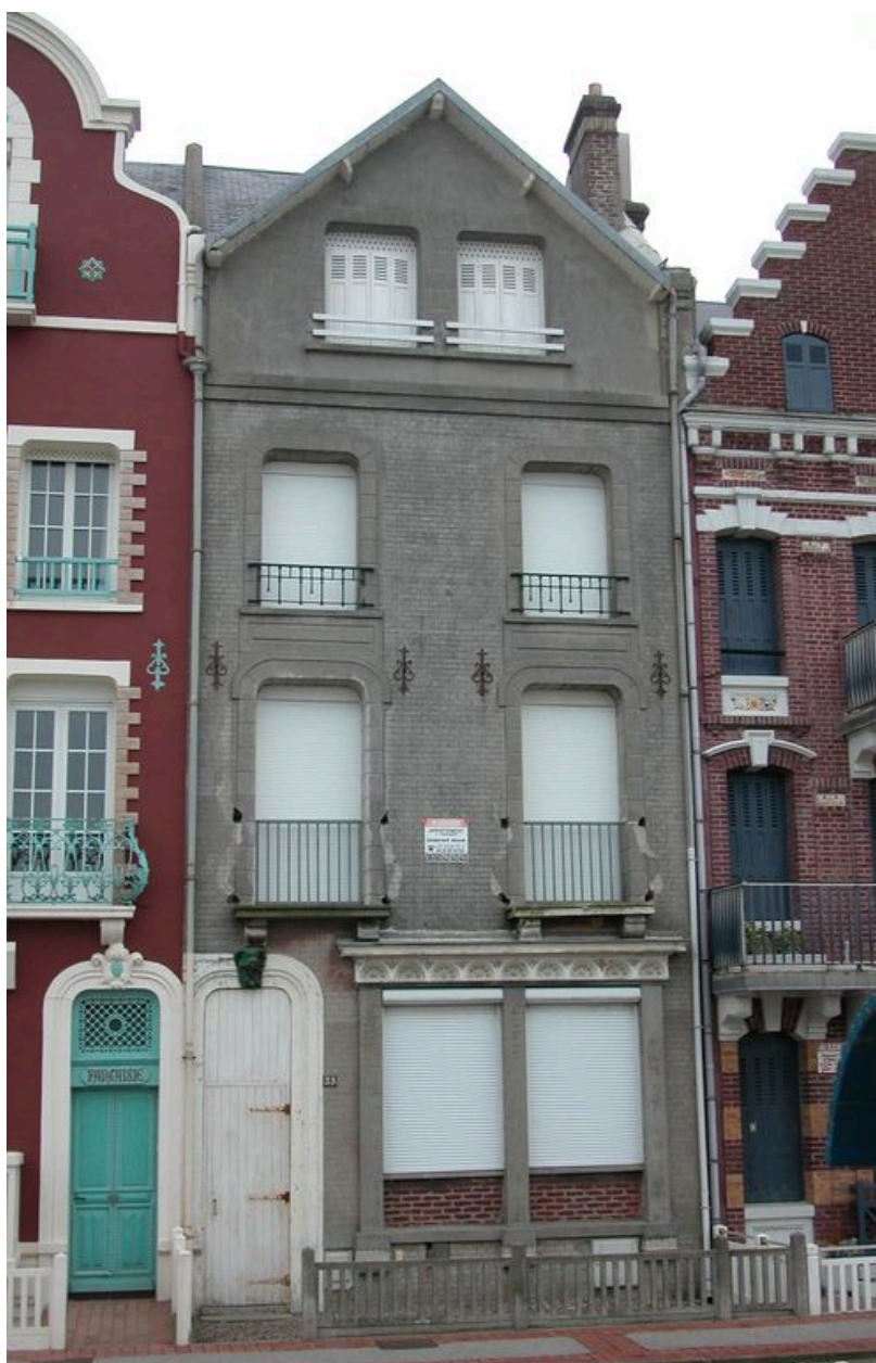
Vue d'ensemble de la maison dite Espana.