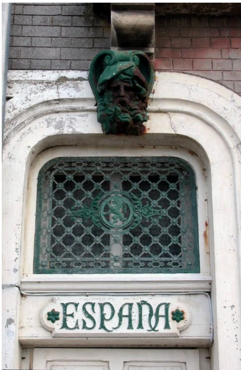
Détail du décor de la porte d'entrée de la maison dite Espana.