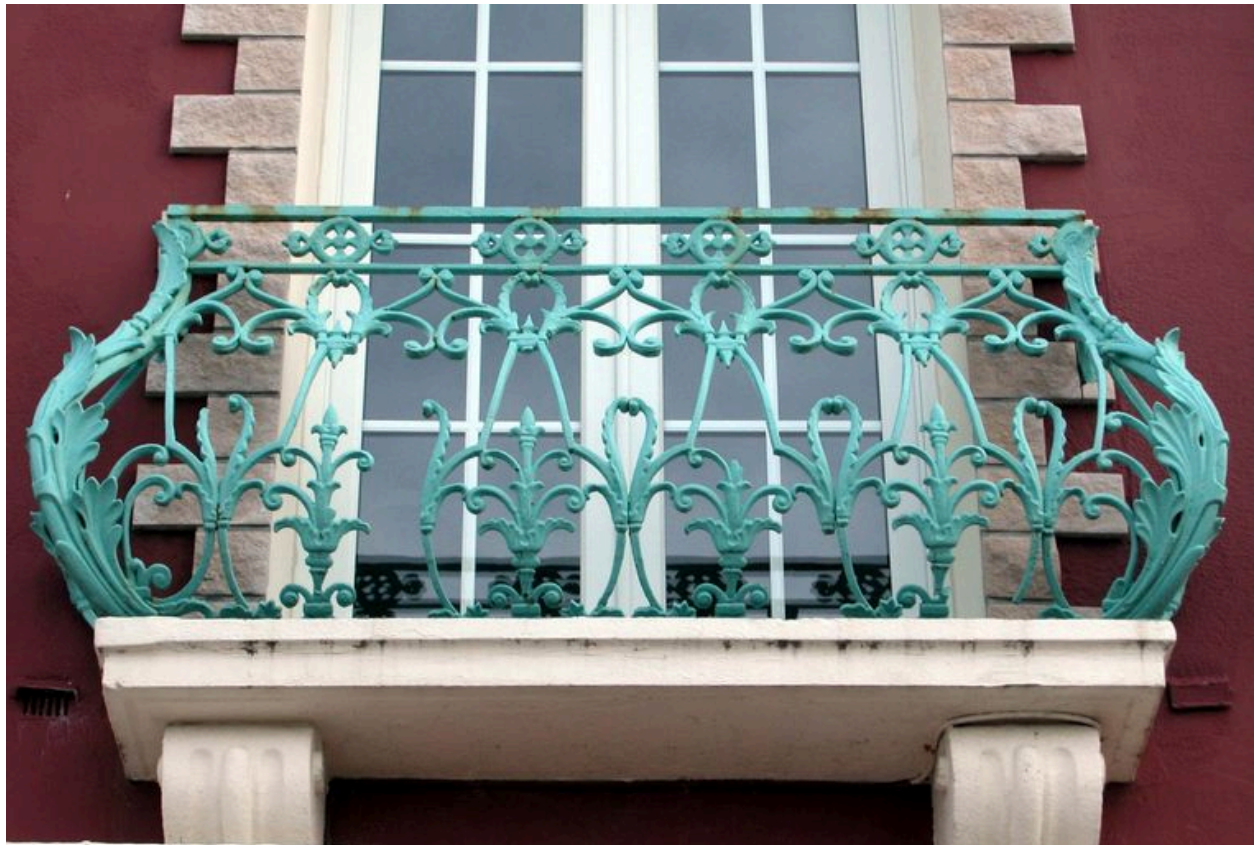
Détail d'un balcon en ferronnerie de la maison dite Fantaisie.