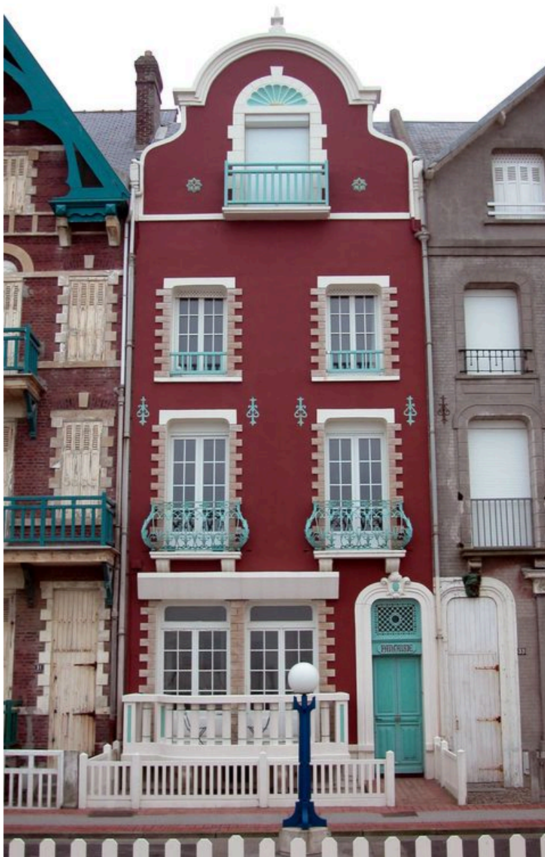
Vue d'ensemble de la maison dite Fantaisie.