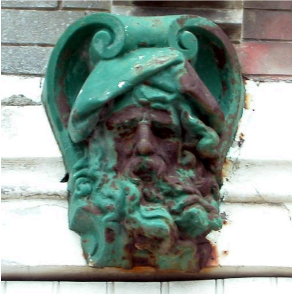
Détail de la clé de la porte de la maison dite Espana.