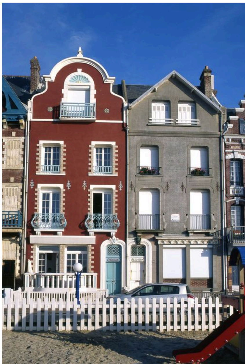
Vue d'ensemble depuis l'esplanade.