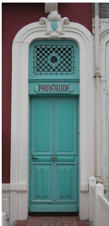
Détail de la porte de la maison dite Fantaisie. IVR22_20048001407NUCA