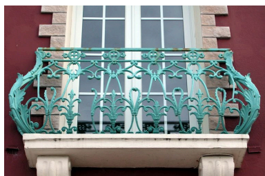
Détail d'un balcon en ferronnerie de la maison dite Fantaisie. IVR22_20048001455NUCA