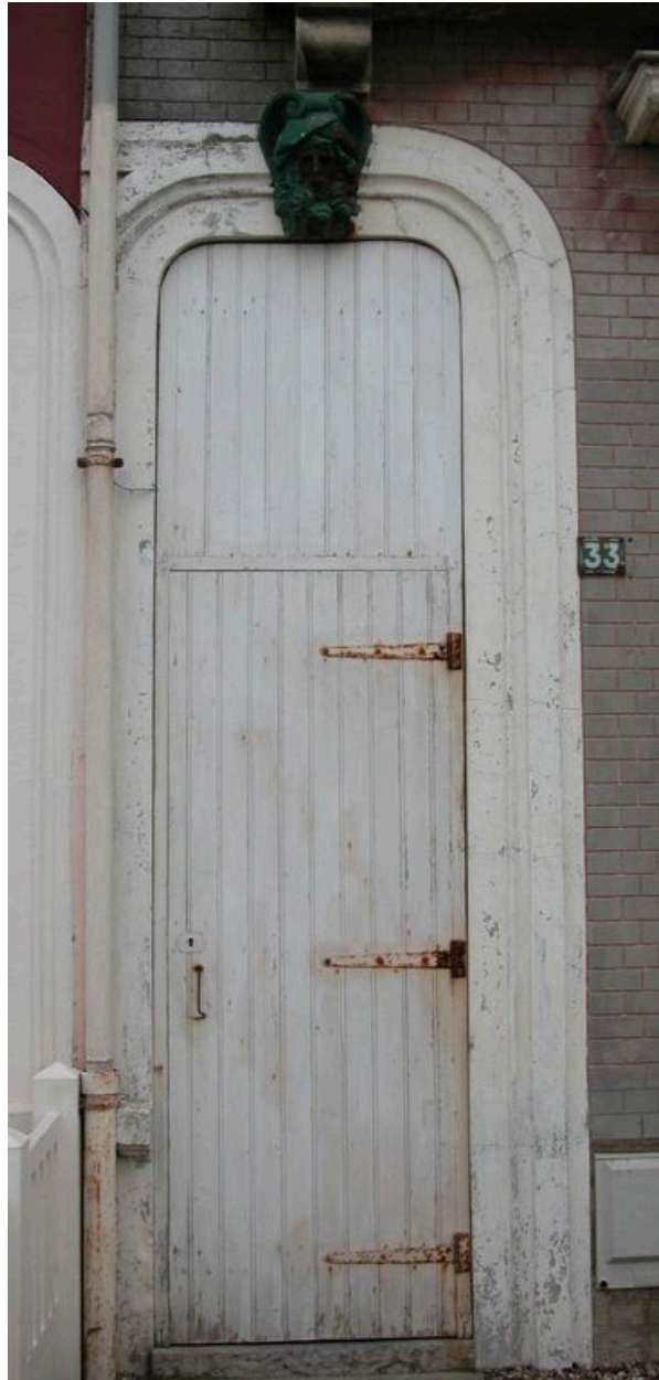
Détail de la porte de la maison dite Espana, protégée par une double porte en bois.