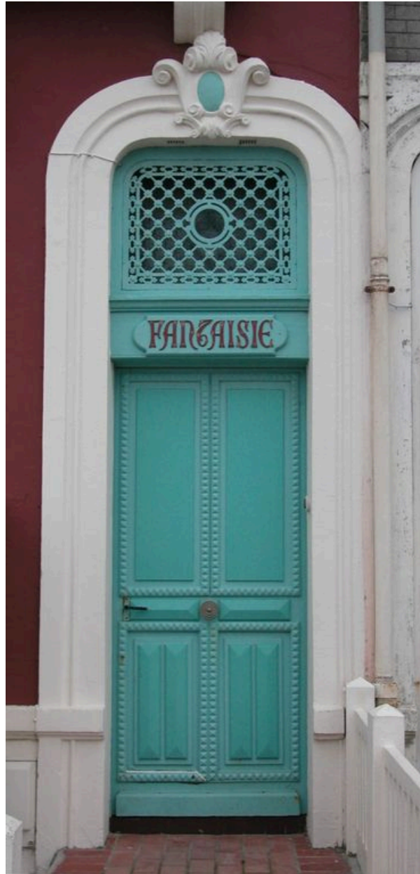
Détail de la porte de la maison dite Fantaisie.