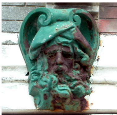
Détail de la clé de la porte de la maison dite Espana.