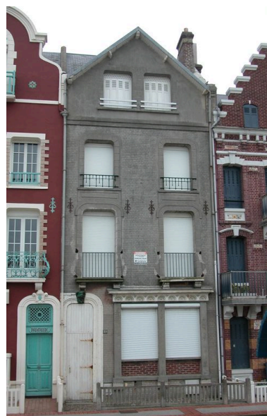
Vue d'ensemble de la maison dite Espana. IVR22_20048001406NUCA