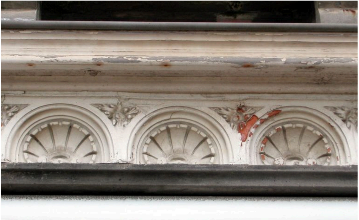
Détail de la frise ornant le linteau de la maison dite Espana.