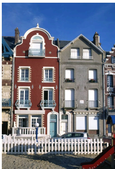
Vue d'ensemble depuis l'esplanade. IVR22_20048000296XA