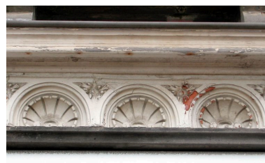
Détail de la frise ornant le linteau de la maison dite Espana.