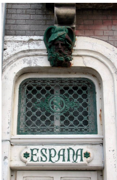
Détail du décor de la porte d'entrée de la maison dite Espana.