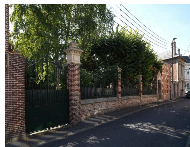
Portail et mur de clôture, rue Vadé. IVR22_20158000876NUC2A