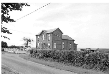
Vue générale. IVR22_19980202391Z

IVR22_20080290080NUCA