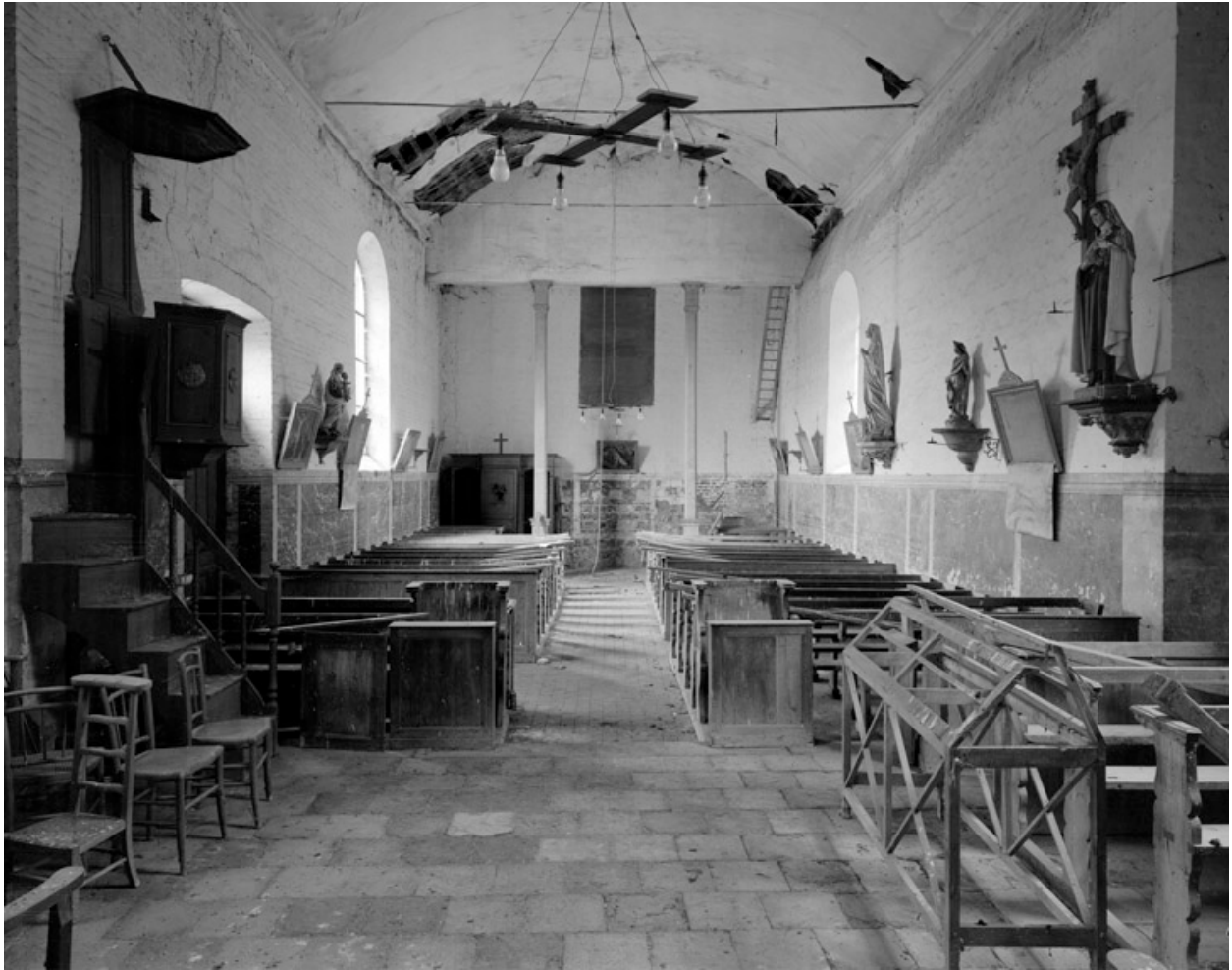
Vue intérieure, depuis le chœur.