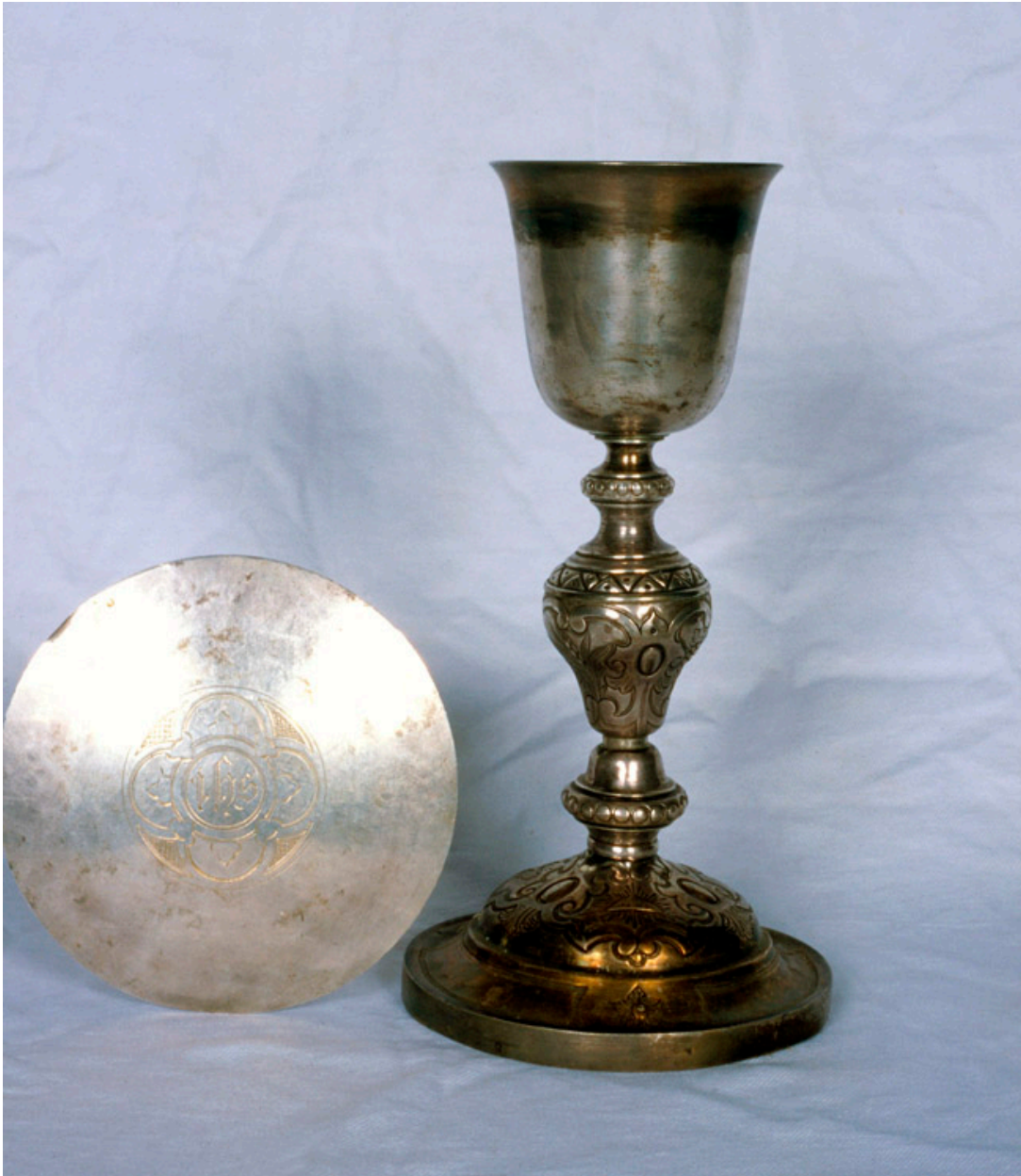
Calice (Armand-Calliat) et patène (Jamain et Chevron).