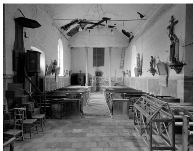
Vue intérieure, depuis le chœur. IVR22_19998001073V