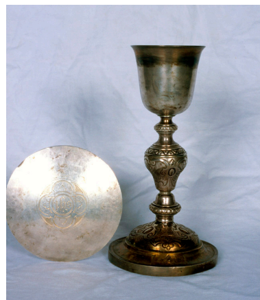
Calice (Armand-Calliat) et patène (Jamain et Chevron).