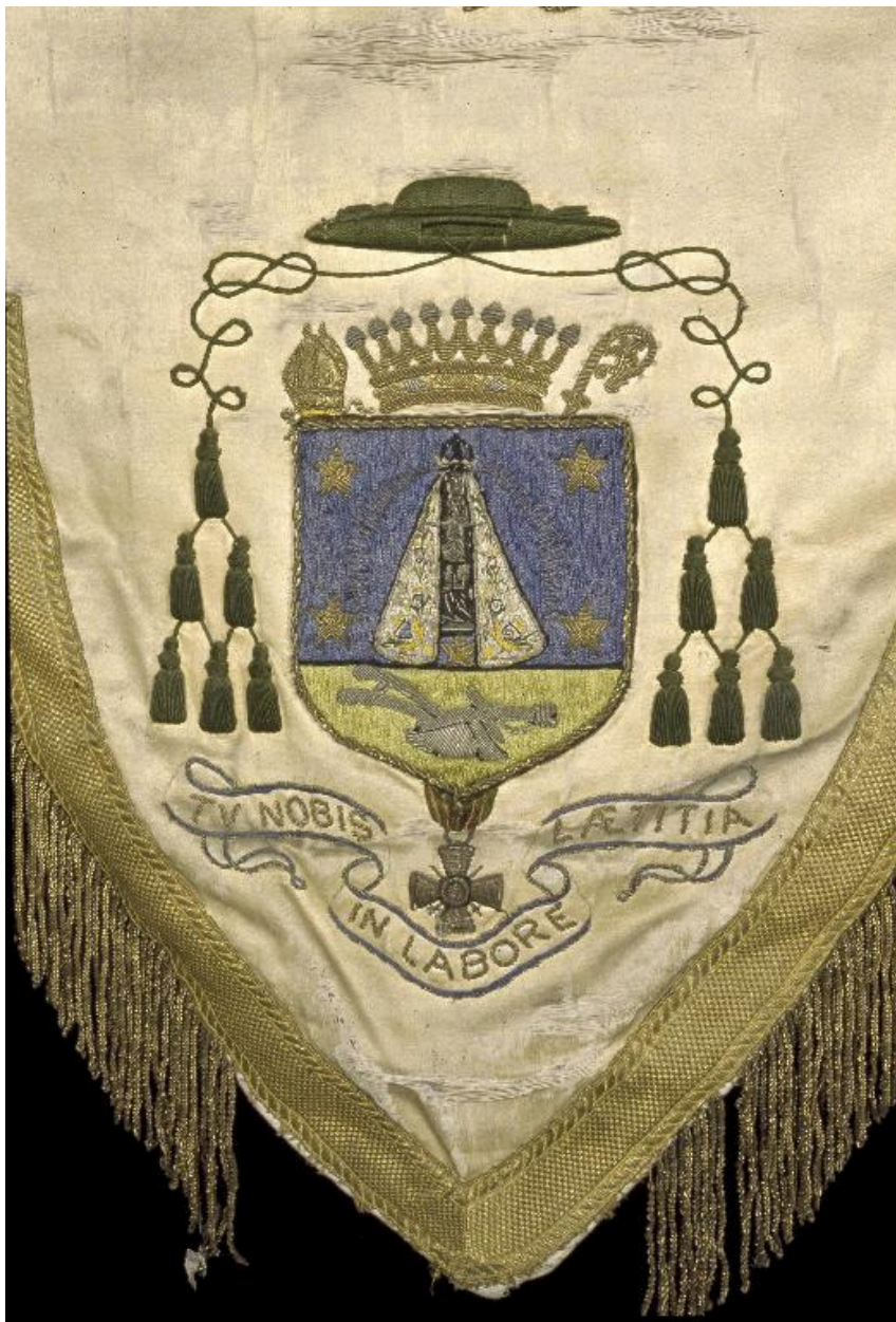
Détail de la bannière : vue des armoiries de monseigneur Henri Binet.