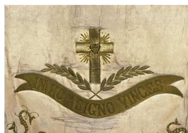
Détail de la bannière : vue du décor central. IVR22_20020200680ZA