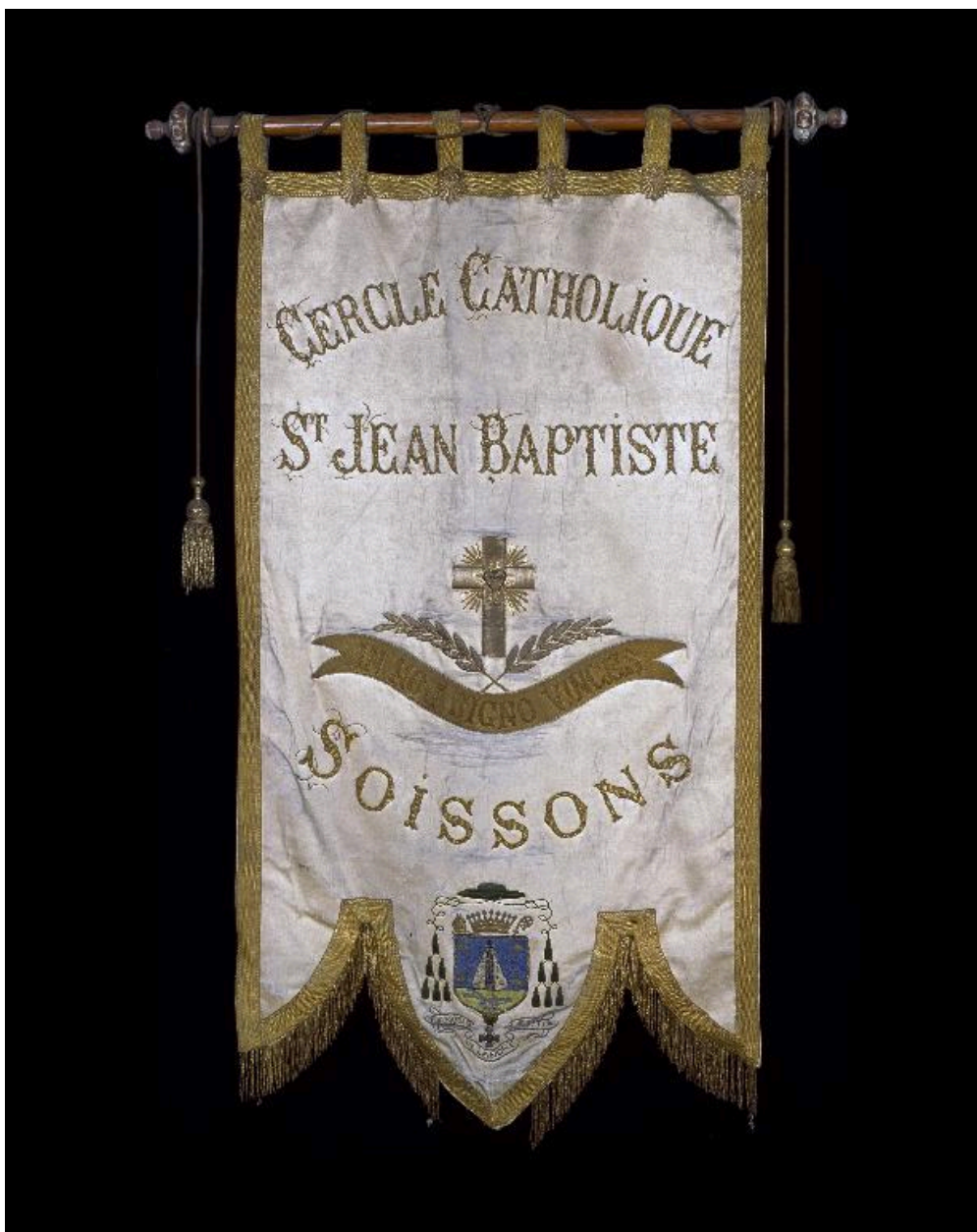
Vue générale de la face principale.