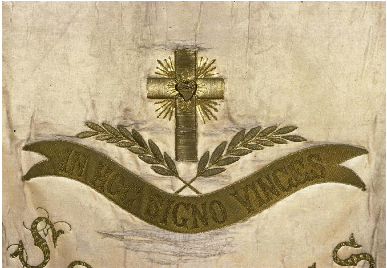
Détail de la bannière : vue du décor central.