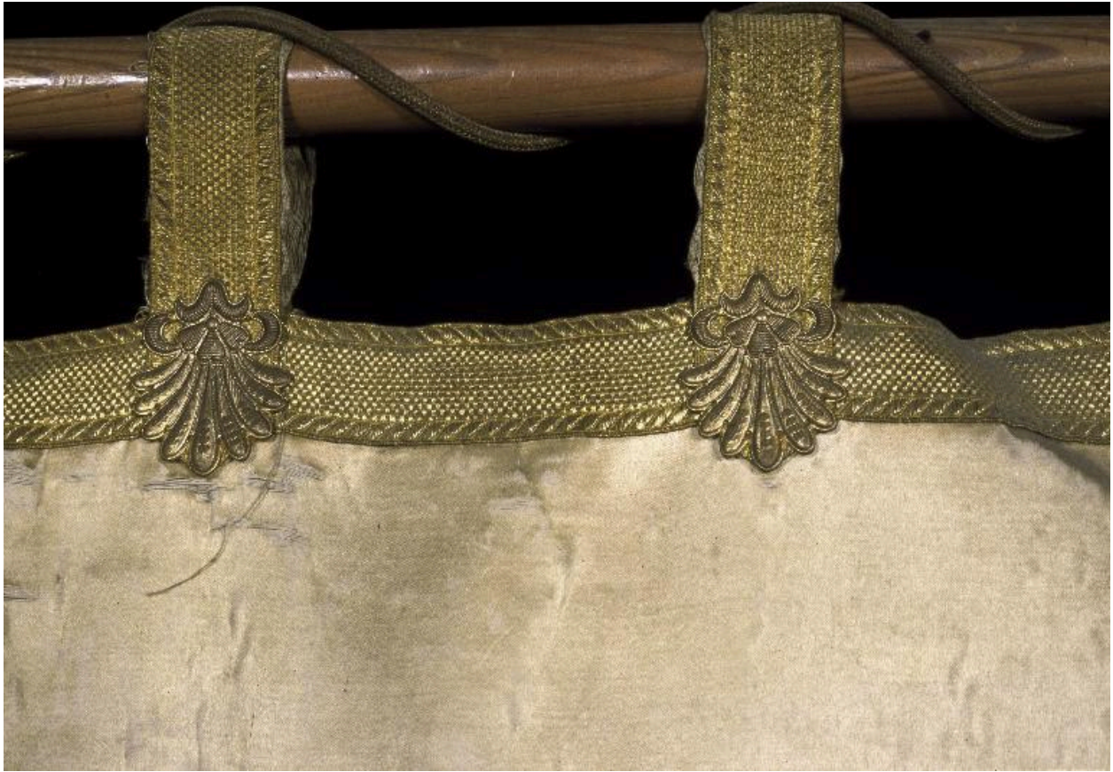
Détail de la bannière : brides servant à la suspendre au bâton transversal.