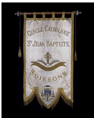
Vue générale de la face principale.