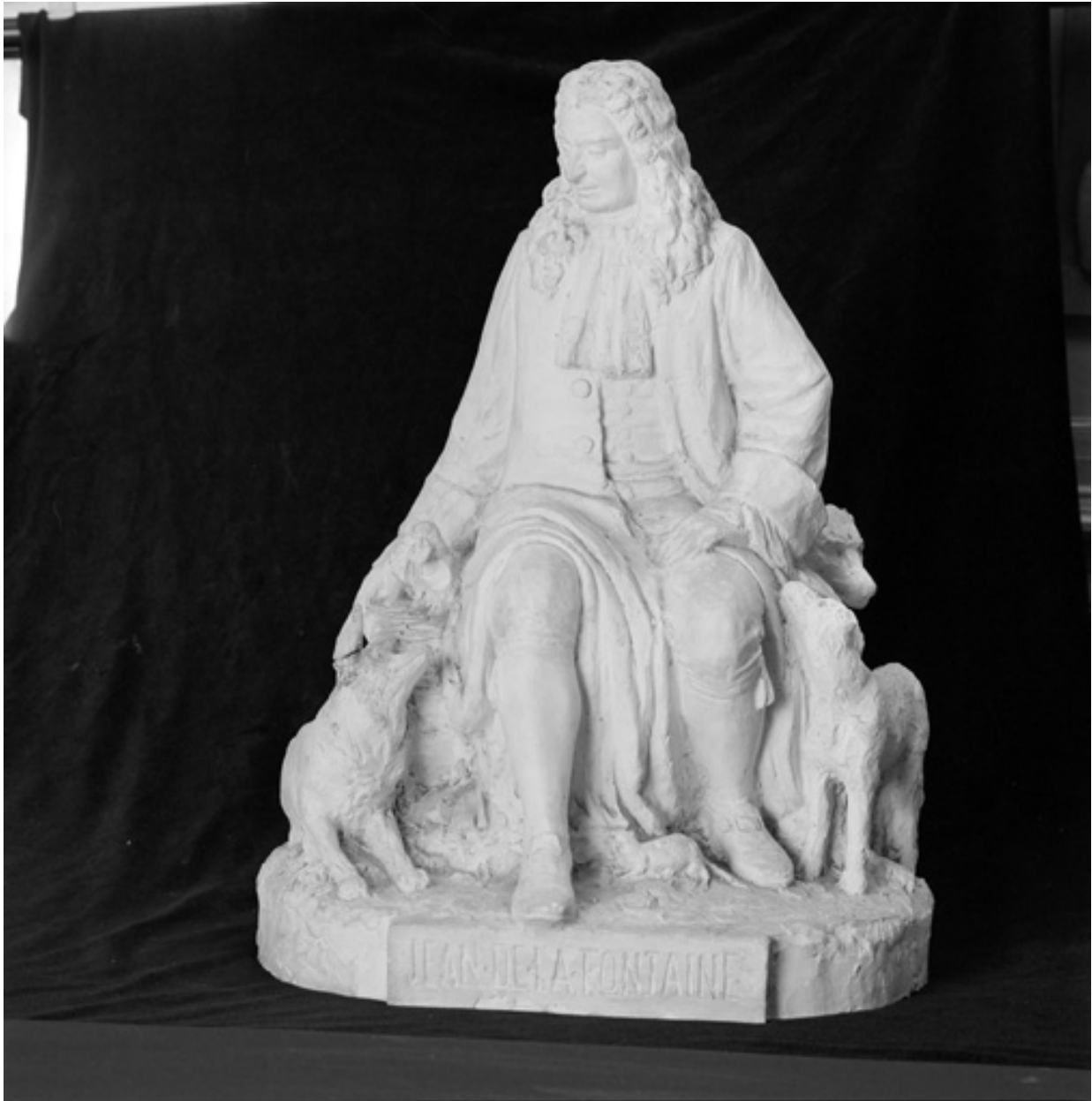
Plâtre de J.B. Descamps, milieu 19e siècle, vue de face. Collections de la S.H.A.C.T.