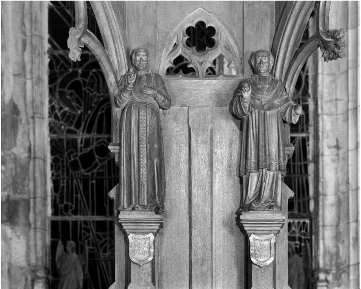
Détail du dorsal orné des statues du pape Pie IX et de l'évêque de Soisson, Jules-François de Simony.