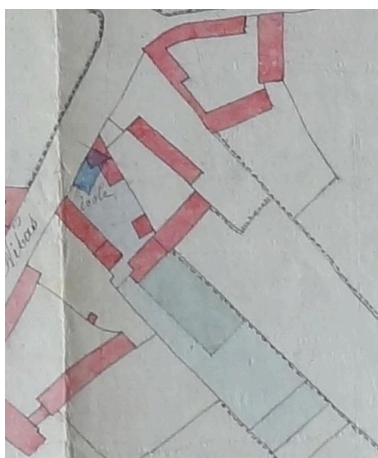
Détail du plan cadastral indiquant l'implantation de la nouvelle école mixte de Saucourt, 1877 (AD Somme ; 99 O 2287). IVR22_20158006481NUCA