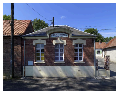
Vue de la façade antérieure. IVR22_20158000566NUC2A