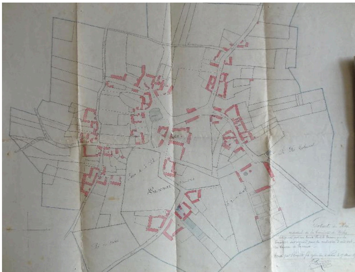
Plan cadastral indiquant l'implantation de la nouvelle école mixte de Saucourt, 1877 (AD Somme ; 99 O 2287).