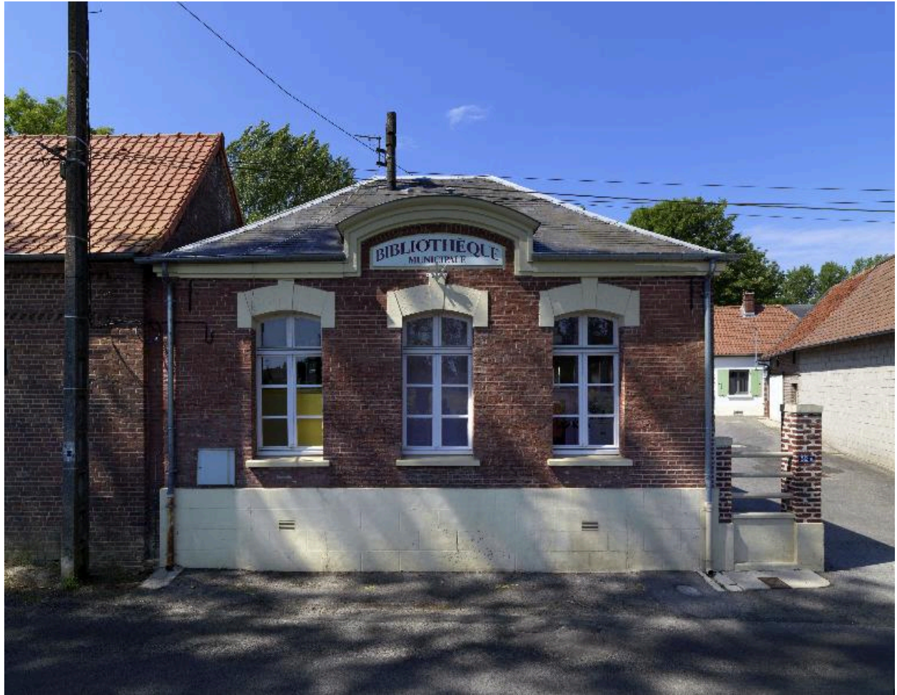
Vue de la façade antérieure.