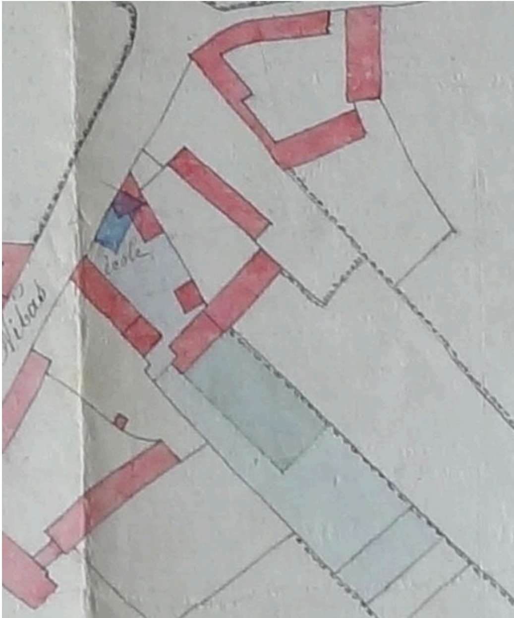
Détail du plan cadastral indiquant l'implantation de la nouvelle école mixte de Saucourt, 1877 (AD Somme ; 99 O 2287).