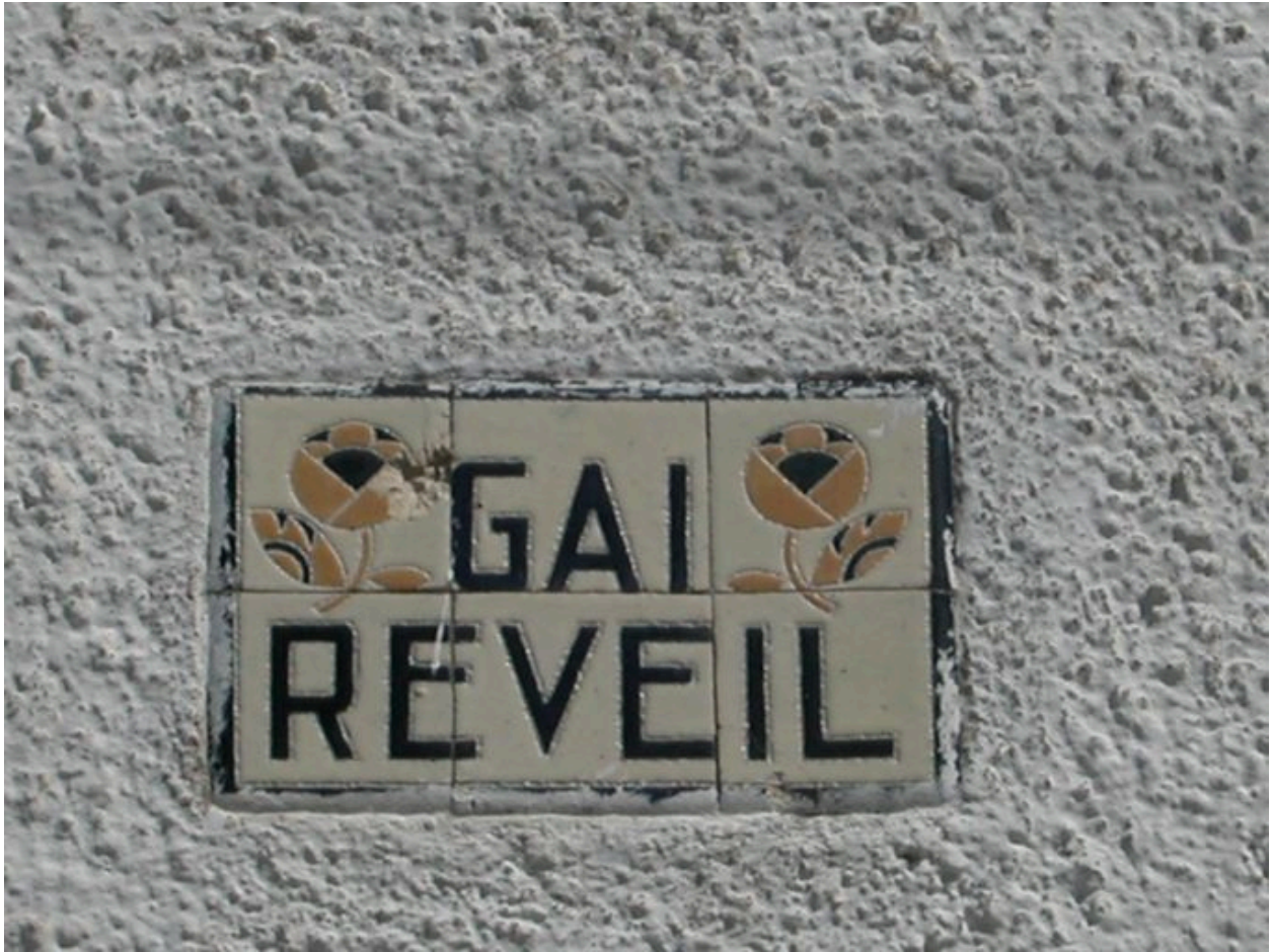
Détail du carreau de céramique portant appellation.