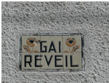
Détail du carreau de céramique portant appellation. IVR22_20058003937NUCA