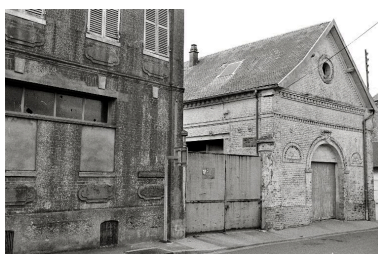
Vue de l'ancien entrepôt de marchand de vins transformé en atelier, en 1990.