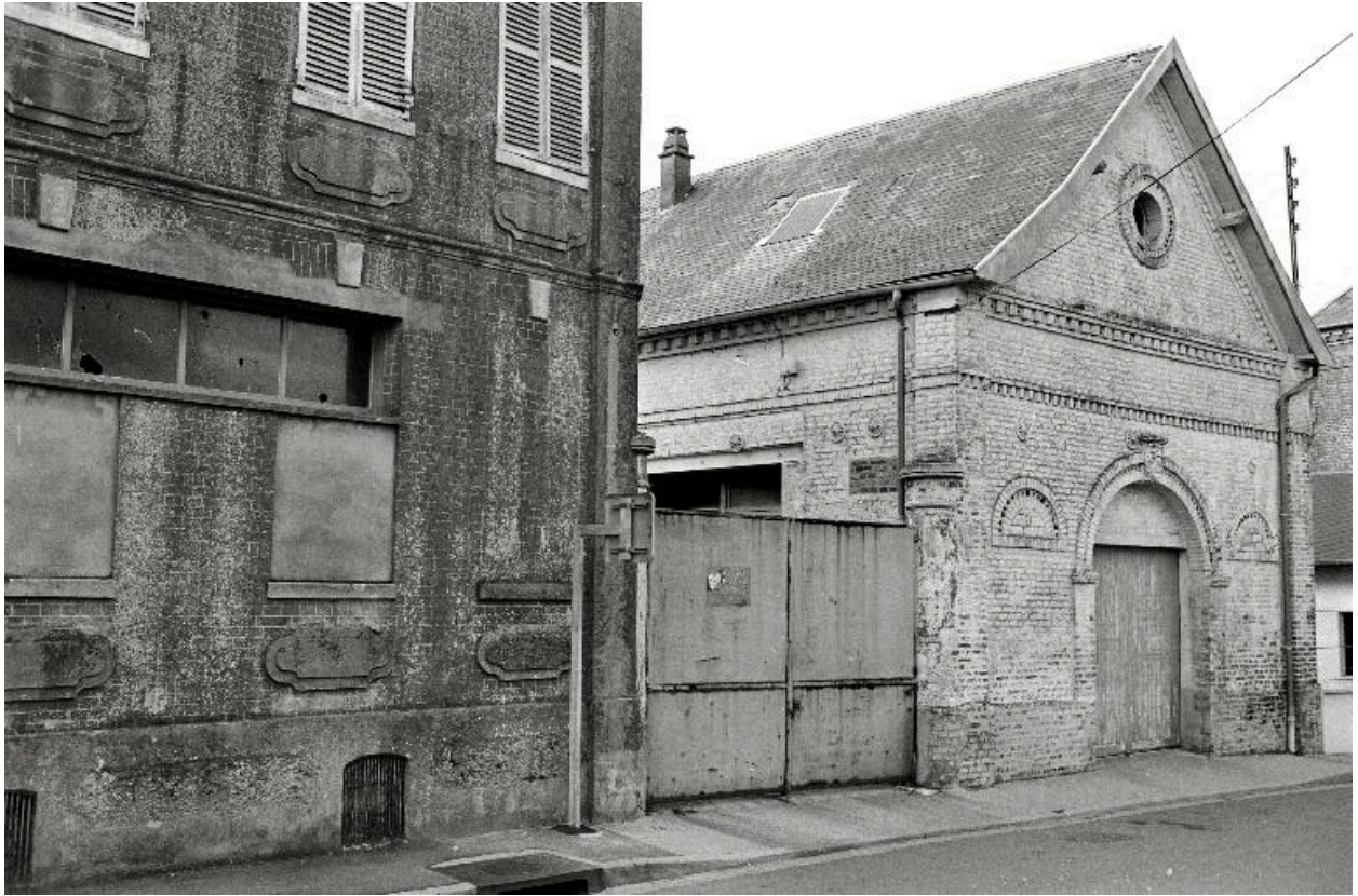
Vue de l'ancien entrepôt de marchand de vins transformé en atelier, en 1990.