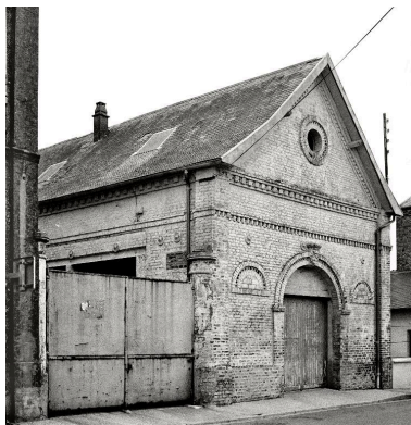
Vue partielle de l'entrepôt de marchand de vins transformé en atelier, en 1990.