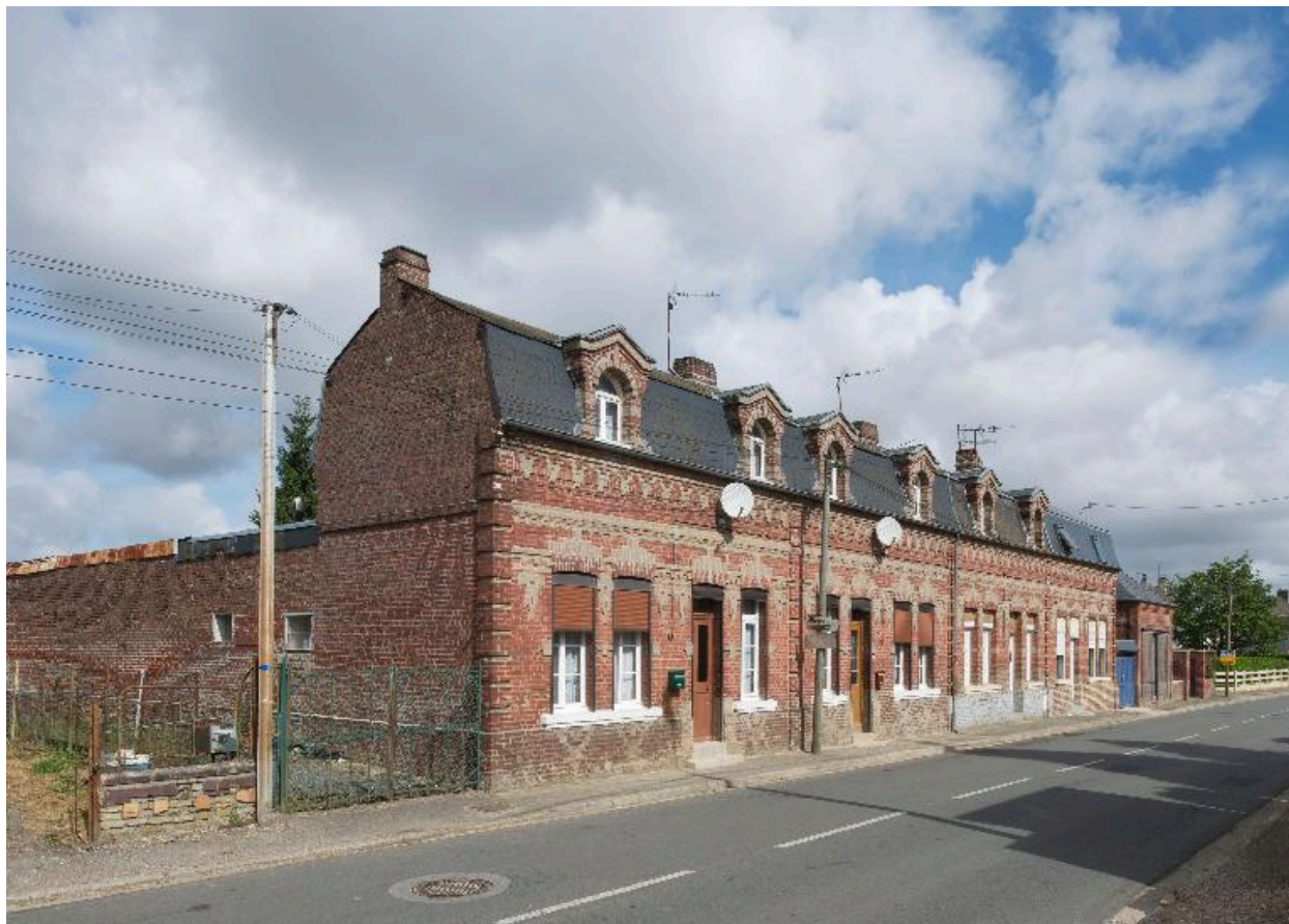
Maisons de rapport, construites en 1910, rue de Cornehotte.