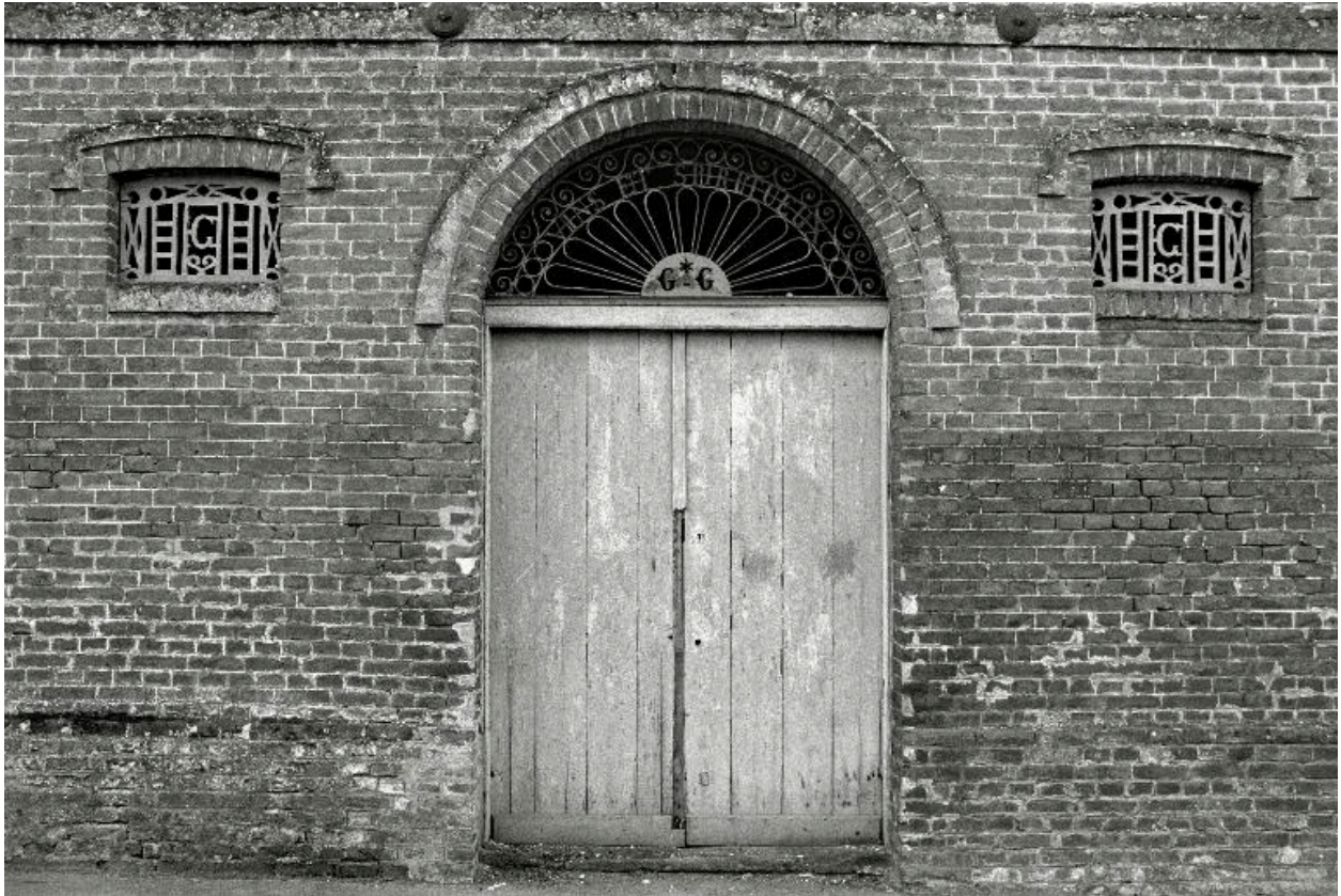
Vue de détail sur la porte de l'ancien entrepôt Grandsire (1880), en 1990.