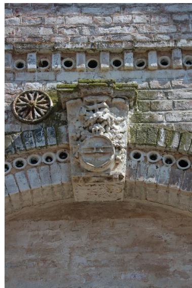
Détail de la clé de voûte de l'entrepôt du marchand de vins. IVR22_20128005257NUC2A