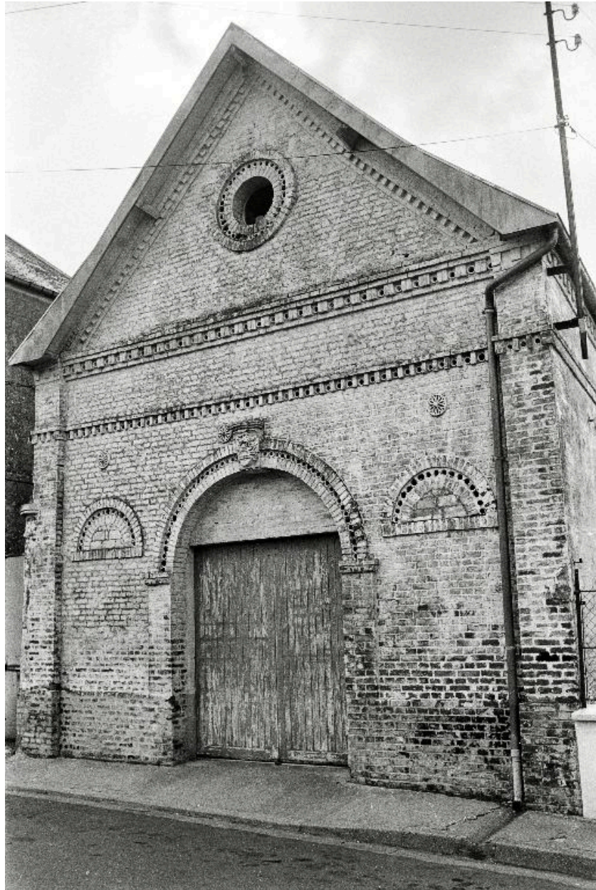
Vue du pignon de l'entrepôt de l'ancien marchand de vins, en 1990.