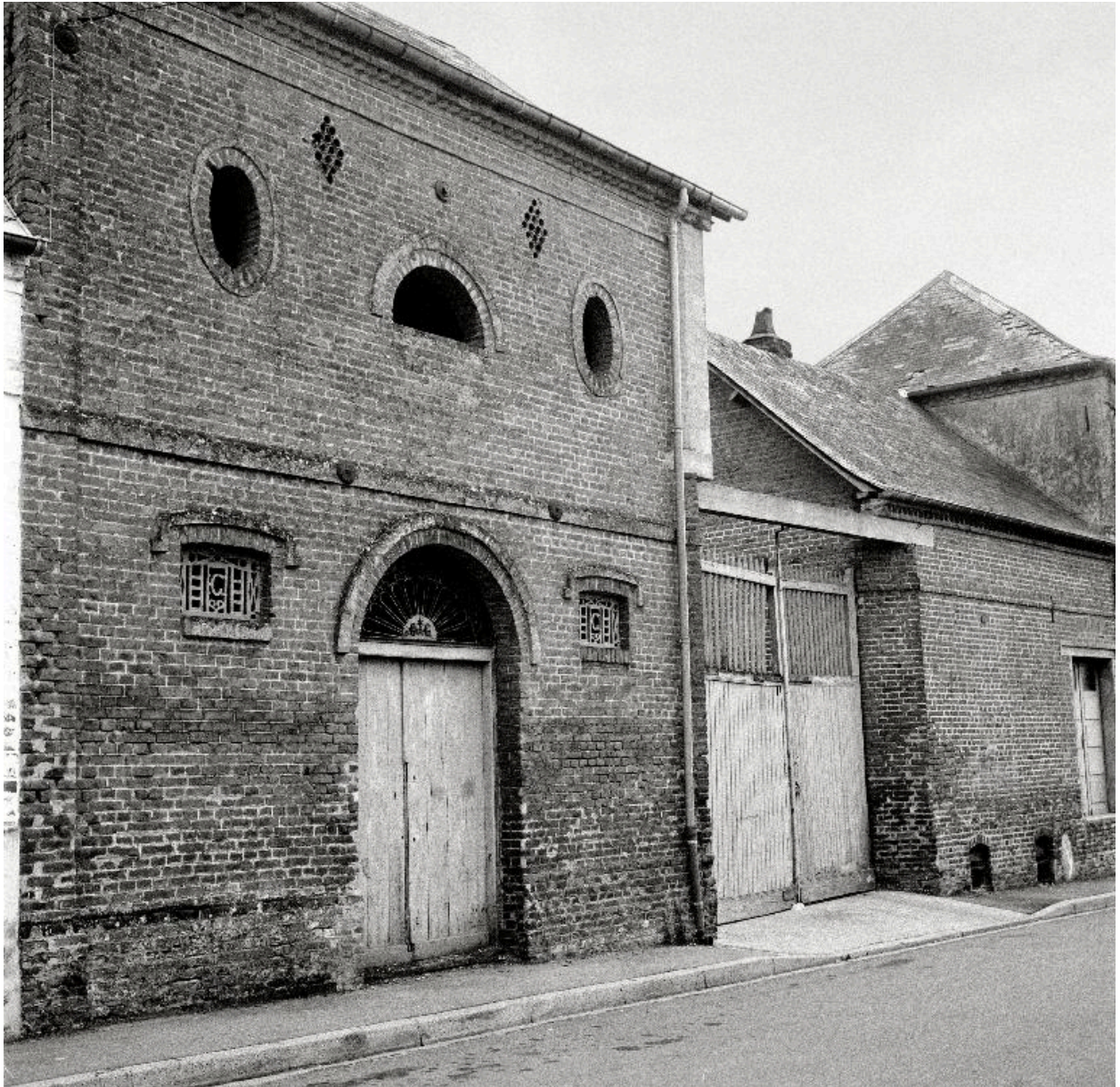
Vue partielle de l'entrepôt Grandsire (1880), en 1990.