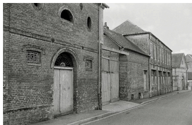
Vue générale, en 1990. IVR22_19908000365Z