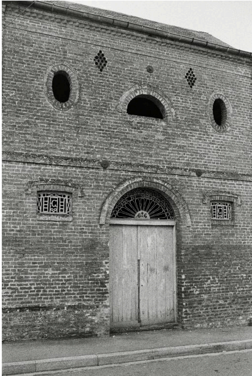
Vue de la façade sur rue de l'ancien entrepôt Grandsire (1880), en 1990.