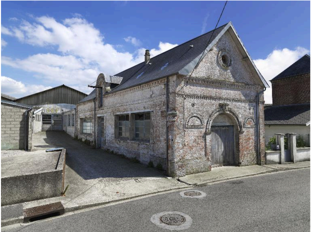
Vue de l'ancien entrepôt de marchand de vins transformé en atelier.