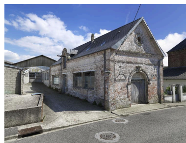
Vue de l'ancien entrepôt de marchand de vins transformé en atelier. IVR22_20158000597NUC2A