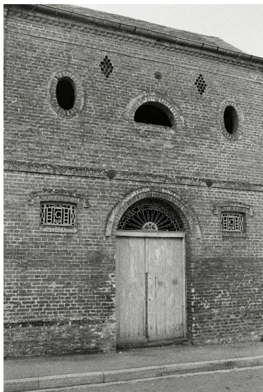
Vue de la façade sur rue de l'ancien entrepôt Grandsire (1880), en 1990. IVR22_19908000364Z