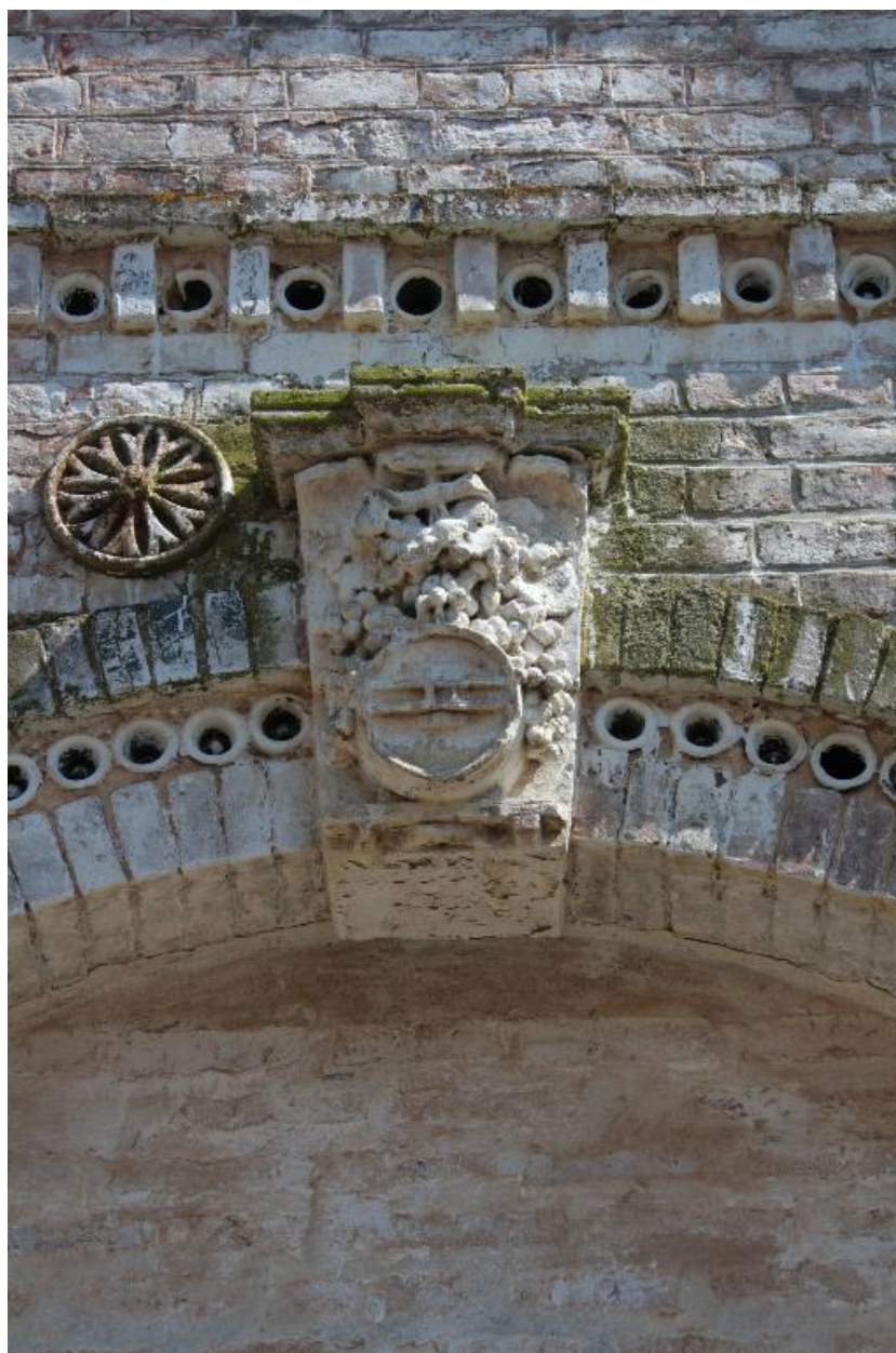
Détail de la clé de voûte de l'entrepôt du marchand de vins.