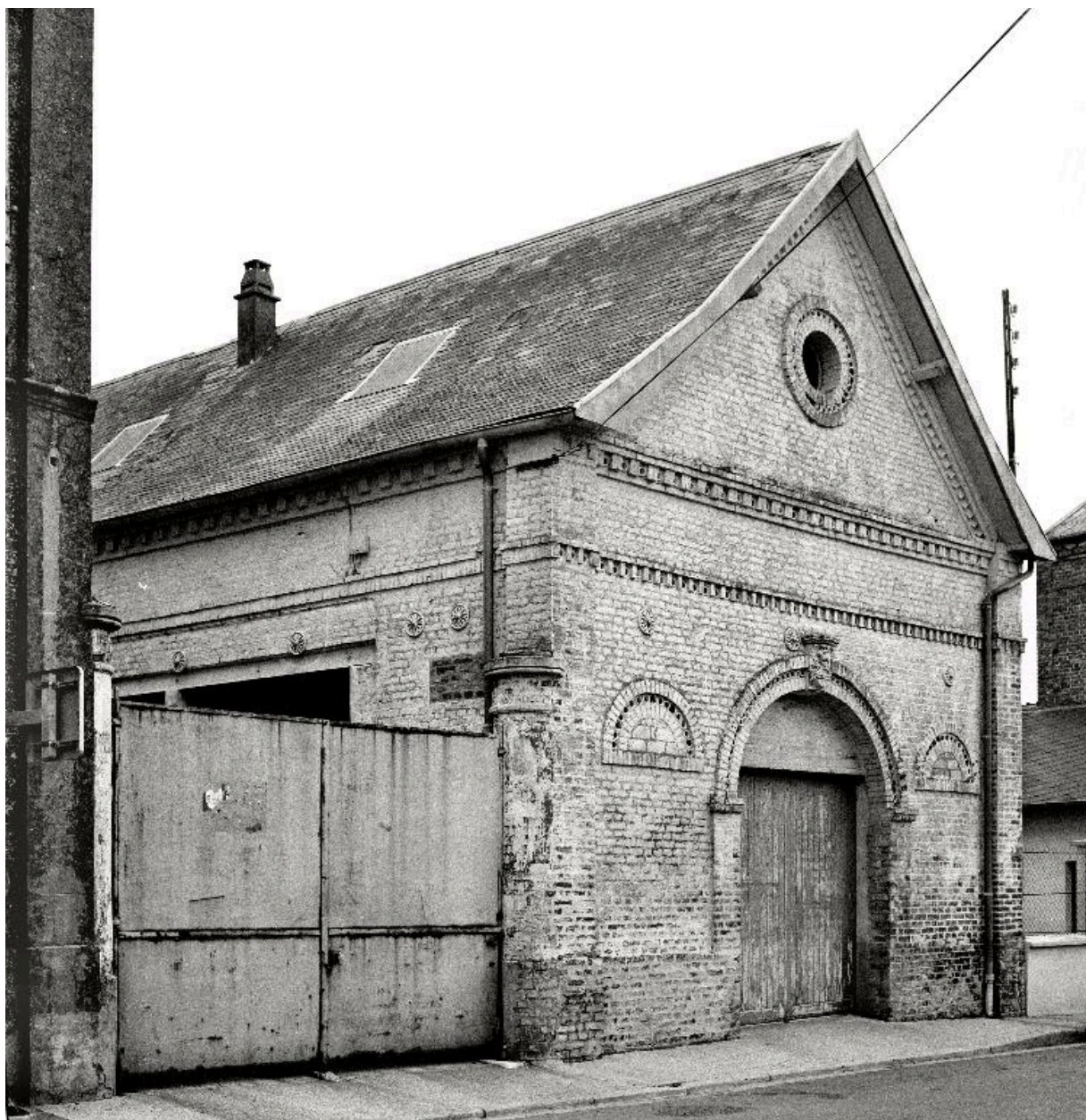
Vue partielle de l'entrepôt de marchand de vins transformé en atelier, en 1990.