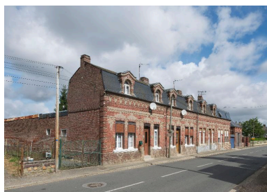
Maisons de rapport, construites en 1910, rue de Cornehotte.