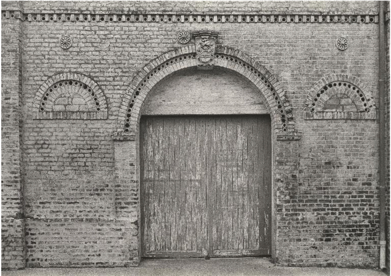
Vue de détail de la porte de l'entrepôt de l'ancien marchand de vins, en 1990.