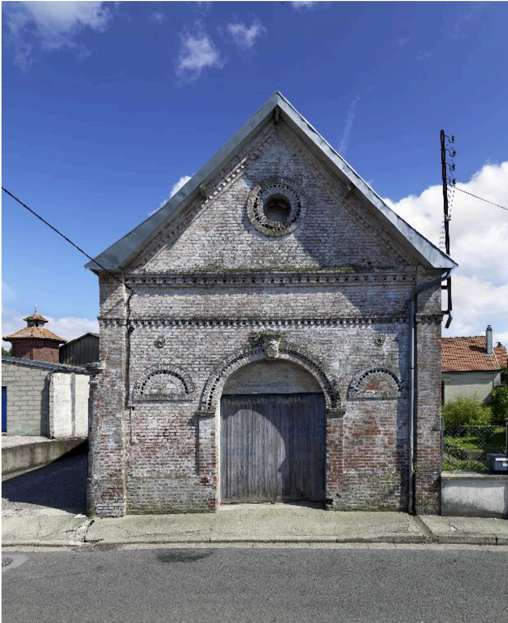
Vue du pignon de l'entrepôt de l'ancien marchand de vins.