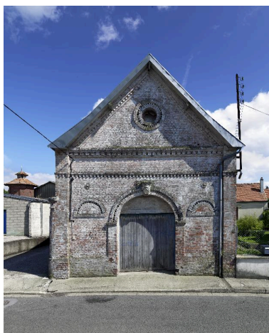
Vue du pignon de l'entrepôt de l'ancien marchand de vins. IVR22_20158000596NUC2AQ