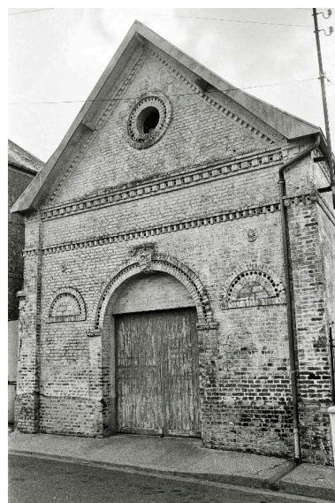
Vue du pignon de l'entrepôt de l'ancien marchand de vins, en 1990.