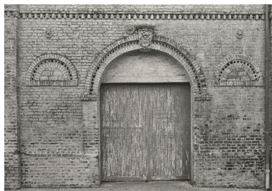
Vue de détail de la porte de l'entrepôt de l'ancien marchand de vins, en 1990.