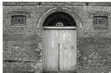
Vue de détail sur la porte de l'ancien entrepôt Grandsire (1880), en 1990. IVR22_19908000363Z