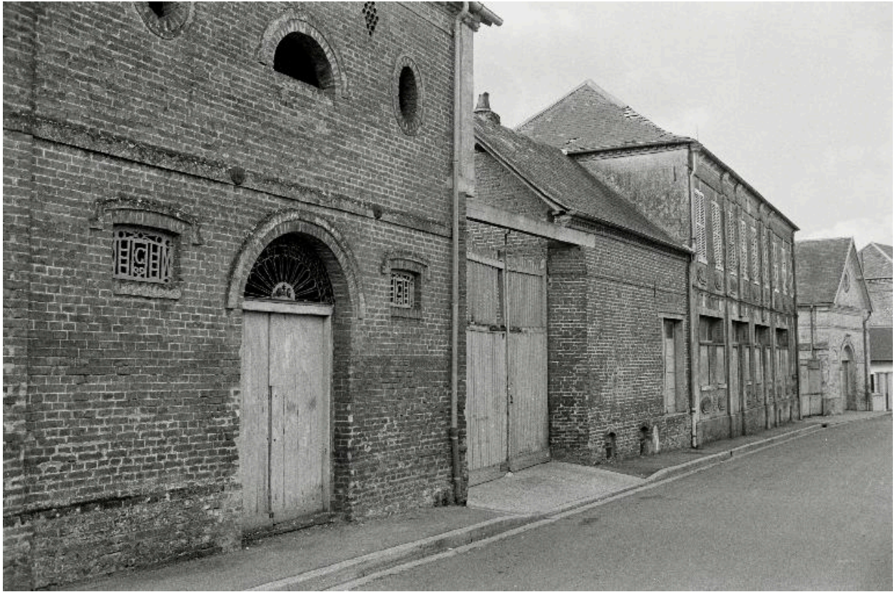
Vue générale, en 1990.