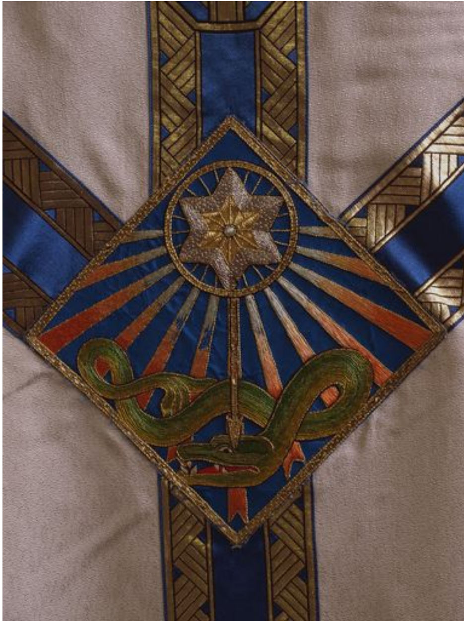
Détail de la chasuble blanche