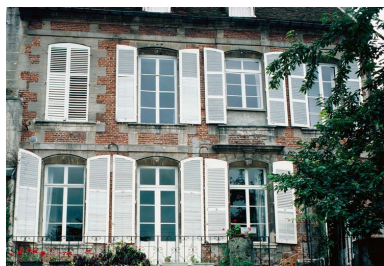
Elévation postérieure, vue partielle.