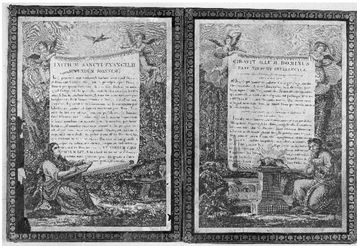
Vue du canon du Lavabo et du Dernier Évangile.