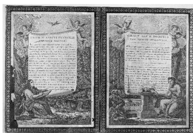
Vue du canon du Lavabo et du Dernier Évangile.