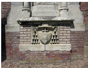
Détail des armoiries d'archevêque. IVR22_20138015733NUC2A