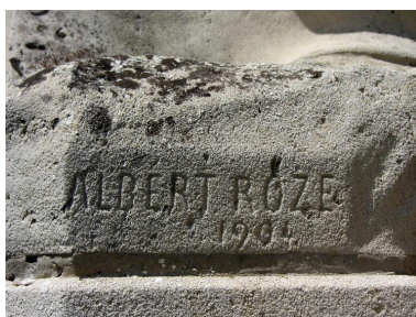
Détail de la date et de la signature du sculpteur. IVR22_20138015735NUC2A