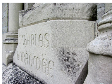
Détail de la signature et de la date. IVR22_20138015609NUC2A