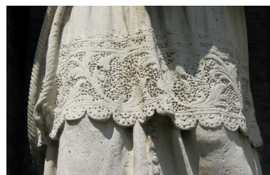
Détail du traitement du rochet en dentelle.