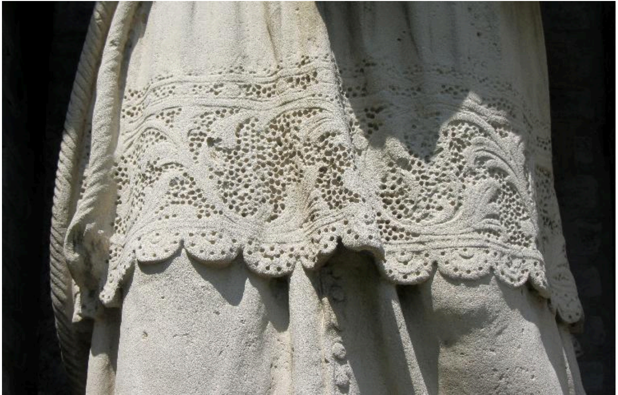
Détail du traitement du rochet en dentelle.