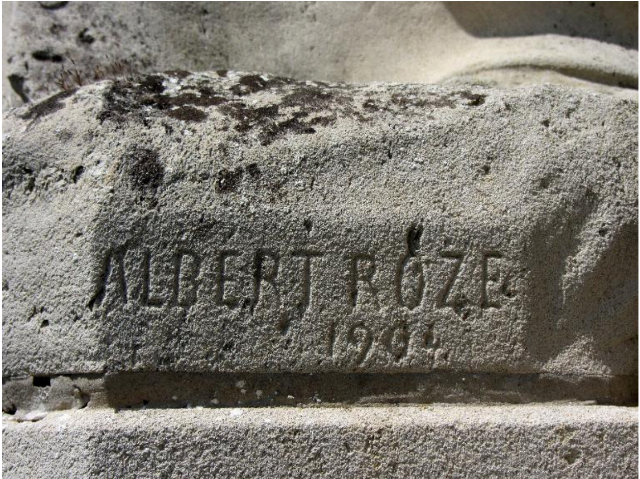
Détail de la date et de la signature du scupteur.