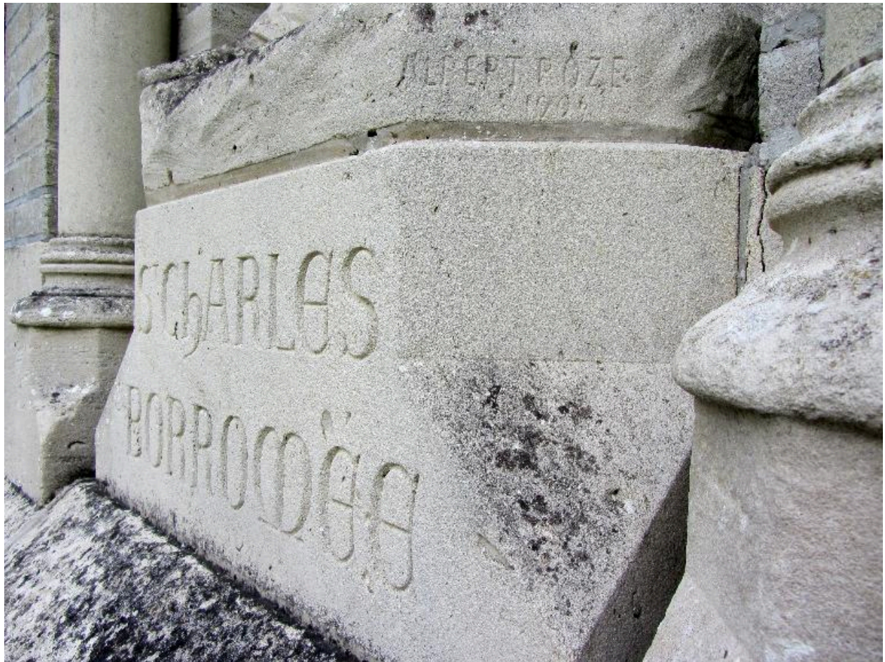
Détail de la signature et de la date.