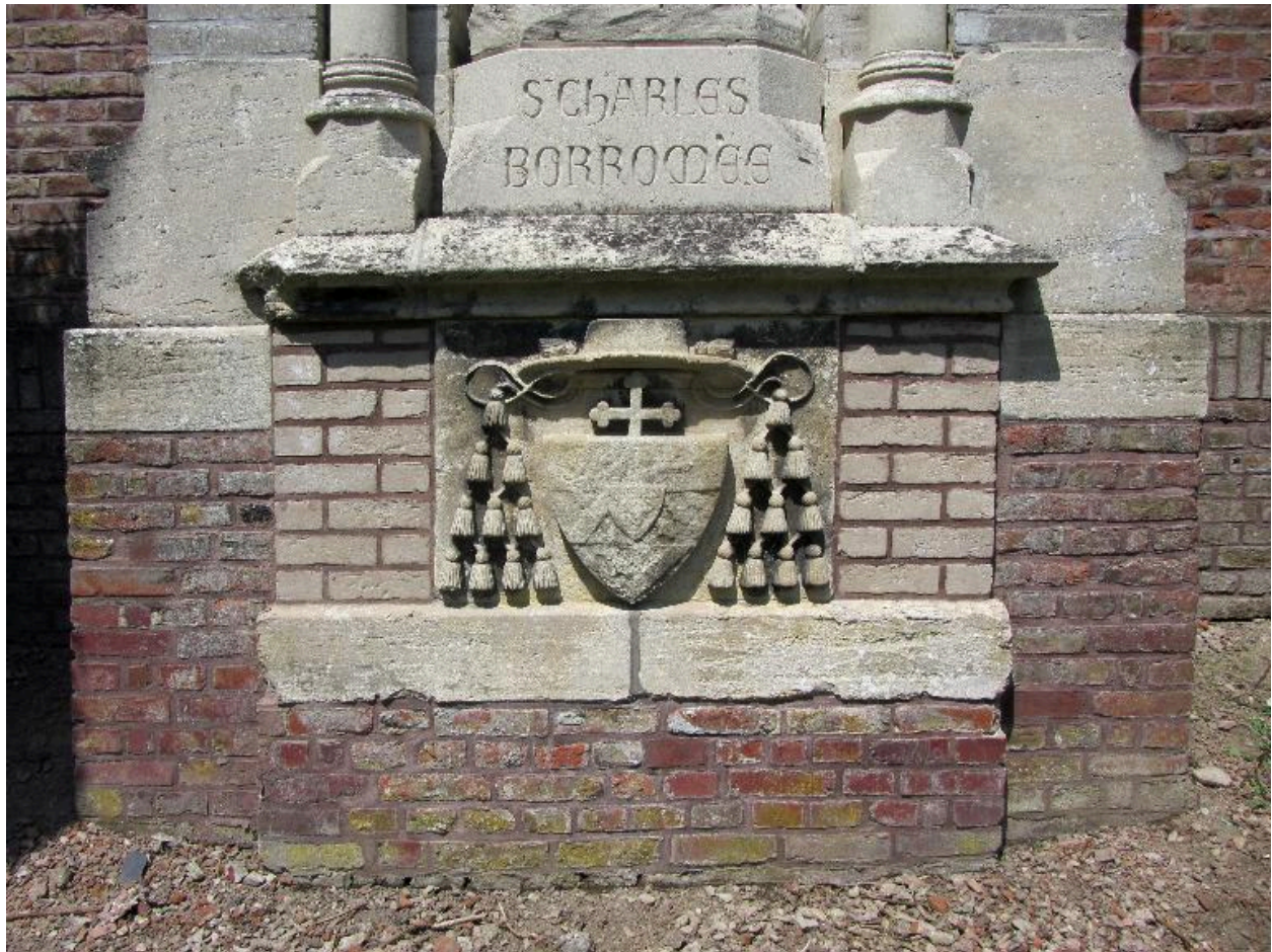
Détail des armoiries d'archevêque.