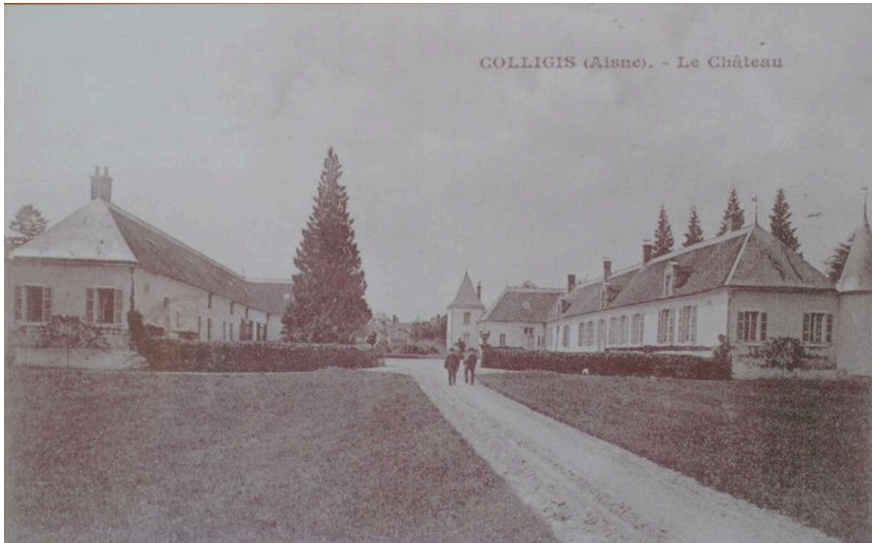
Vue de l'ancien édifice (coll. part).