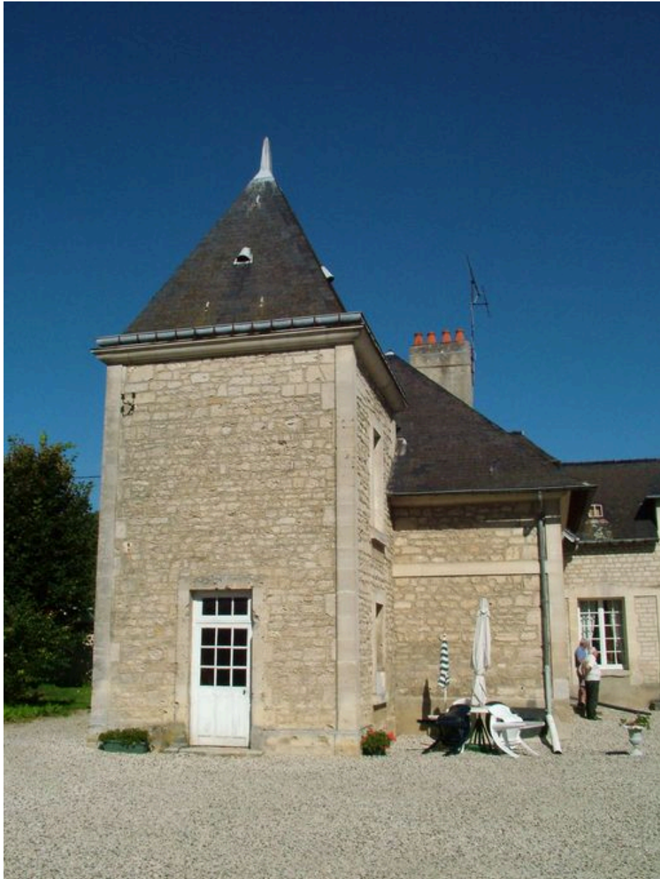
Vue de l'avant-corps gauche.