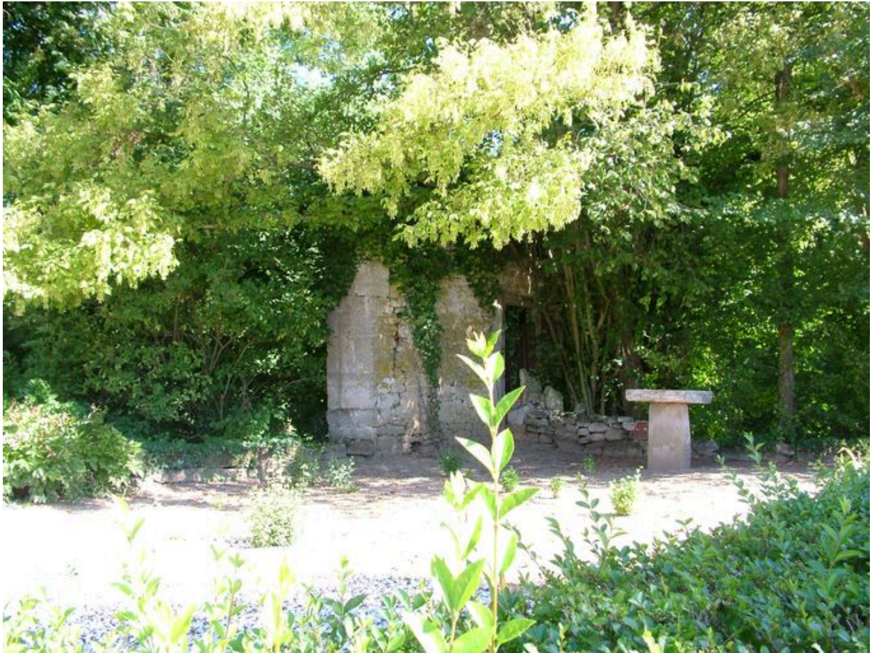
Vue des ruines de l'ancien château encore visibles aujourd'hui.