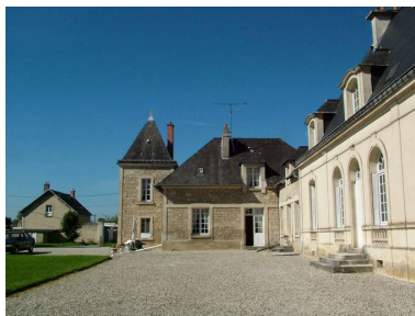
Vue antérieure de l'avant-corps gauche.