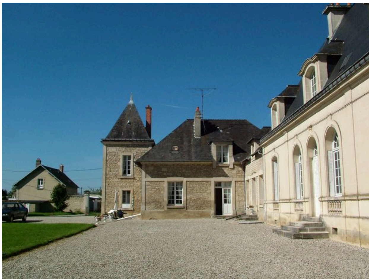
Vue antérieure de l'avant-corps gauche.