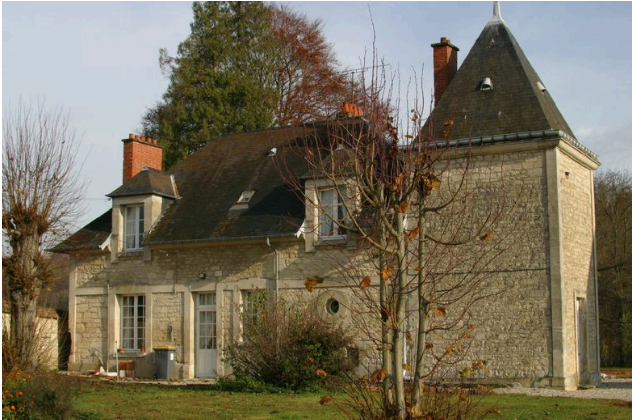
Vue du bâtiment en retour d'angle.