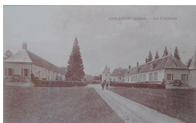
Vue de l'ancien édifice (coll. part). IVR22_20050200671NUCAB