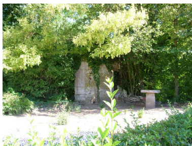
Vue des ruines de l'ancien château encore visibles aujourd'hui.