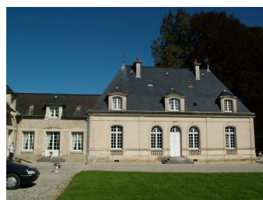
Vue du logis. IVR22_20030202430NUCA