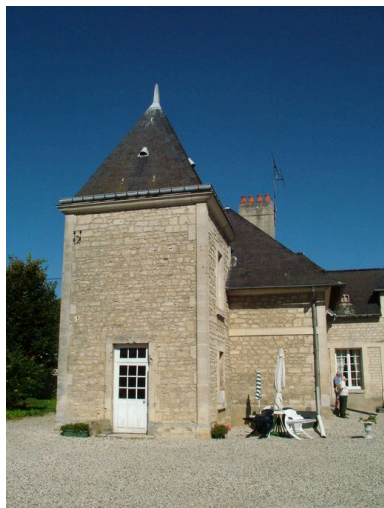
Vue de l'avant-corps gauche. IVR22_20030202429NUCA