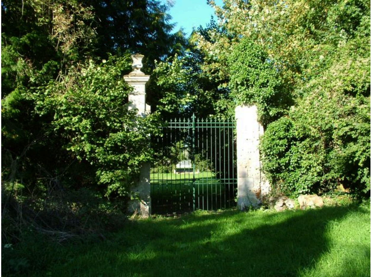
Vue de l'entrée antérieure.