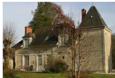
Vue du bâtiment en retour d'angle.