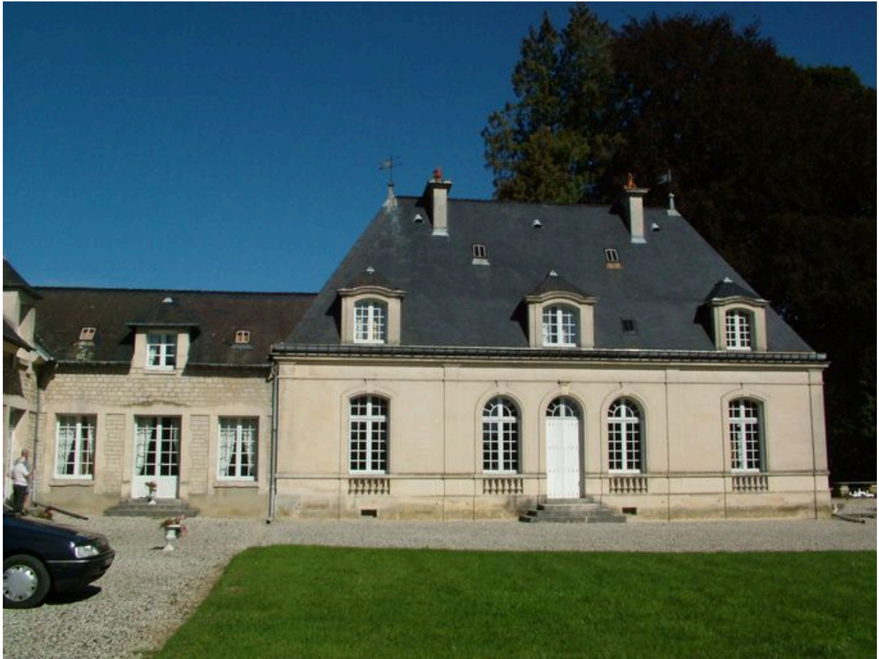
Vue du logis.