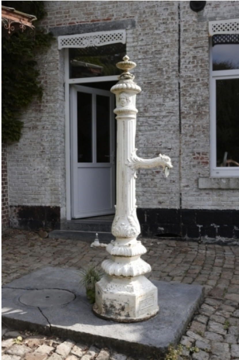
Vue de la pompe à eau située dans la cour.