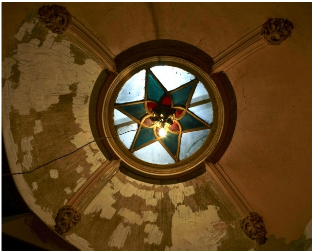
Détail de la verrière surmontant l'escalier situé dans le bâtiment abritant les pièces de réception.