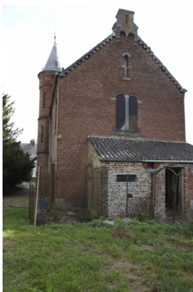
Vue du pignon des écuries.