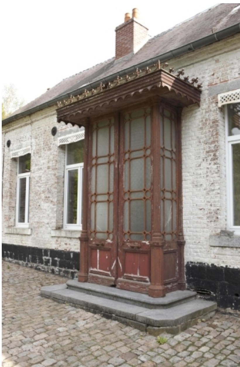
Détail du porche vitré hors-oeuvre en menuiserie.