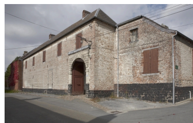
Vue générale depuis la rue Neuve.