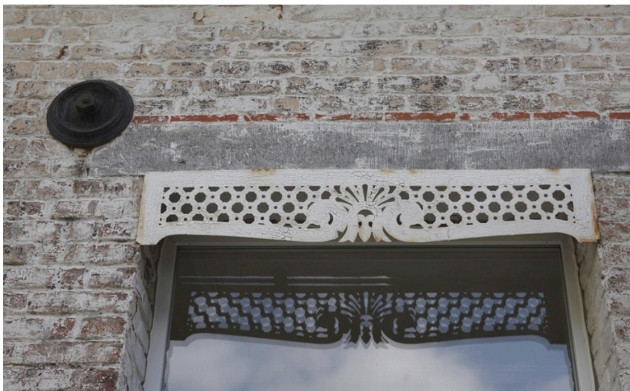
Détail du lambrequin de store d'une fenêtre.