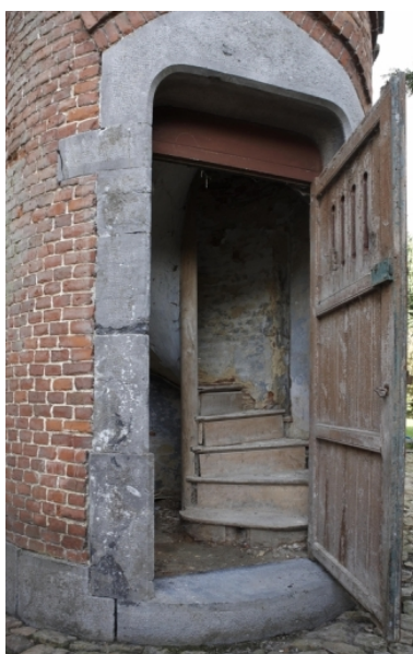
Détail de la porte de la tourelle et du départ de l'escalier.