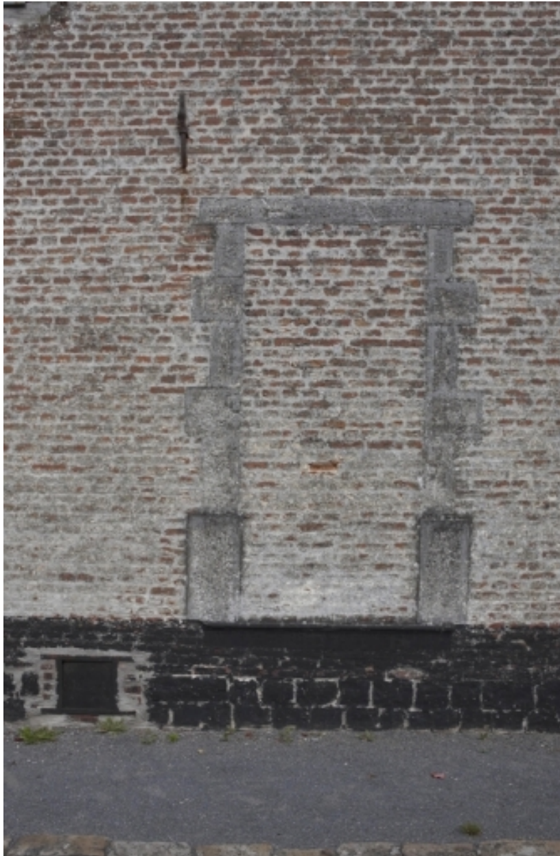
Détail d'une ouverture obstruée (élévation sur rue du logis).