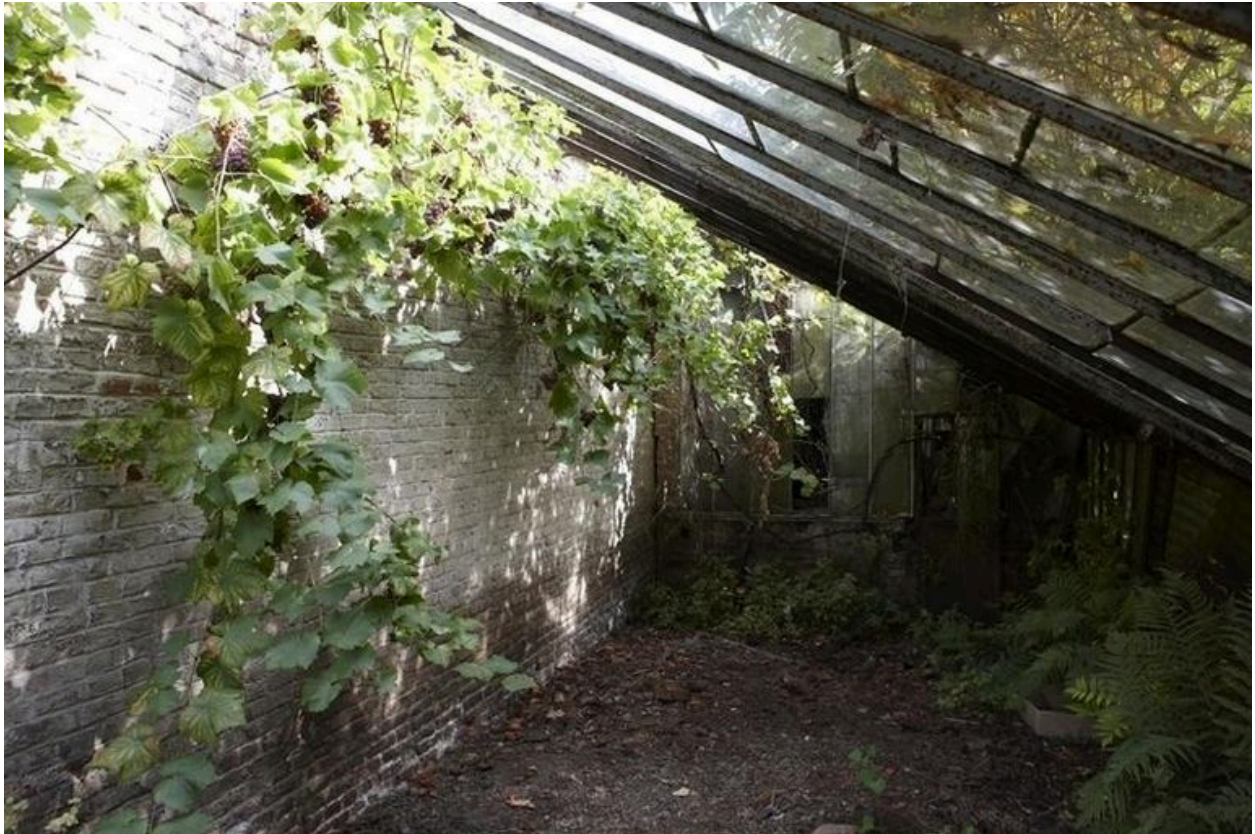
Vue de la serre.