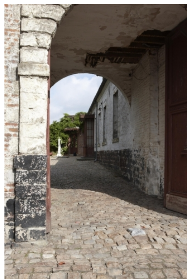
Détail du porche d'entrée.