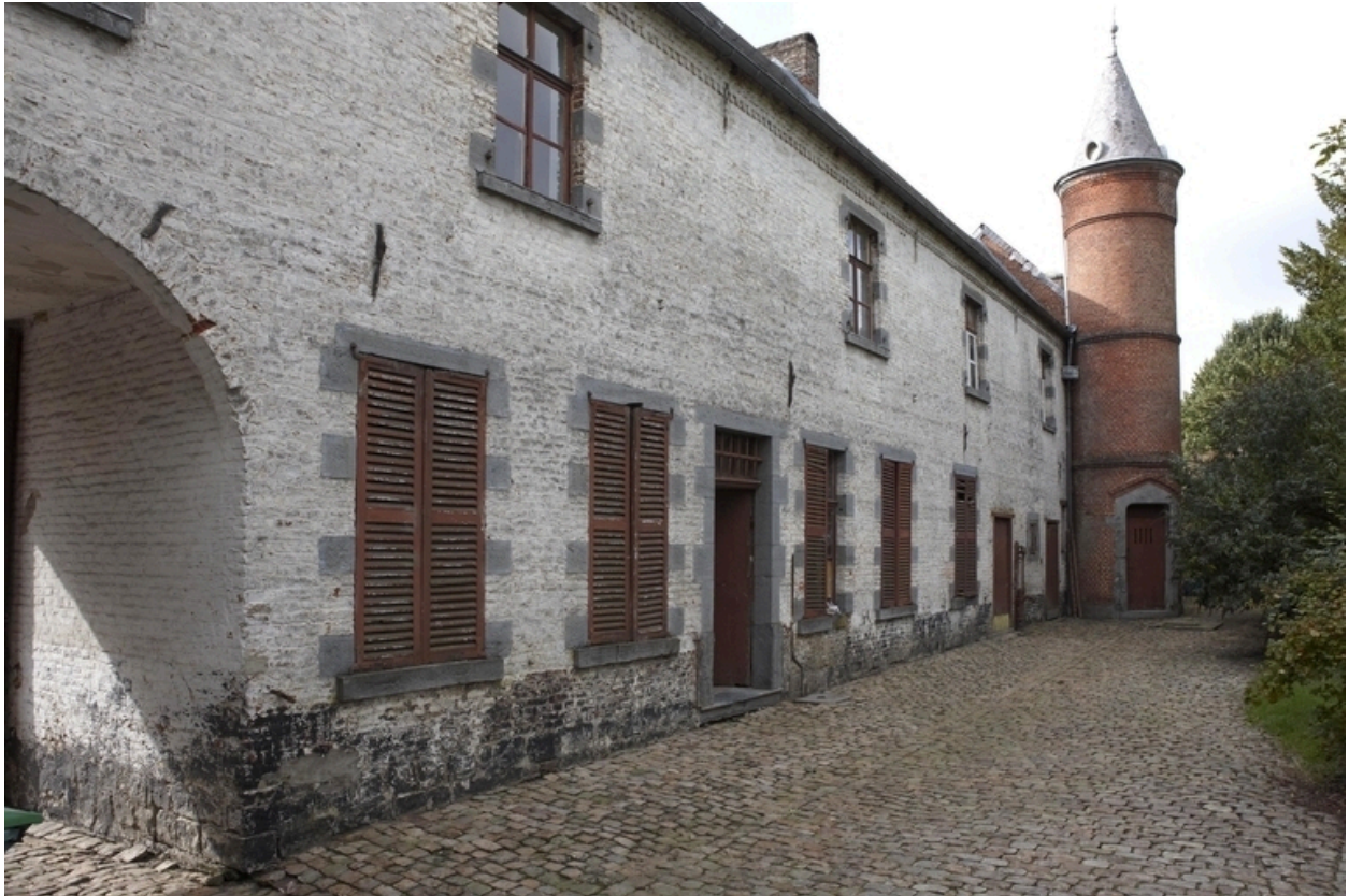
Vue de l'élévation sur cour du logis.