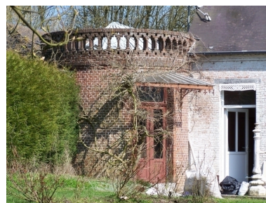
Vue de la rotonde. IVR31_20095901383NUCA