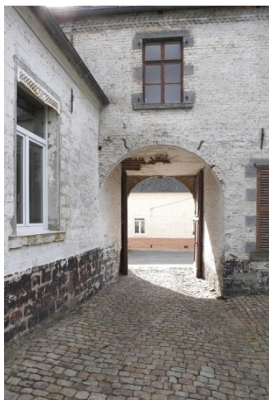
Vue du porche depuis la cour et de la liaison entre le logis et le bâtiment abritant les pièces de réception.