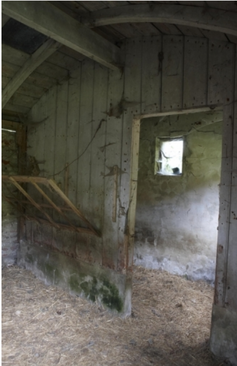
Vue intérieure des écuries.