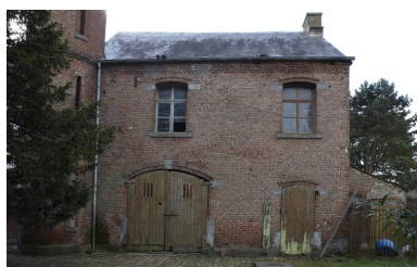
Vue de la façade sur cour des écuries.