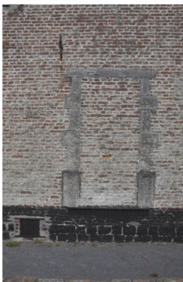
Détail d'une ouverture obstruée (élévation sur rue du logis).