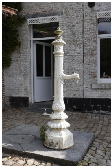
Vue de la pompe à eau située dans la cour.