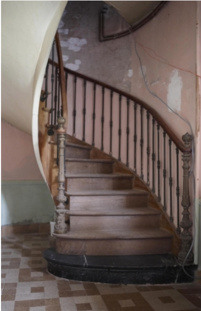
Vue de l'escalier situé dans le bâtiment abritant les pièces de réception.