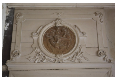
Détail des dessus-de-porte du salon d'honneur : l'Air.