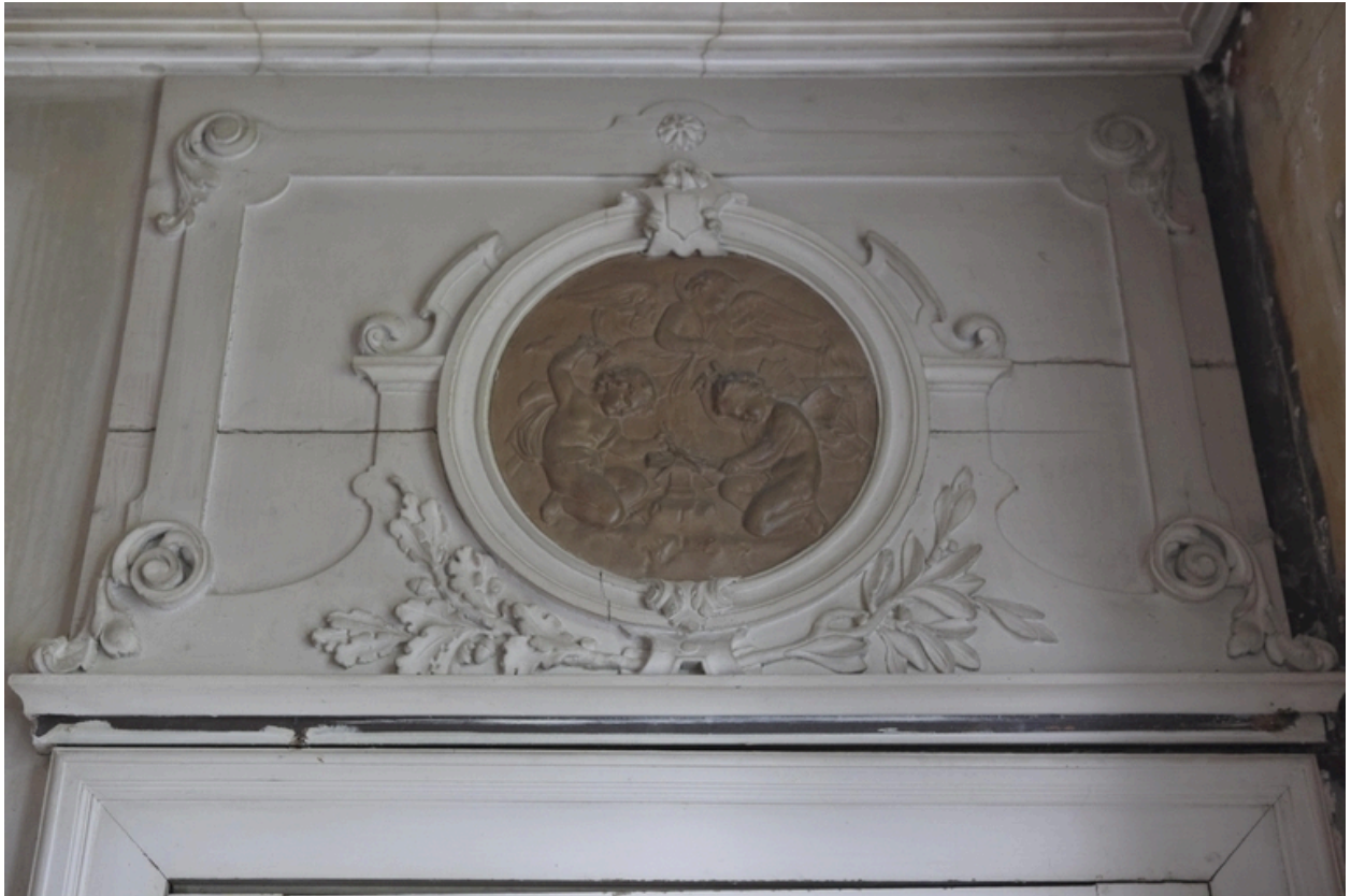
Détail des dessus-de-porte du salon d'honneur : le Feu.