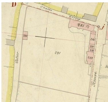
Extrait de la feuille cadastrale B2. Plan de situation en 1897. IVR31_20095902603NUCA