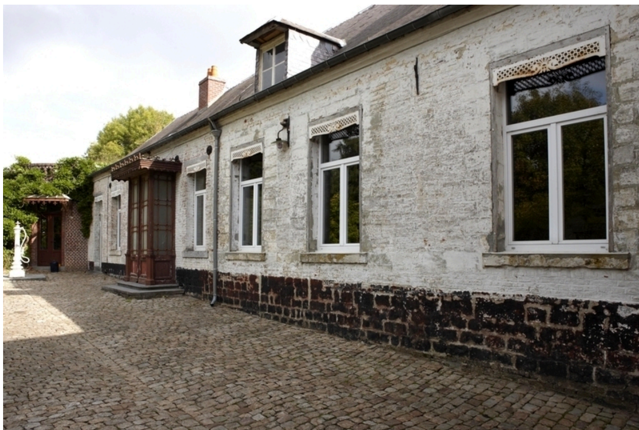
Vue de l'élévation sur cour du bâtiment abritant les pièces de réception.