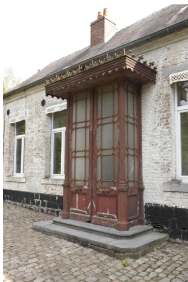
Détail du porche vitré hors-oeuvre en menuiserie. IVR31_20095903329NUCA