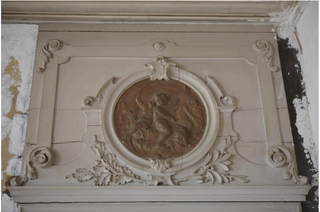
Détail des dessus-de-porte du salon d'honneur : l'Eau.