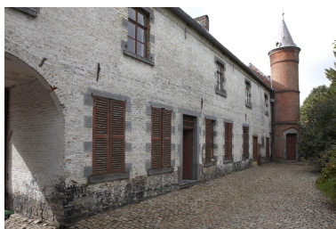
Vue de l'élévation sur cour du logis.