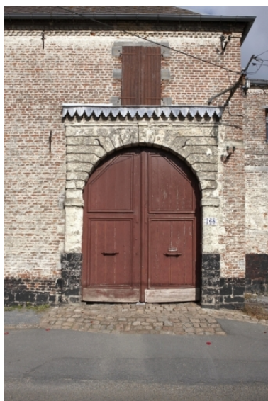
Détail du porche à bossage.