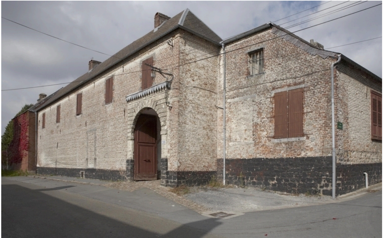
Vue générale depuis la rue Neuve.