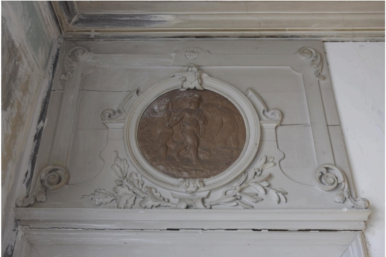
Détail des dessus-de-porte du salon d'honneur : la Terre.