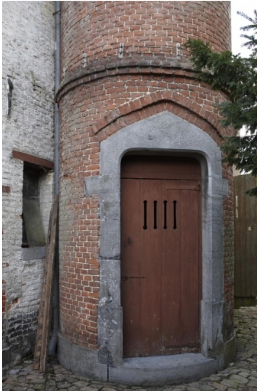
Détail de la porte de la tourelle d'escalier.