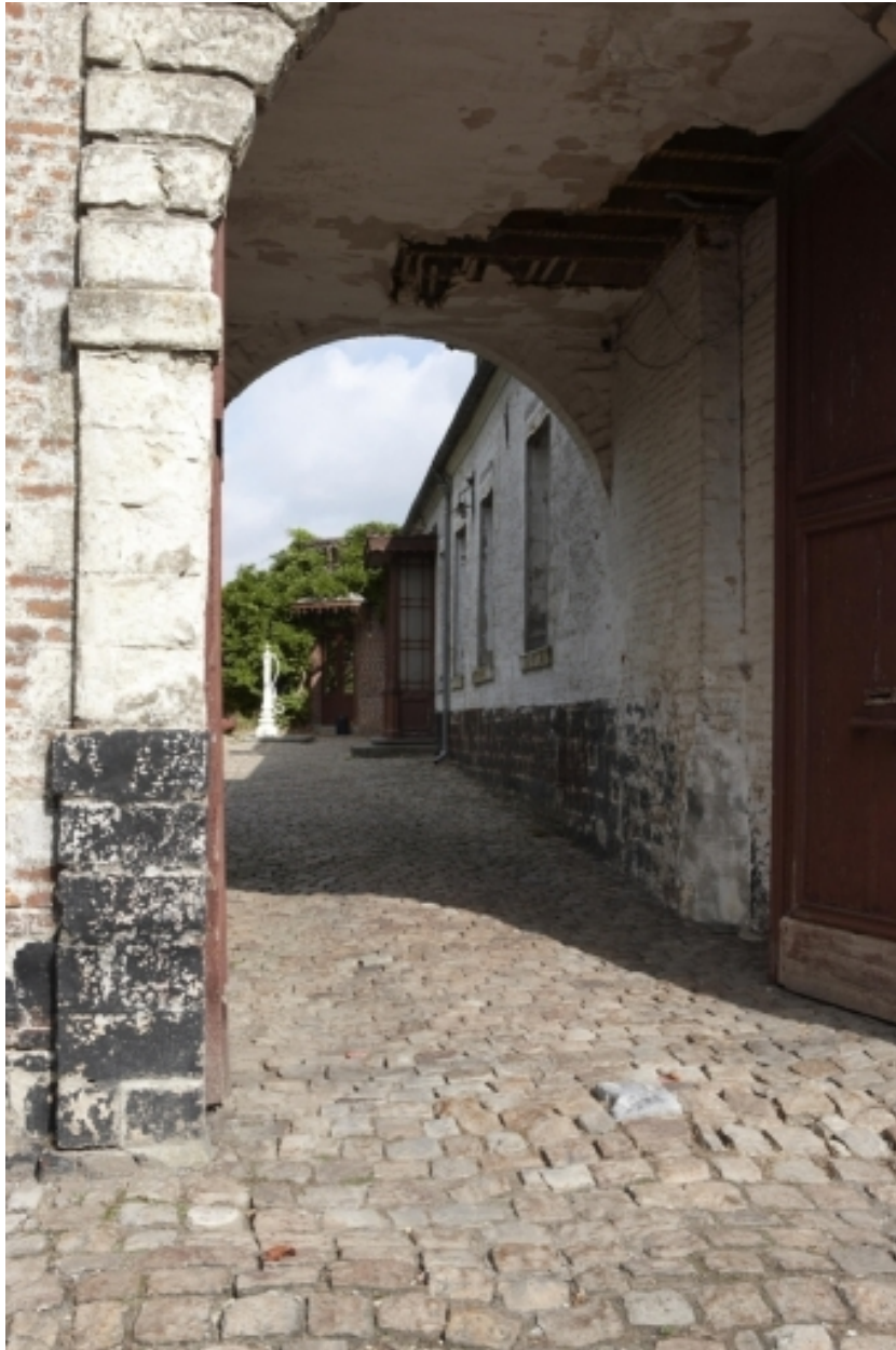
Détail du porche d'entrée.