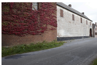
Vue de l'élévation sur rue du logis.