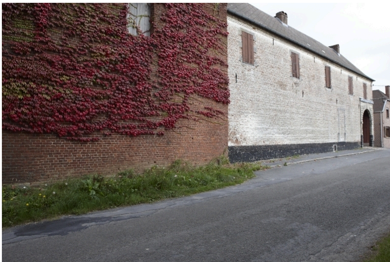
Vue de l'élévation sur rue du logis.