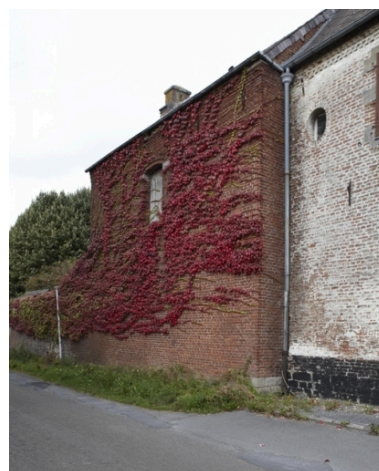
Vue de l'élévation sur rue des écuries. IVR31_20095903167NUCA