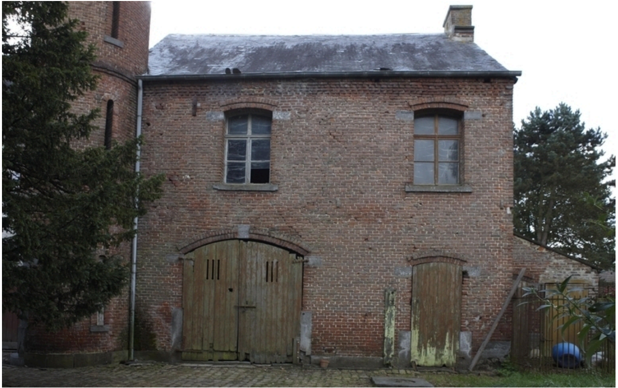
Vue de la façade sur cour des écuries.