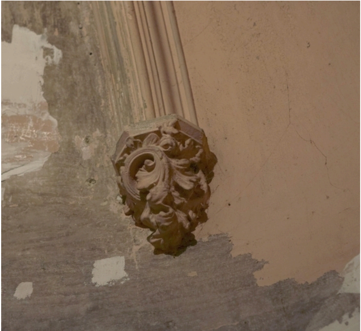
Détail du décor de l'escalier.