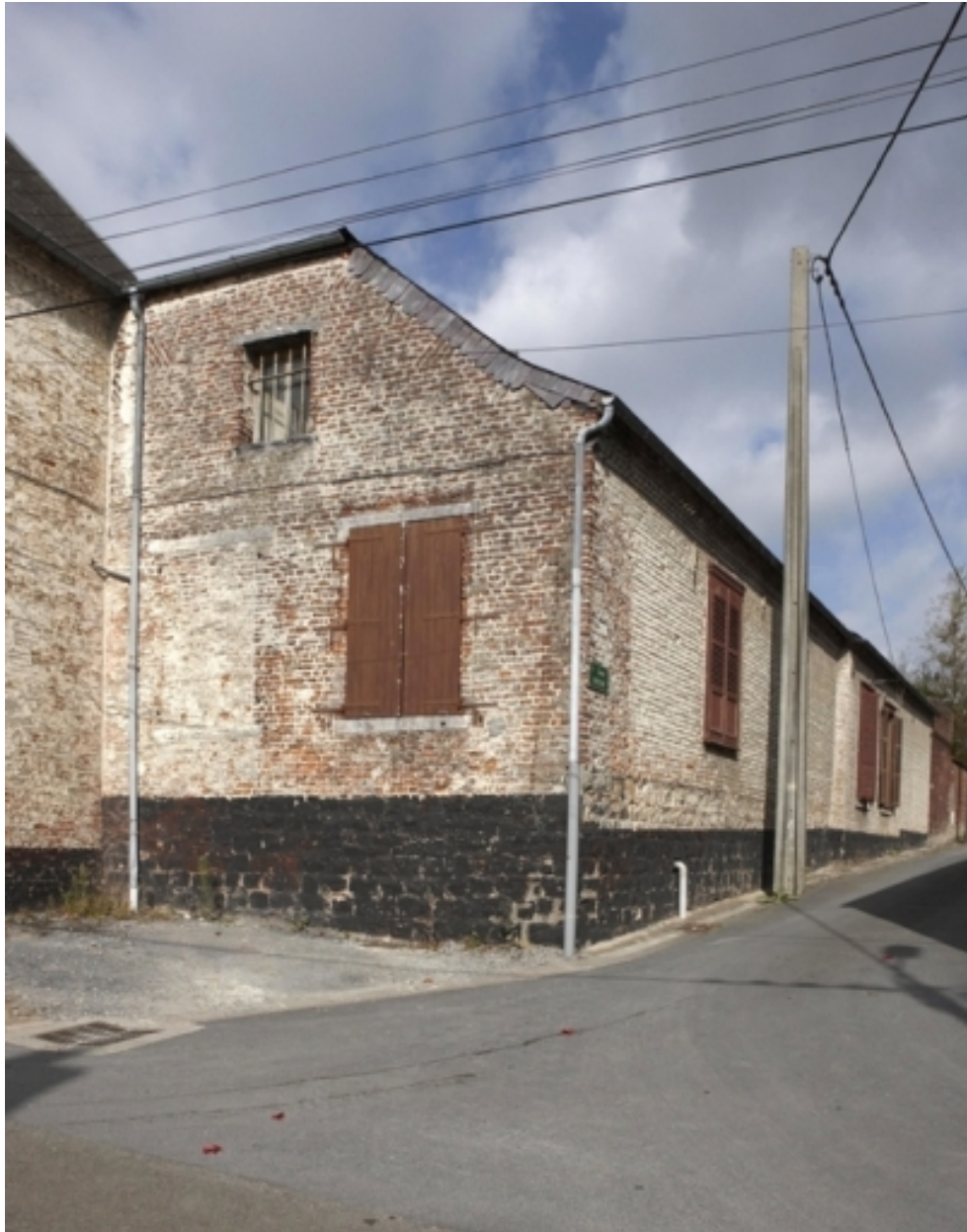
Vue de l'élévation sur rue du bâtiment abritant les pièces de réception.