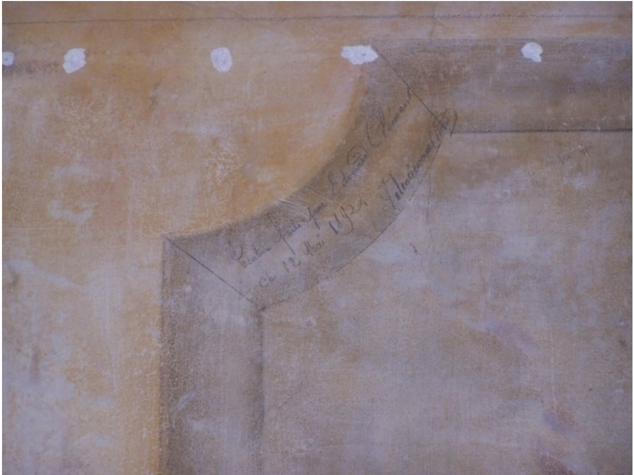
Vue de la signature des faux marbres du salon d'honneur exécutés en 1897 par Edouard Clément de Valenciennes.