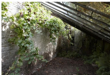
Vue de la serre.