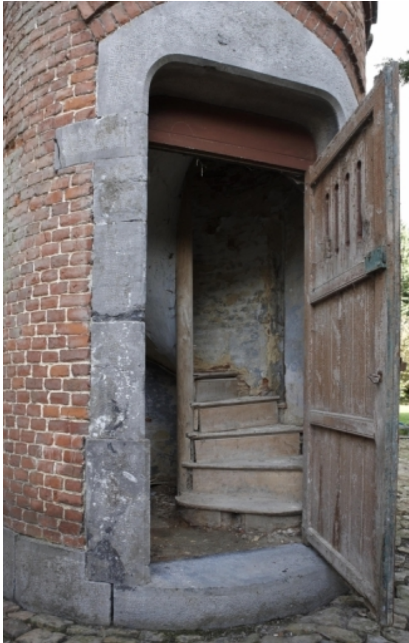
Détail de la porte de la tourelle et du départ de l'escalier.