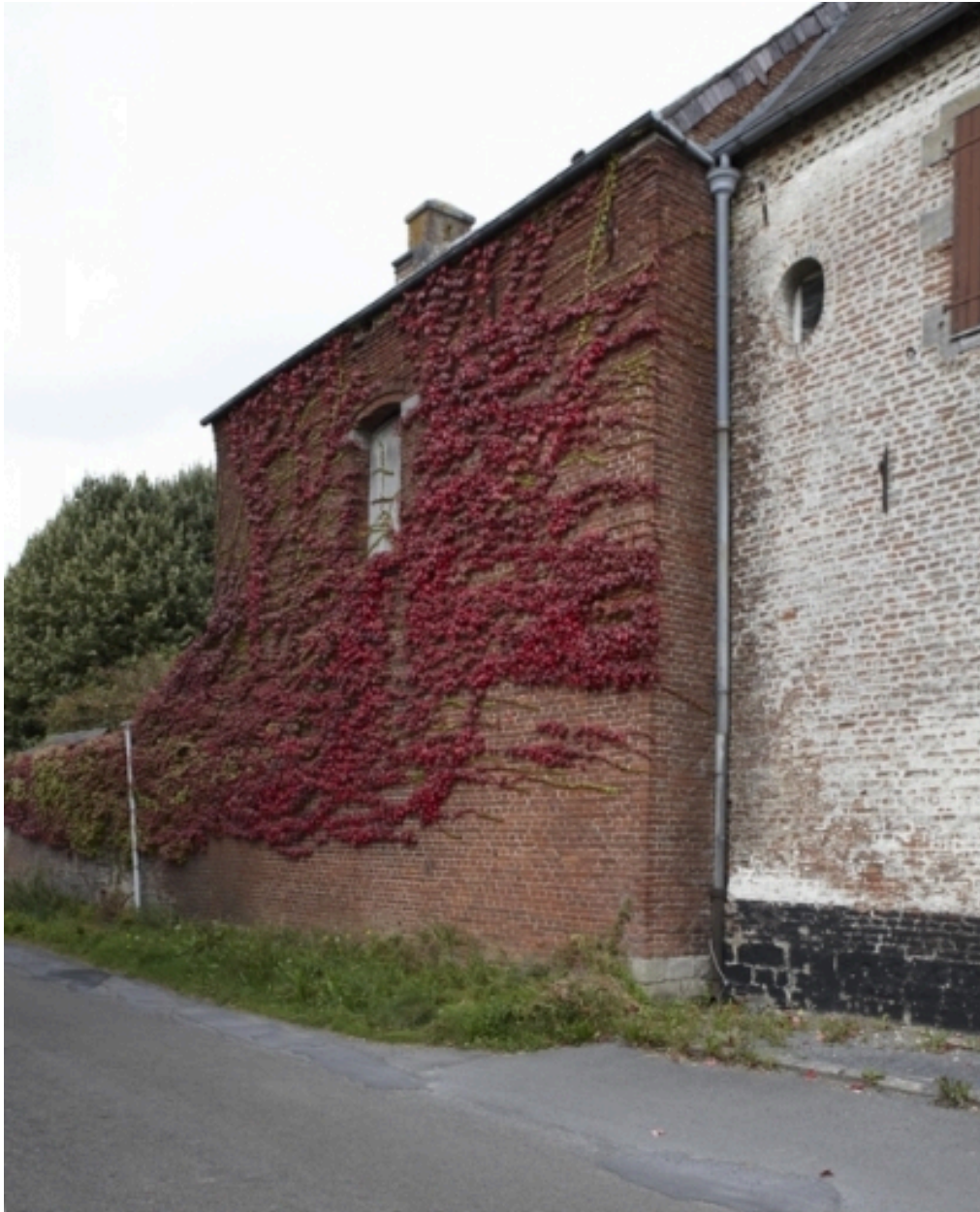
Vue de l'élévation sur rue des écuries.