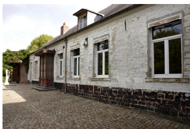
Vue de l'élévation sur cour du bâtiment abritant les pièces de réception. IVR31_20095903326NUCA