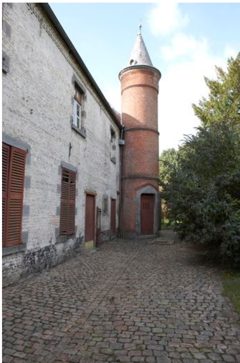
Détail de la partie abritant une étable et une laiterie et de la tourelle d'escalier permettant d'accéder au niveau supérieur des écuries.