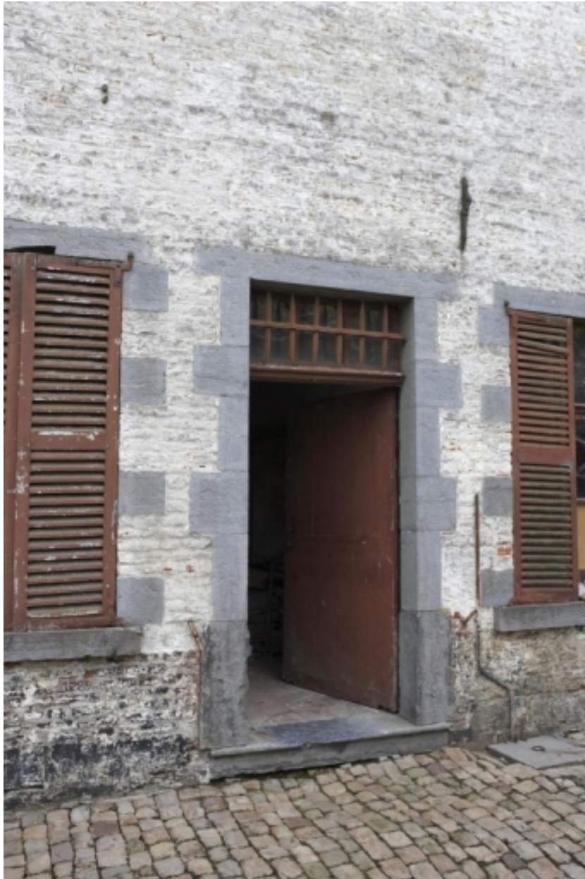
Détail de la porte d'entrée du logis.