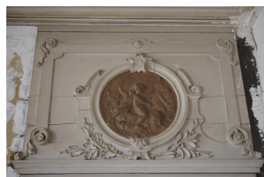
Détail des dessus-de-porte du salon d'honneur : l'Eau.