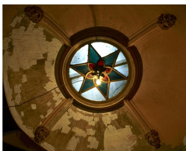
Détail de la verrière surmontant l'escalier situé dans le bâtiment abritant les pièces de réception. IVR31_20095903305NUCA