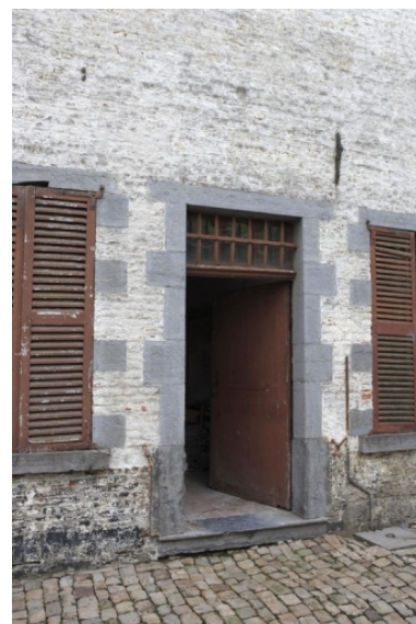
Détail de la porte d'entrée du logis.