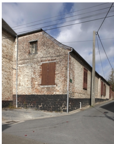
Vue de l'élévation sur rue du bâtiment abritant les pièces de réception.