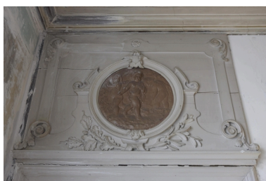
Détail des dessus-de-porte du salon d'honneur : la Terre.