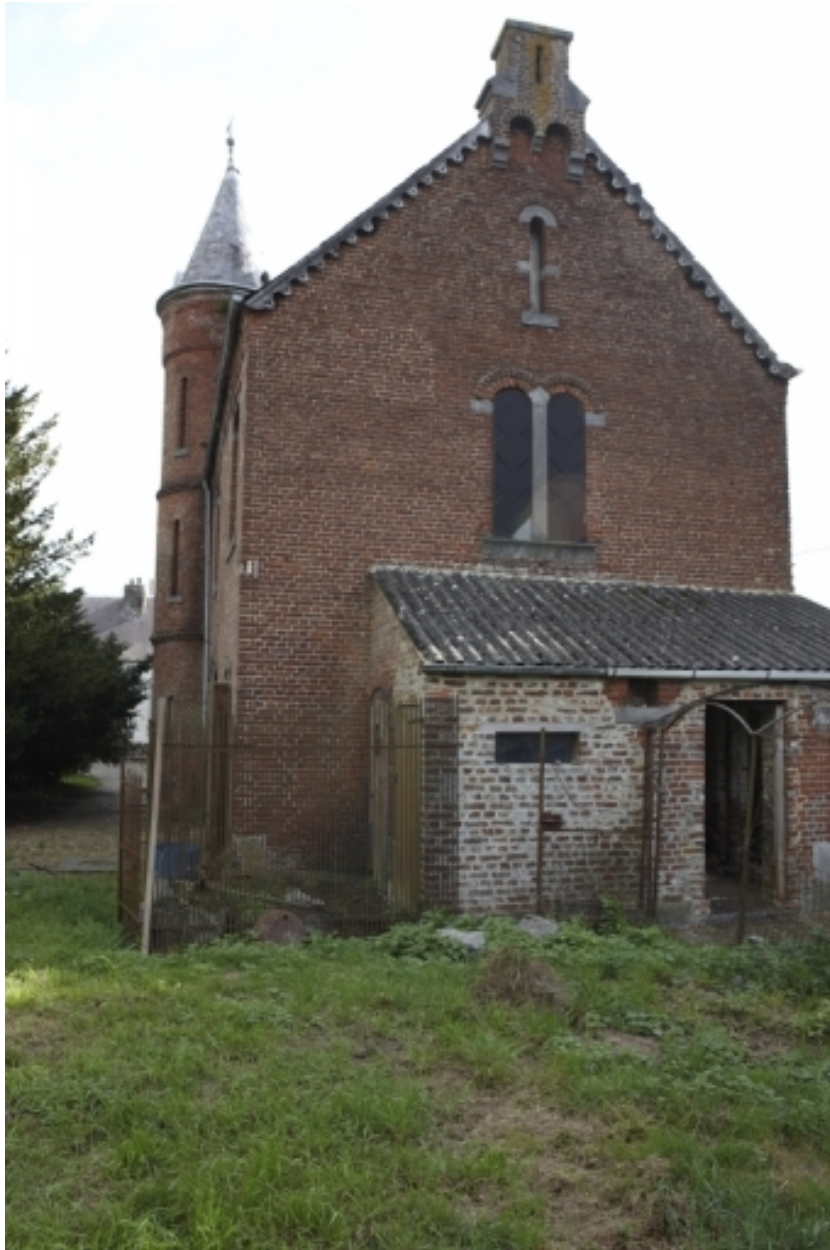
Vue du pignon des écuries.