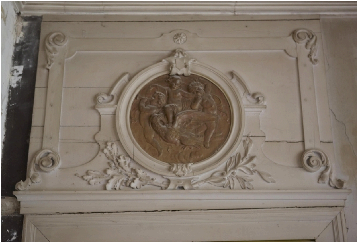
Détail des dessus-de-porte du salon d'honneur : l'Air.