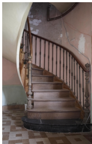
Vue de l'escalier situé dans le bâtiment abritant les pièces de réception.