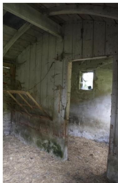
Vue intérieure des écuries. IVR31_20095903318NUCA