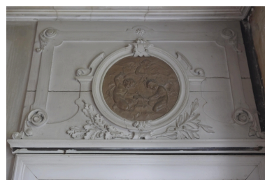
Détail des dessus-de-porte du salon d'honneur : le Feu. IVR31_20095903299NUCA