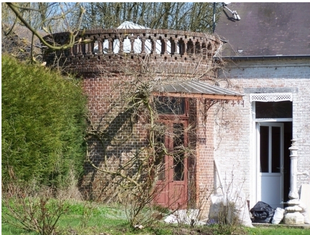
Vue de la rotonde.