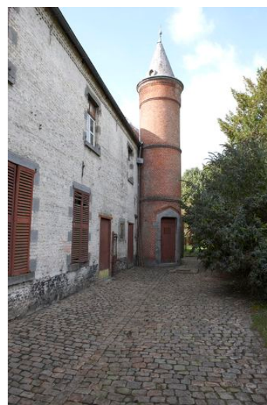
Détail de la partie abritant une étable et une laiterie et de la tourelle d'escalier permettant d'accéder au niveau supérieur des écuries.