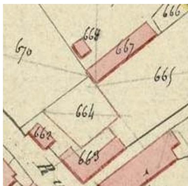
Extrait de la feuille cadastrale B1. Plan de situation en 1826. IVR31_20095902602NUCA