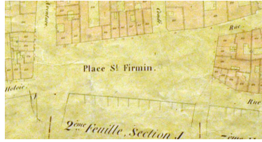
Extrait du cadastre de 1852 (DGI). IVR22_20038011032NUCA