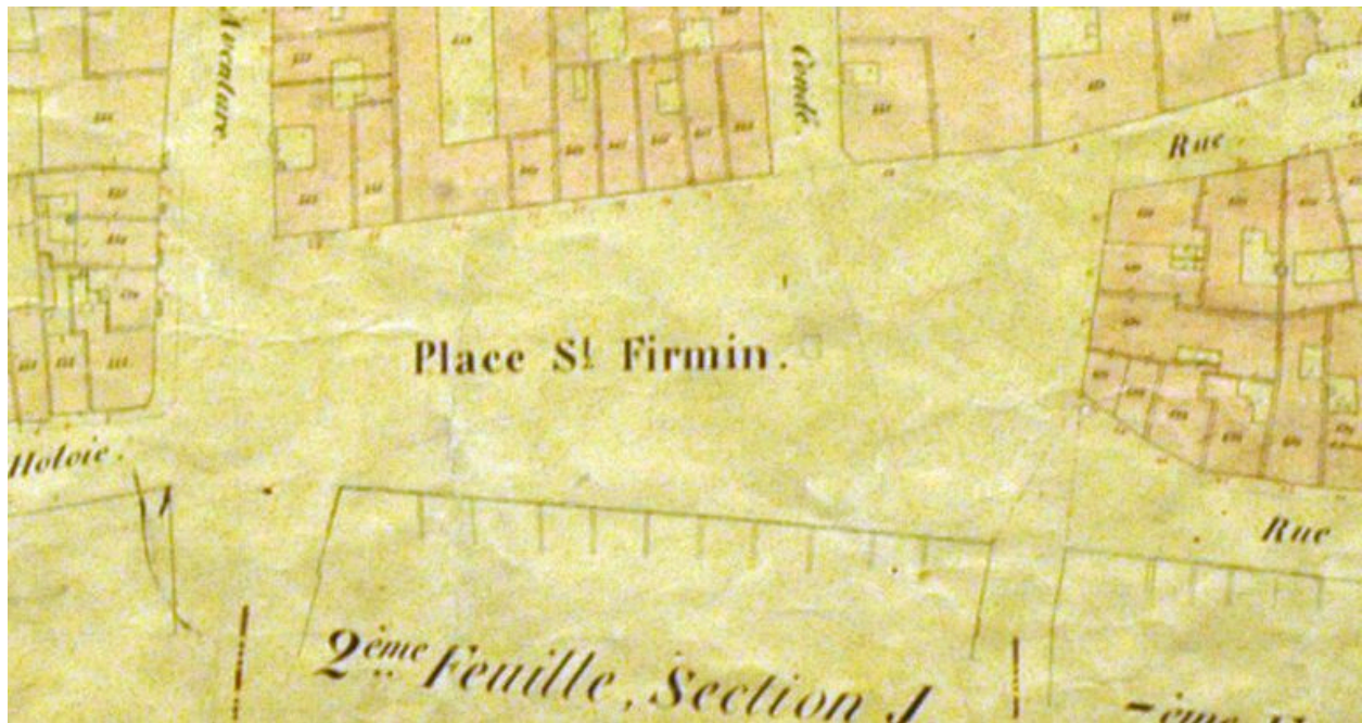
Extrait du cadastre de 1852 (DGI).