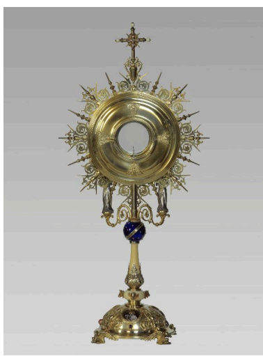
Vue du revers de l'ostensoir. IVR22_20130200033NUC2A