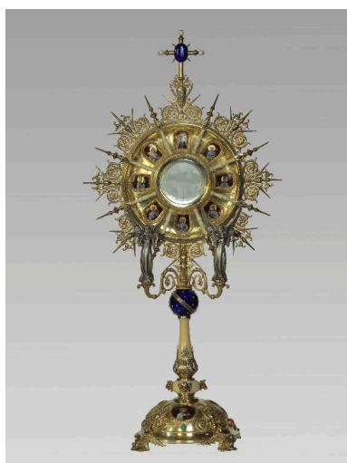
Vue de la face antérieure de l'ostensoir. IVR22_20130200031NUC2A