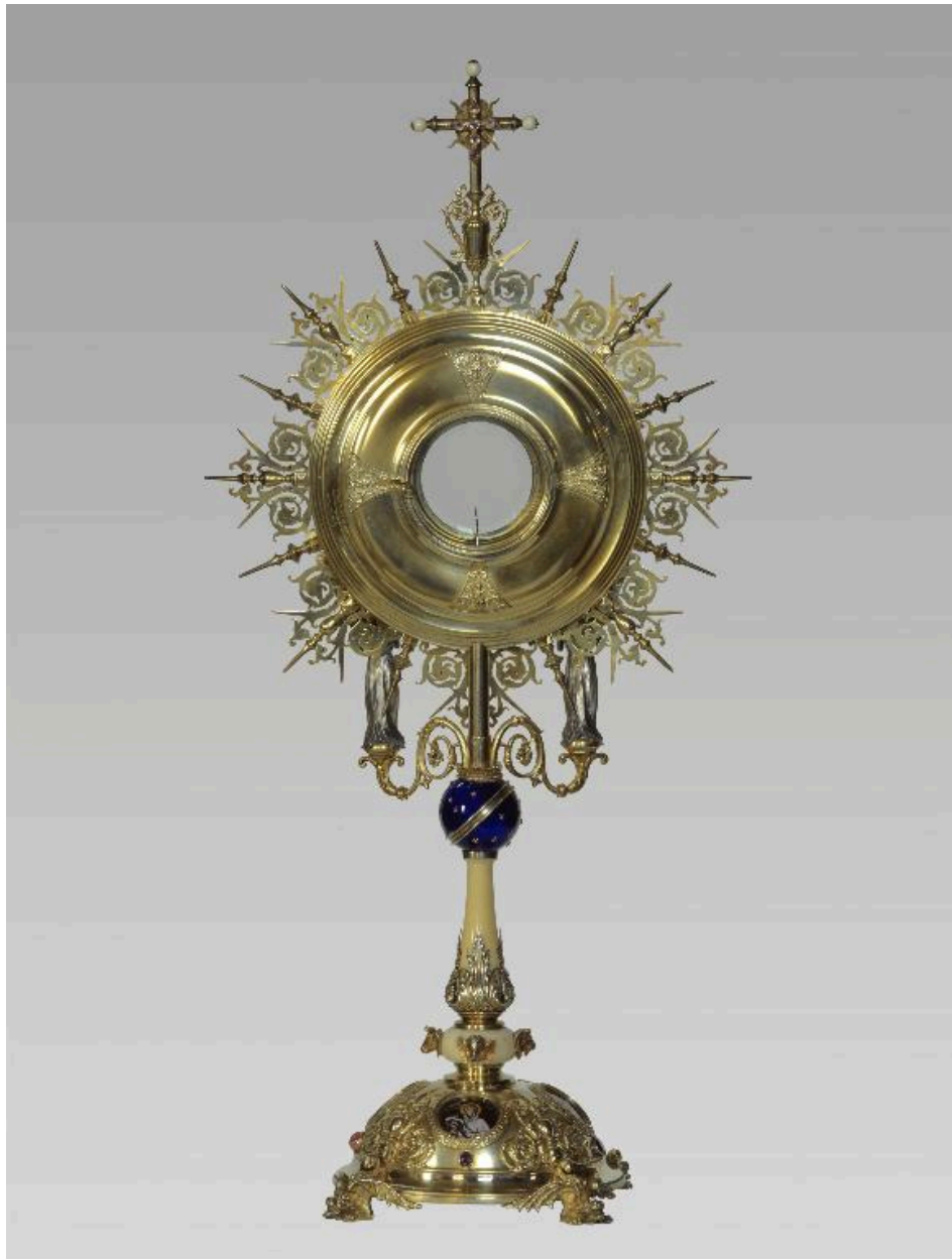
Vue du revers de l'ostensor.