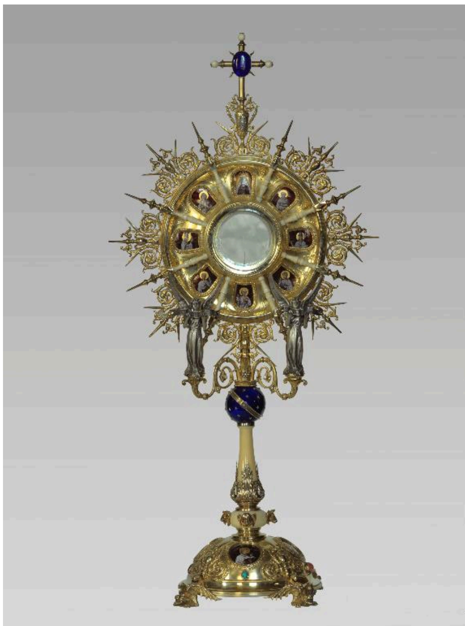
Vue de la face antérieure de l'ostensorio.