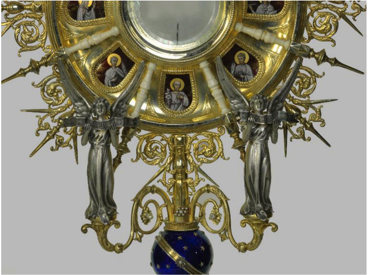
Détail de la face antérieure : les deux anges.