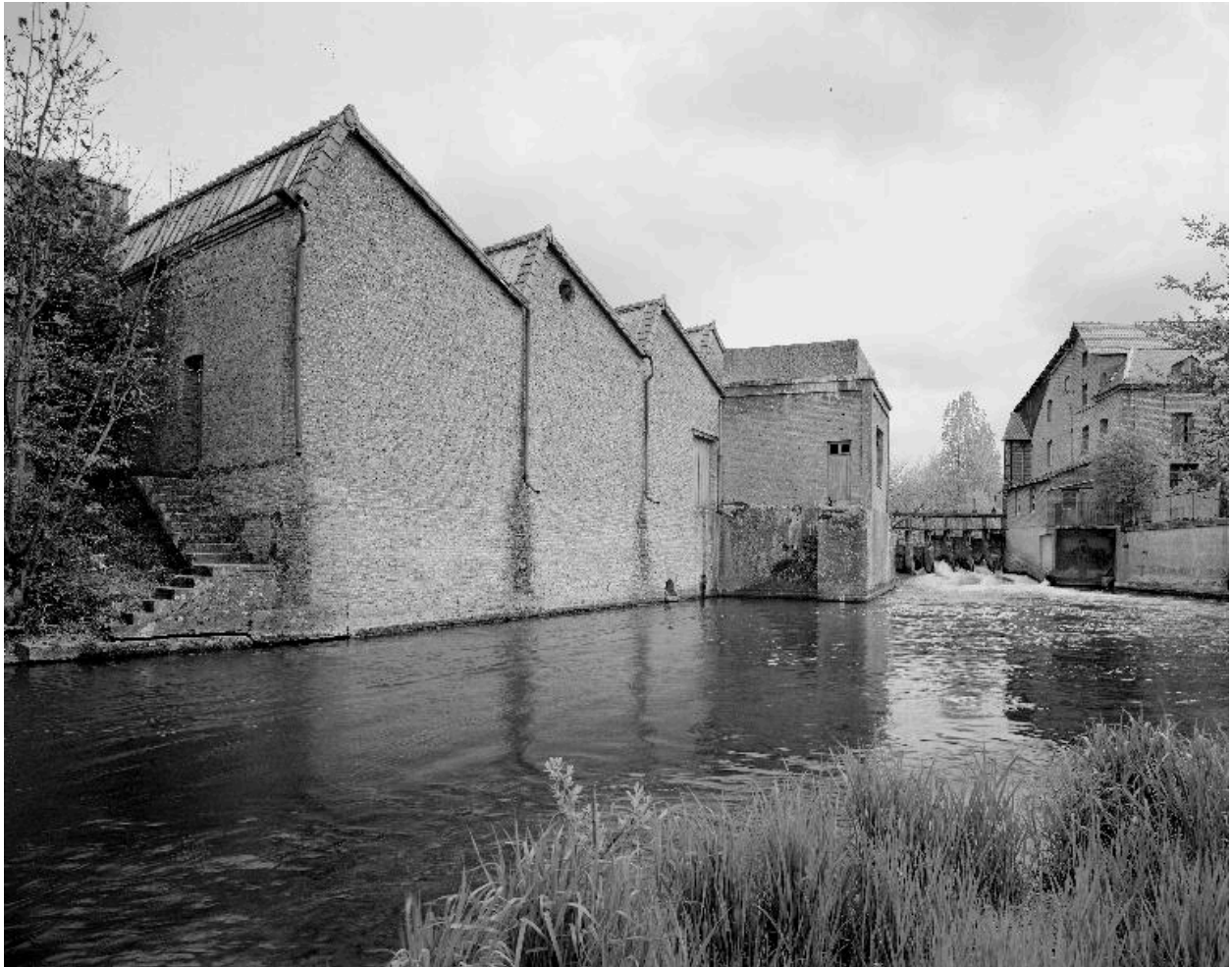
Atelier de fabrication, flanc ouest.