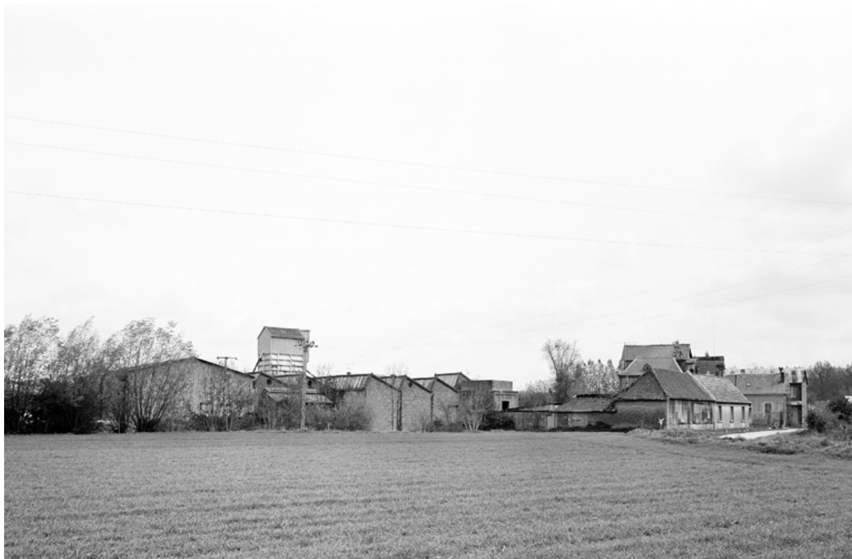
Vue partielle, flanc sud.