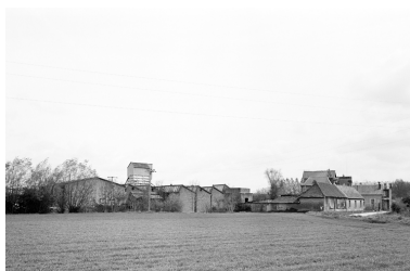
Vue partielle, flanc sud.