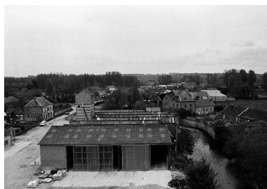
Vue générale, flanc nord. IVR22_19918000147X