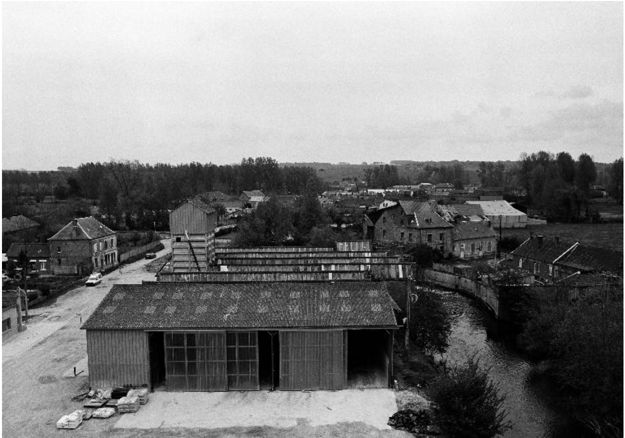
Vue générale, flanc nord.