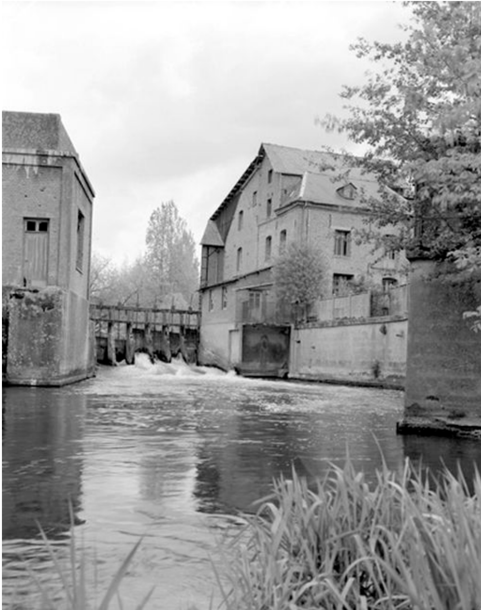
Bâtiment d'eau, vannages et moulin à farine, vue partielle.