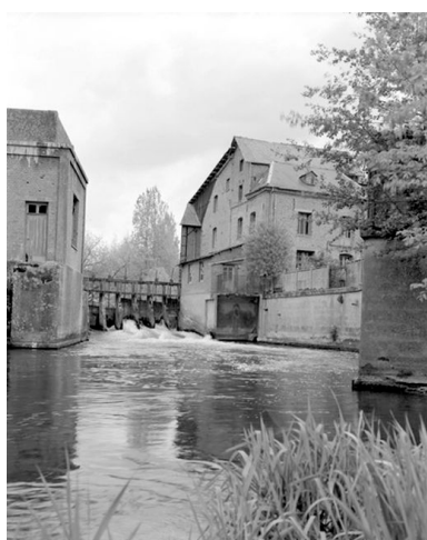
Bâtiment d'eau, vannages et moulin à farine, vue partielle. IVR22_19918000155V