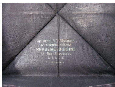
Marque de fabricant (barrette). IVR31_20106204503NUCA