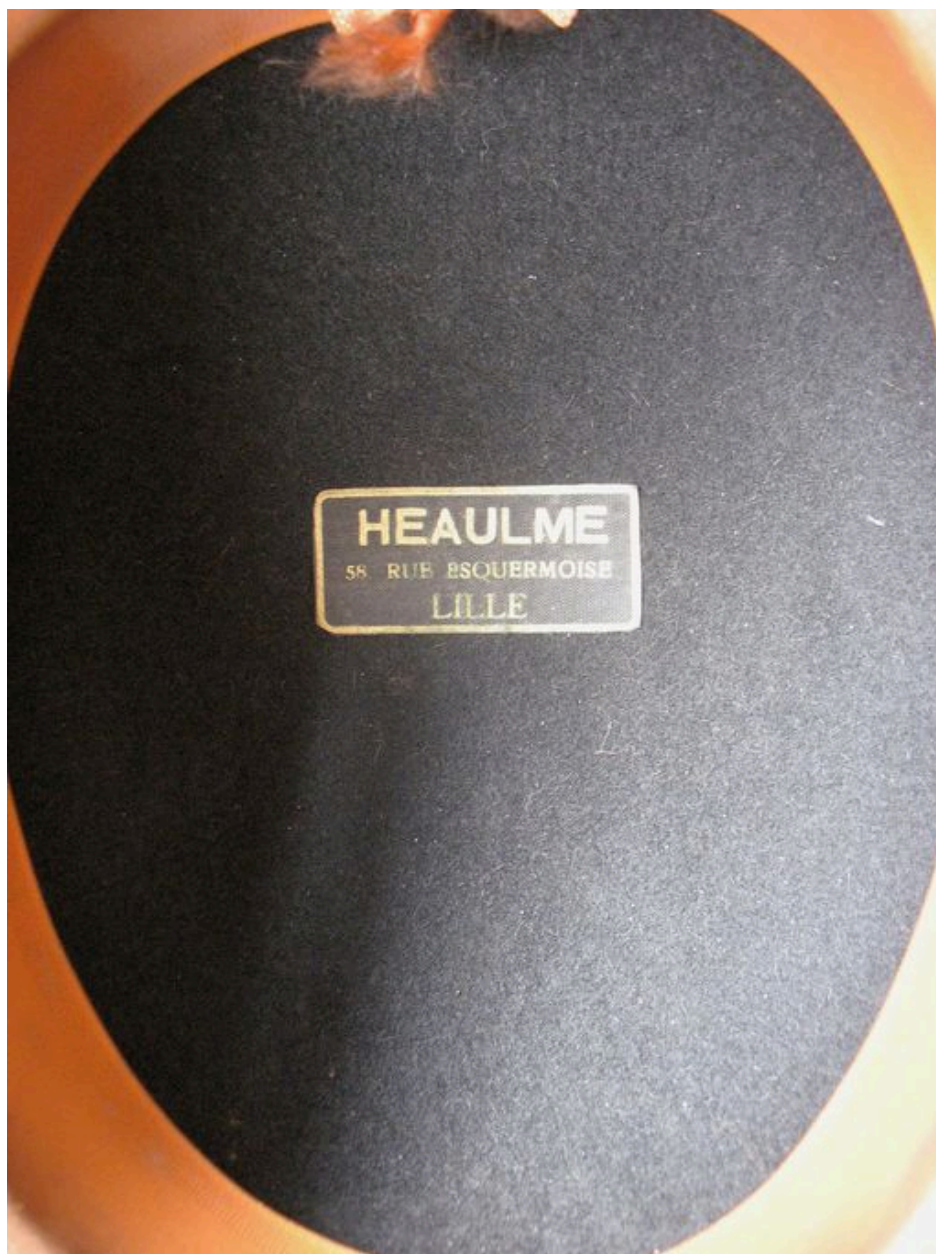
Marque de fabricant (chapeau de clerc 1).