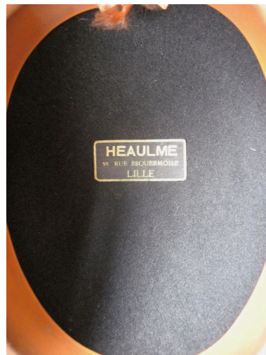
Marque de fabricant (chapeau de clerc 1).