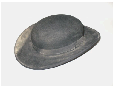
Chapeau de clerc. IVR31_20106204501NUCA