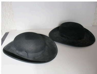
Ensemble de deux chapeaux de clerc. IVR31_20106204498NUCA