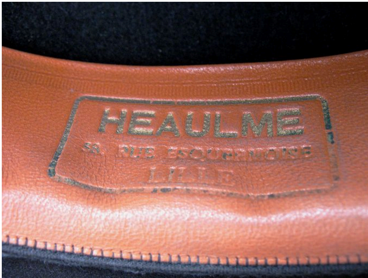
Marque de fabricant (chapeau de clerc).