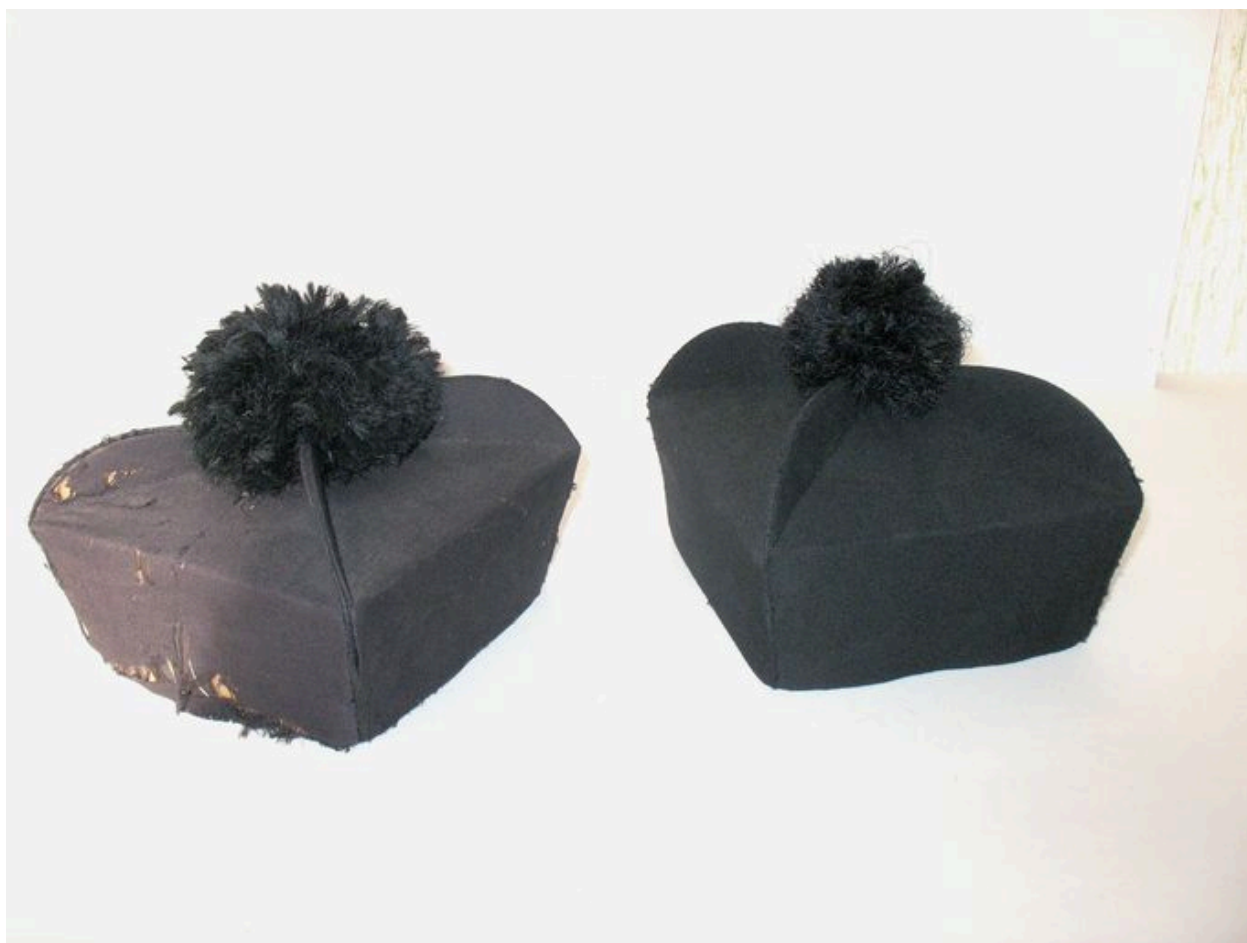
Ensemble de deux barrettes.