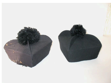
Ensemble de deux barrettes. IVR31_20106204499NUCA