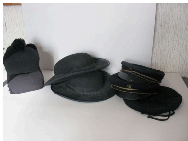
Vue générale. IVR31_20106204497NUCA