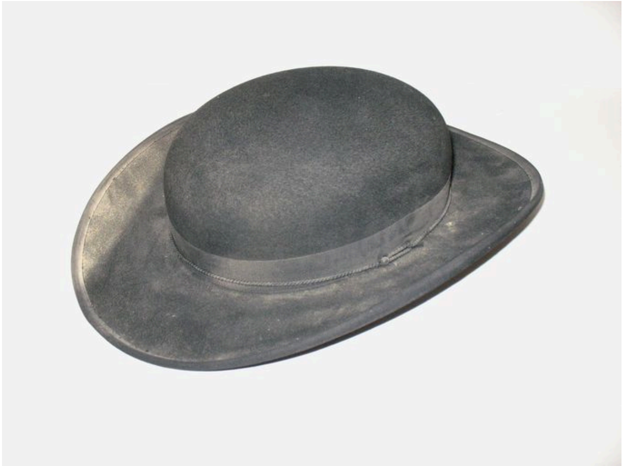
Chapeau de clerc.