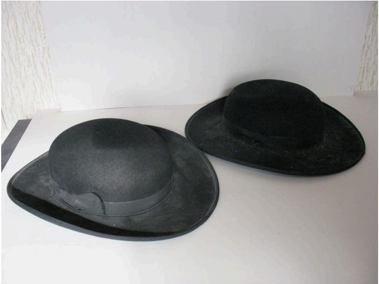
Ensemble de deux chapeaux de clerc.