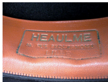
Marque de fabricant (chapeau de clerc). IVR31_20106204504NUCA