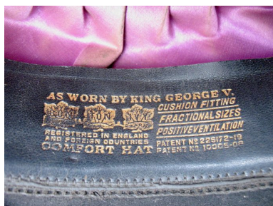
Marque de fabricant (chapeau de clerc 2). IVR31_20106204506NUCA