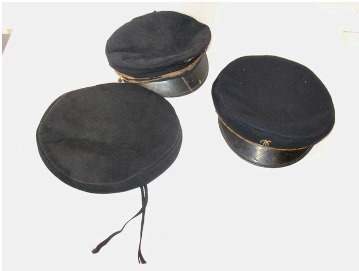
Ensemble de deux casquettes d'élève et béret.