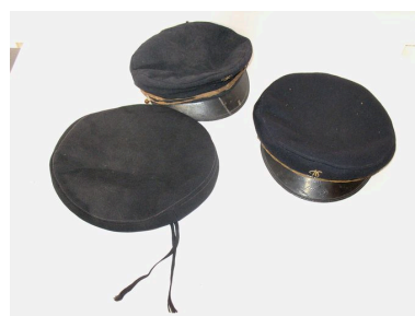
Ensemble de deux casquettes d'élève et bérêt.