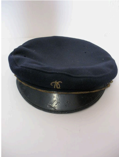
Casquette d'élève. IVR31_20106204502NUCA