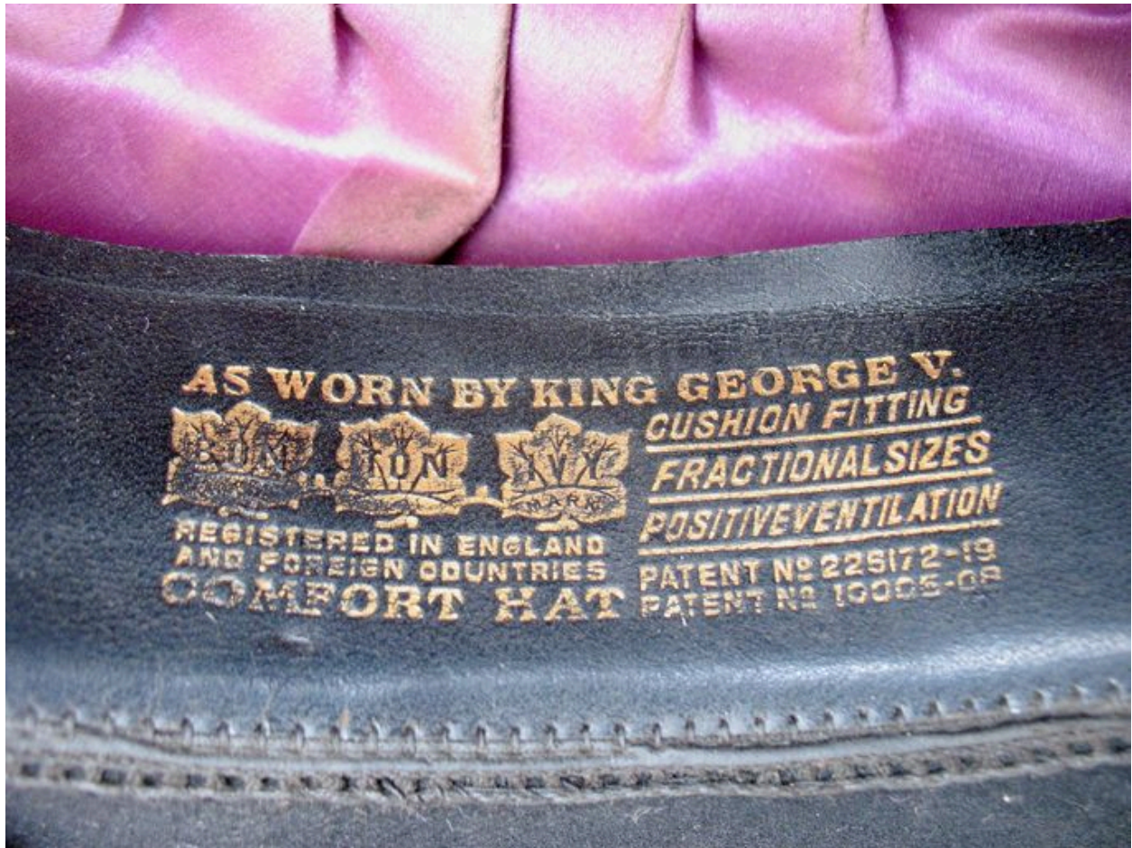
Marque de fabricant (chapeau de clerc 2).