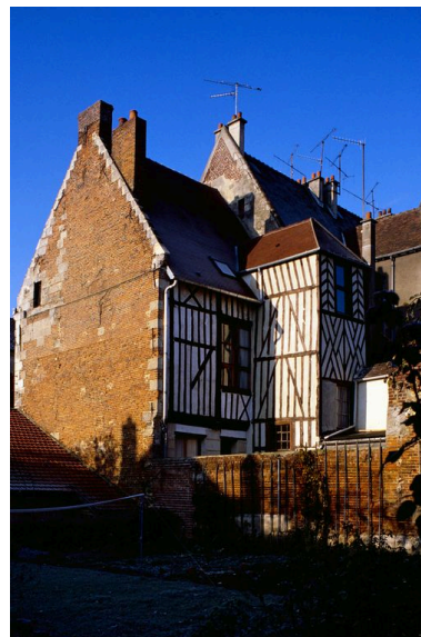
Élévation postérieure. IVR22_19906000029ZA