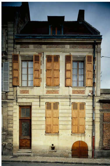
Élévation antérieure.