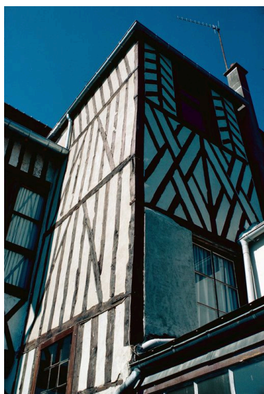
Élévation postérieure : détail de l'escalier hors-oeuvre. IVR22_19856001336ZA