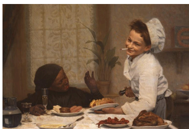
Détail des figures du petit pâtissier ou marmiton, et du petit ramoneur, ainsi que de la table garnie de mets. IVR22_19990204107XA