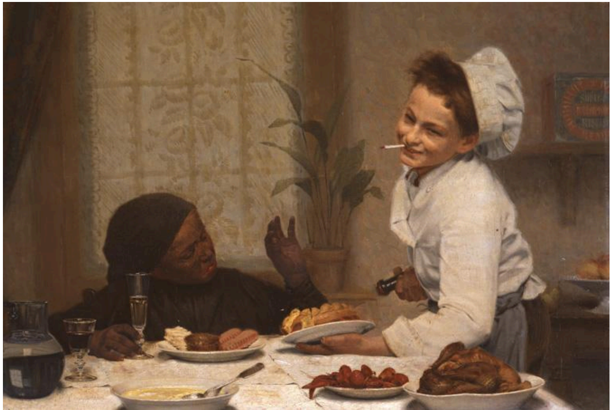
Détail des figures du petit pâtissier ou marmiton, et du petit ramoneur, ainsi que de la table garnie de mets.