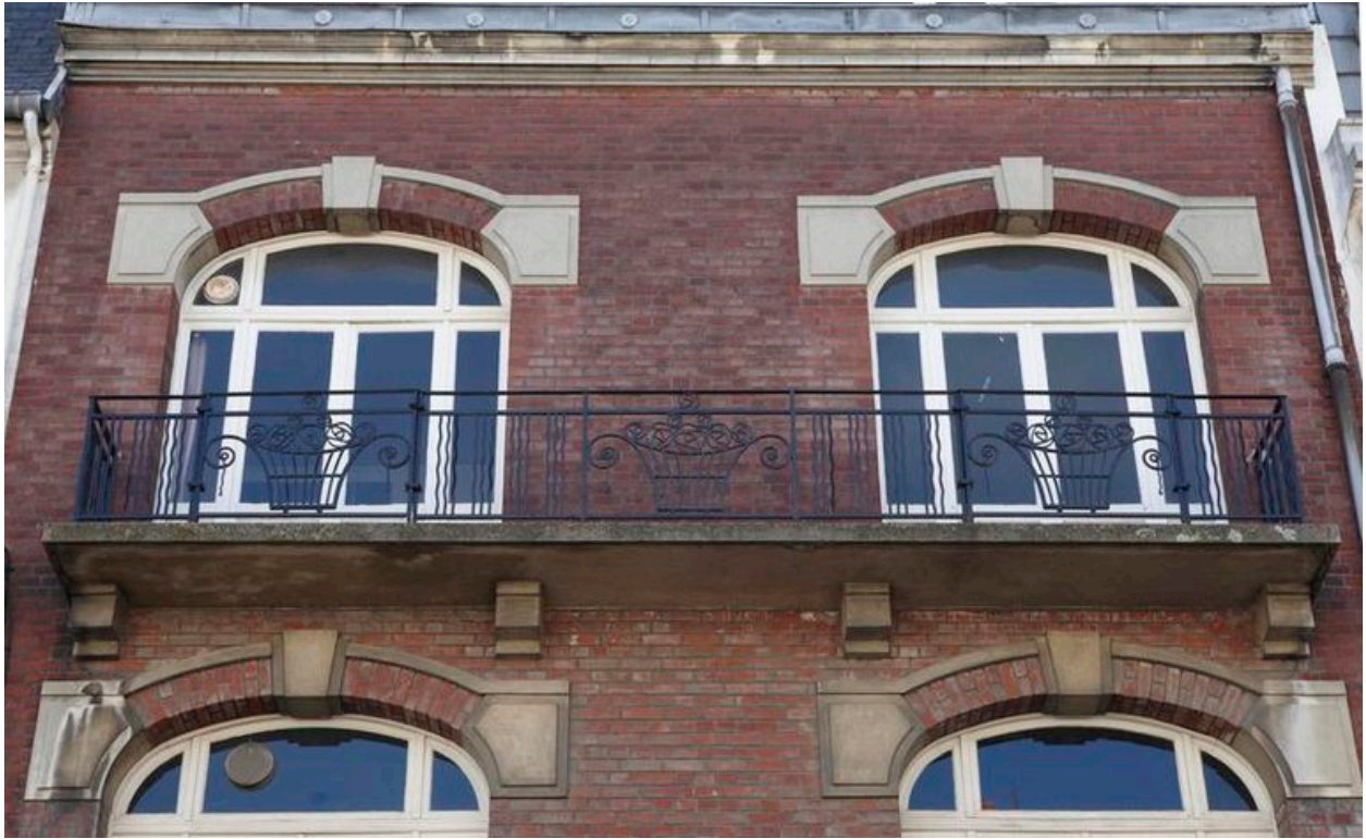
Vue sur le balcon en fer forgé du second étage, constitué de paniers à spirales et de vagues.