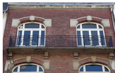
Vue sur le balcon en fer forgé du second étage, constitué de paniers à spirales et de vagues. IVR31_20096200193NUCA