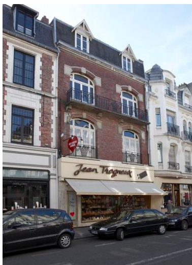
Vue générale. IVR31_20086200317NUCA