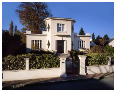
Vue de la façade sur rue. IVR22_19990207191VA