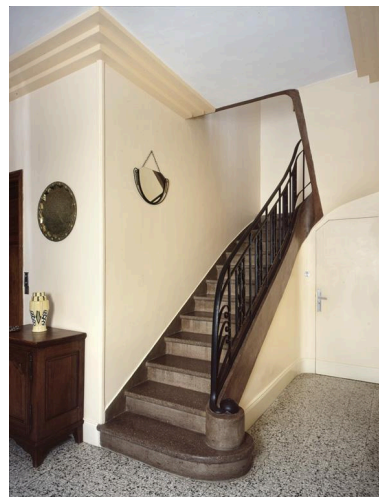
Vue de l'escalier en maçonnerie et fer forgé, réalisé par les ateliers Creusy-Véron de Ribemont.