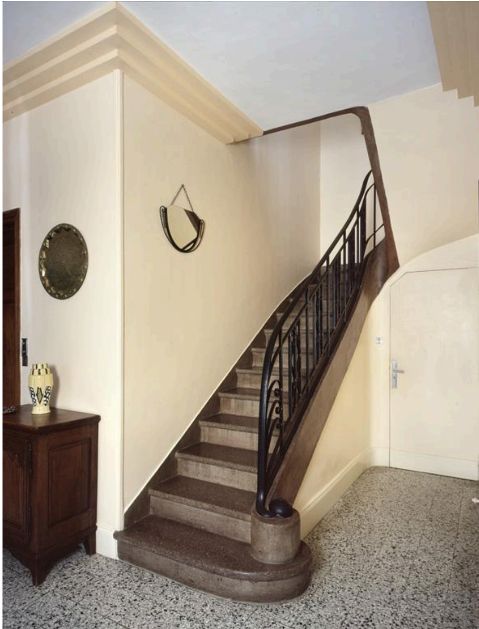
Vue de l'escalier en maçonnerie et fer forgé, réalisé par les ateliers Creusy-Véron de Ribemont.