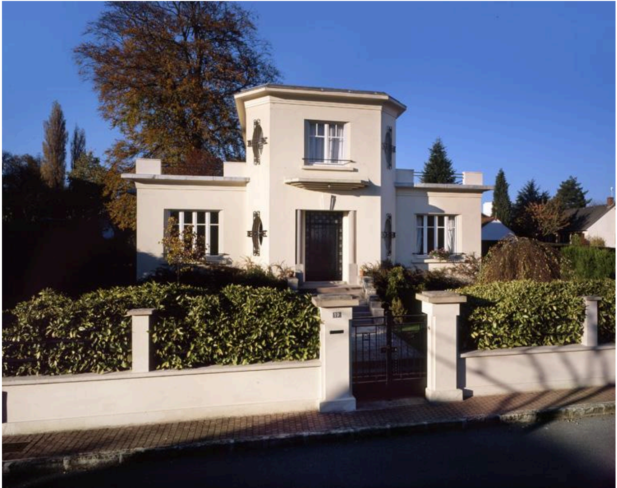
Vue de la façade sur rue.