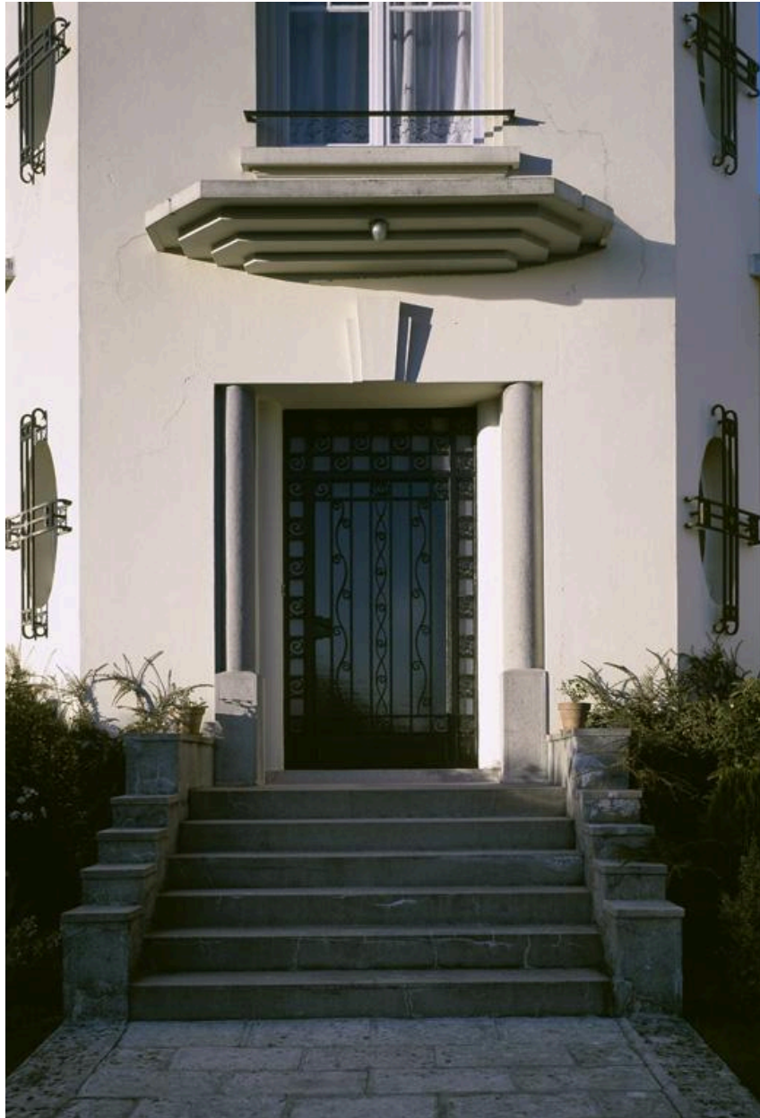
Détail du porche, et de la porte d'entrée en fer forgé.