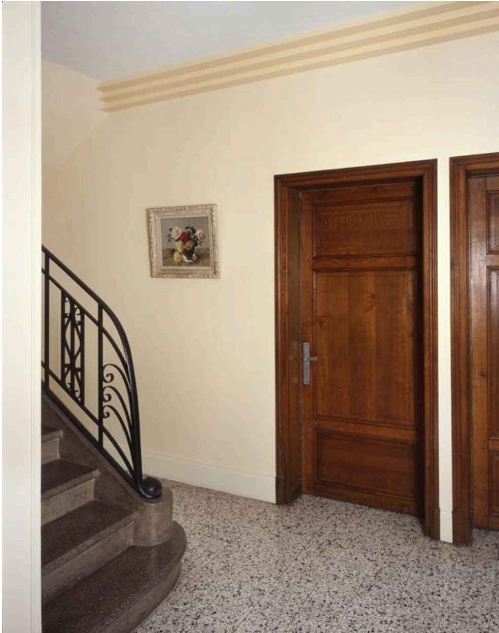
Vue du hall d'entrée.