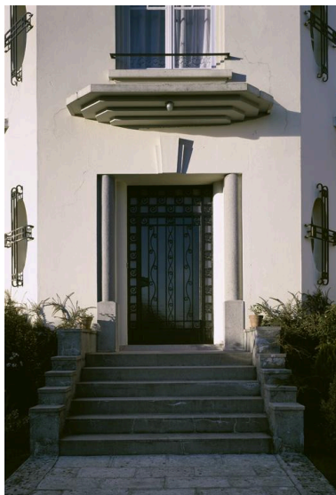
Détail du porche, et de la porte d'entrée en fer forgé.