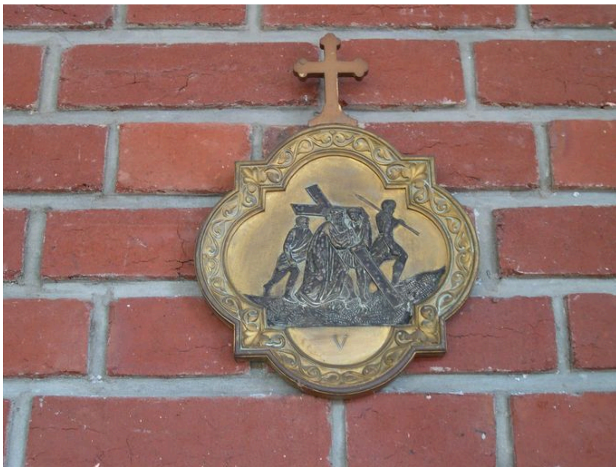
Une des stations du chemin de croix.