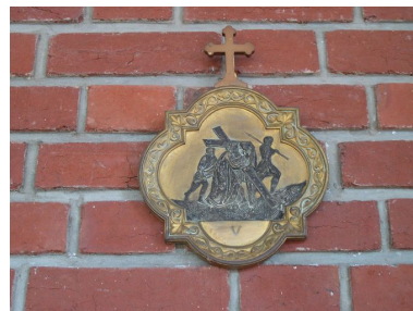
Une des stations du chemin de croix.