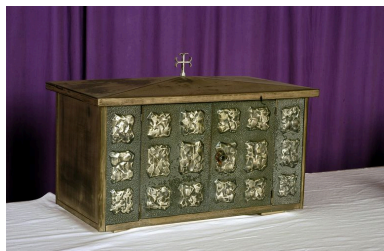
Le tabernacle.