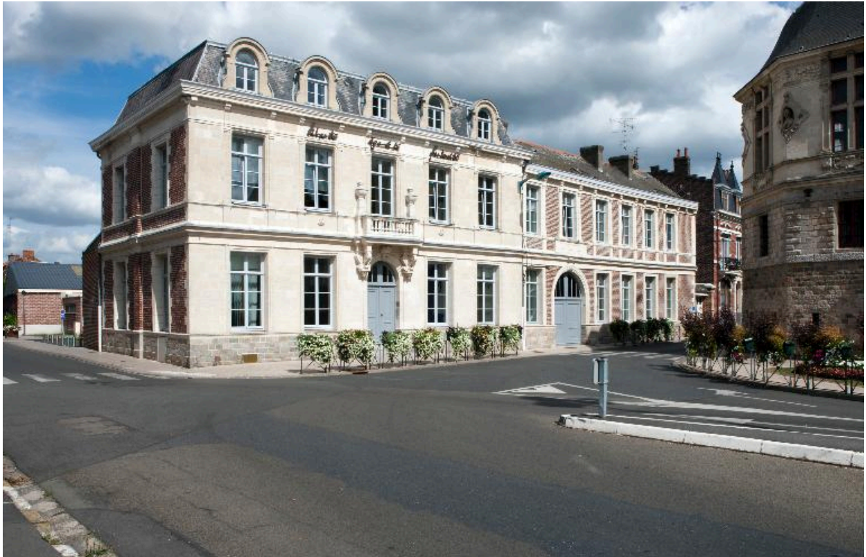
Ancienne maison bourgeoise intégrée dans l'actuel hôtel de ville, à l'angle de la rue Dumoulin et la Grand'Place..