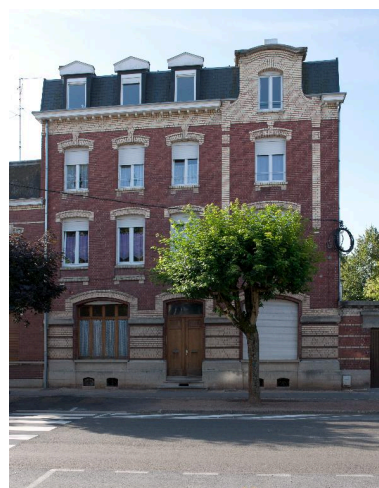
Immeuble, début XXe siècle (?), 6 avenue du Clos. IVR31_20125902167NUCA