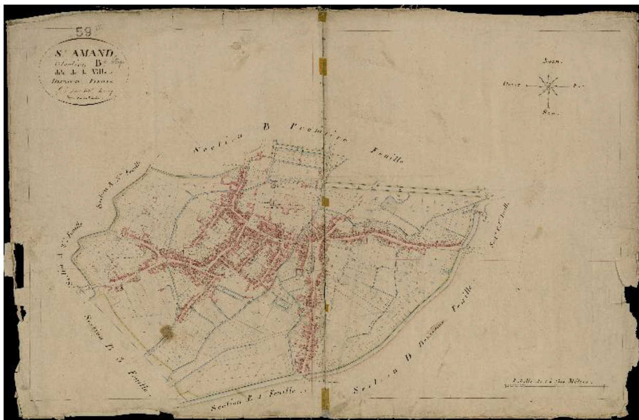
Cadastre de 1817, section B dite de la ville, feuille 2 (AD Nord, P31/627).