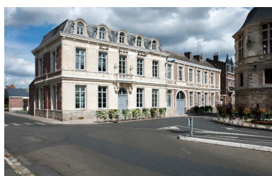
Ancienne maison bourgeoise intégrée dans l'actuel hôtel de ville, à l'angle de la rue Dumoulin et la Grand'Place..