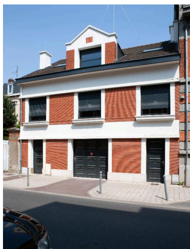
Maison construite dans les années 1940-50, rue Mathieu-Dumoulin.