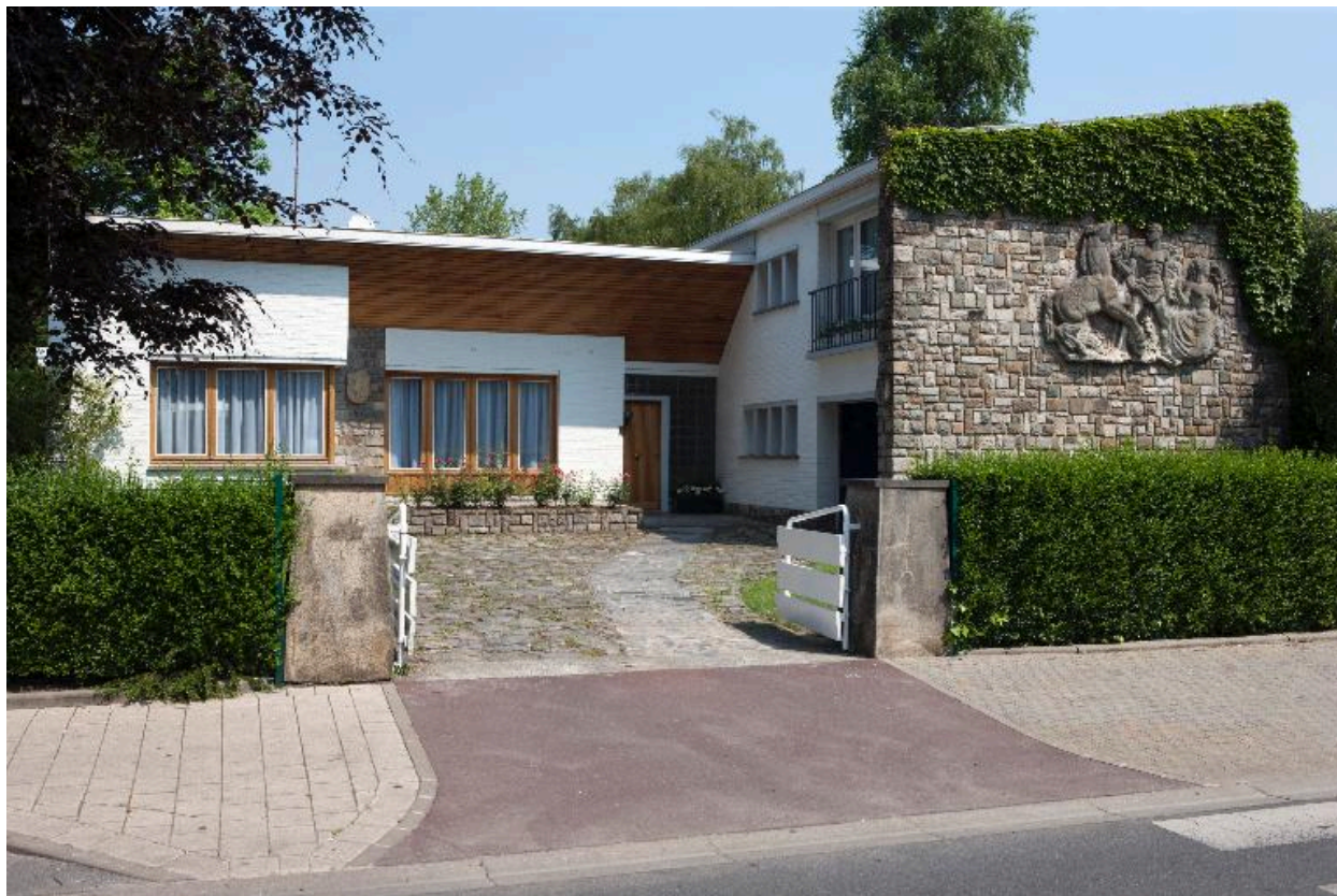
Maison datant des années 1960-70, rue Mathieu-Dumoulin.