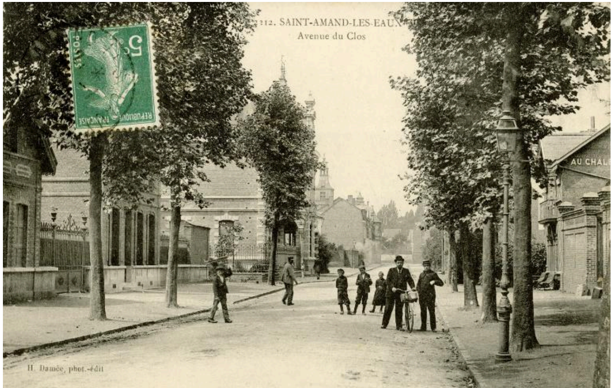
Vue générale de la rue Dumoulin, appelée du Clos, carte postale, 1er quart du 20e siècle.