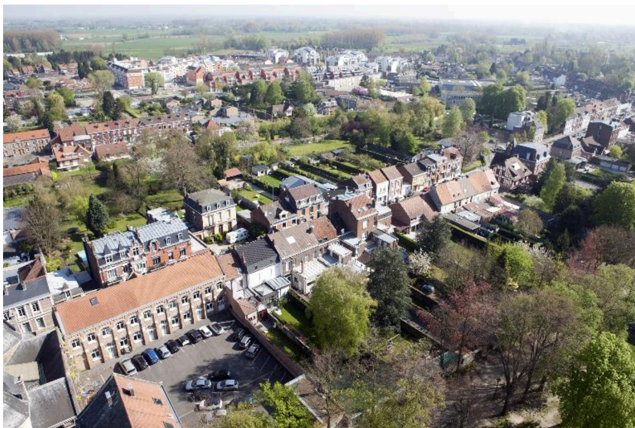
Vue générale de la rue Mathieu-Dumoulin et l'avenue du Clos, depuis la tour abbatiale.