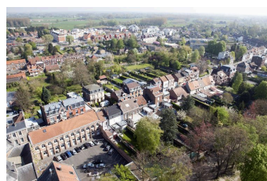
Vue générale de la rue Mathieu-Dumoulin et l'avenue du Clos, depuis la tour abbatiale.