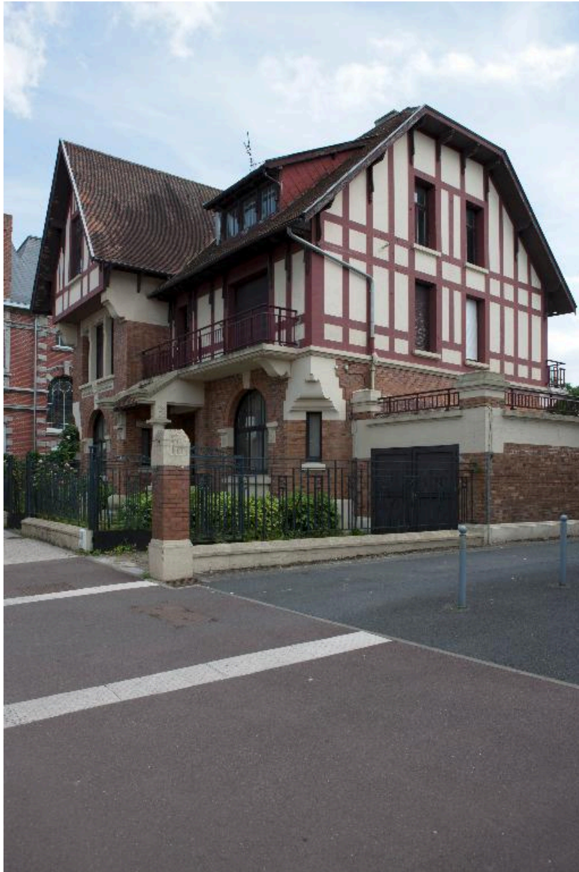
Maison patronale construite dans les années 1920 dans un style néo-normand, rue Mathieu-Dumoulin.