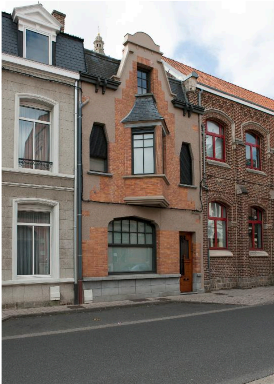
Maison datant des années 1920, 2 rue Mathieu-Dumoulin.