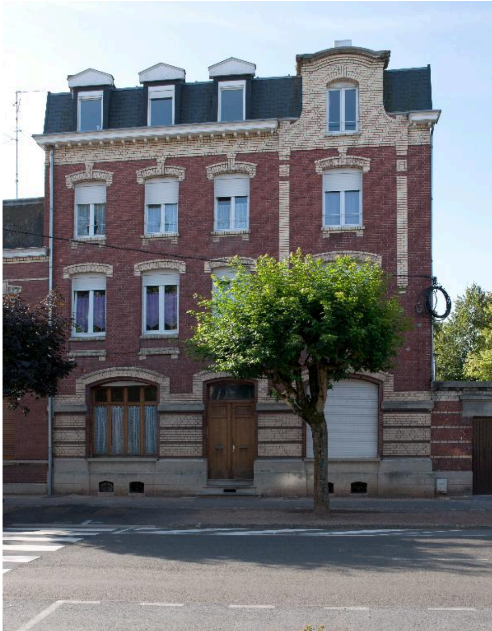
Immeuble, début XXe siècle (?), 6 avenue du Clos.