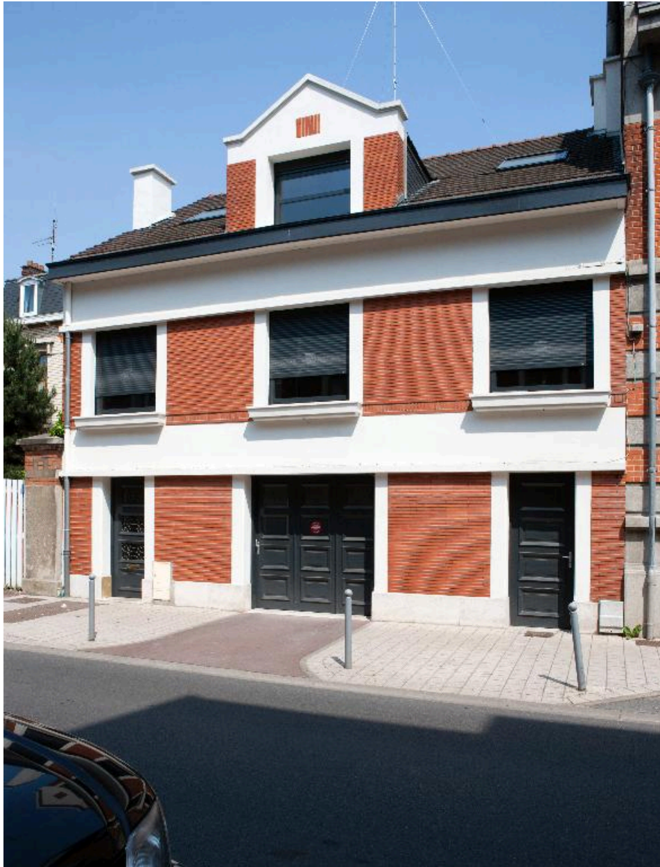
Maison construite dans les années 1940-50, rue Mathieu-Dumoulin.