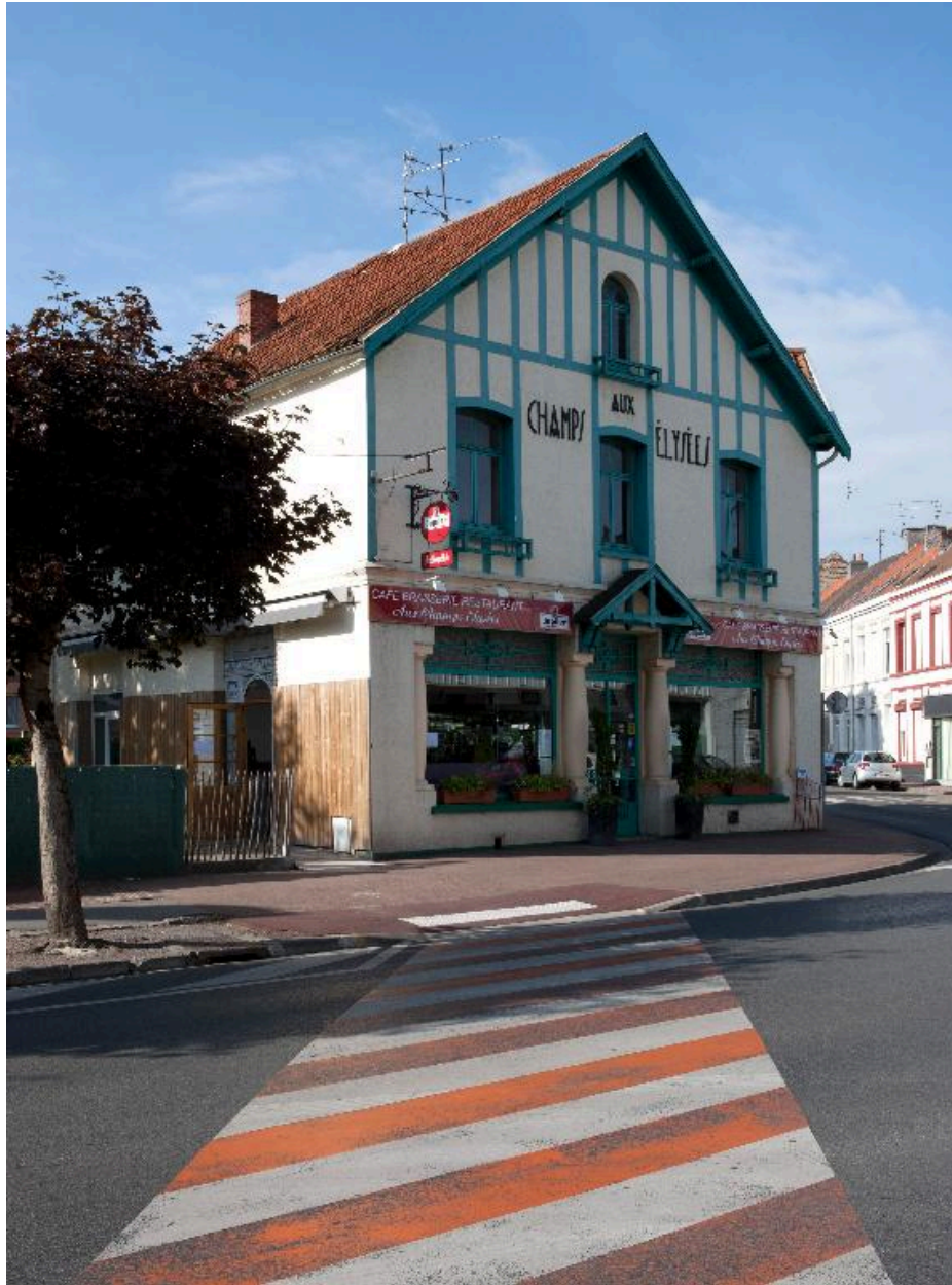
Café Aux Champs Elysées, 40 avenue du Clos, construit dans les années 1920.