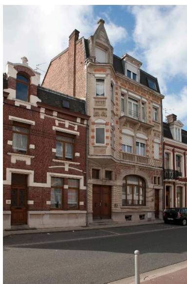
Maison construite dans les années 1920 d'inspiration de style Art-Déco, avenue du Clos. IVR31_20125902126NUCA