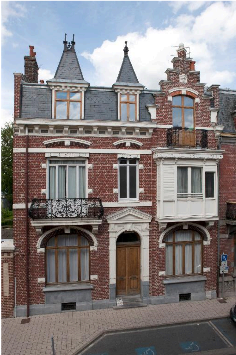
Maison patronale ou bourgeoise, rue Mathieu-Dumoulin.