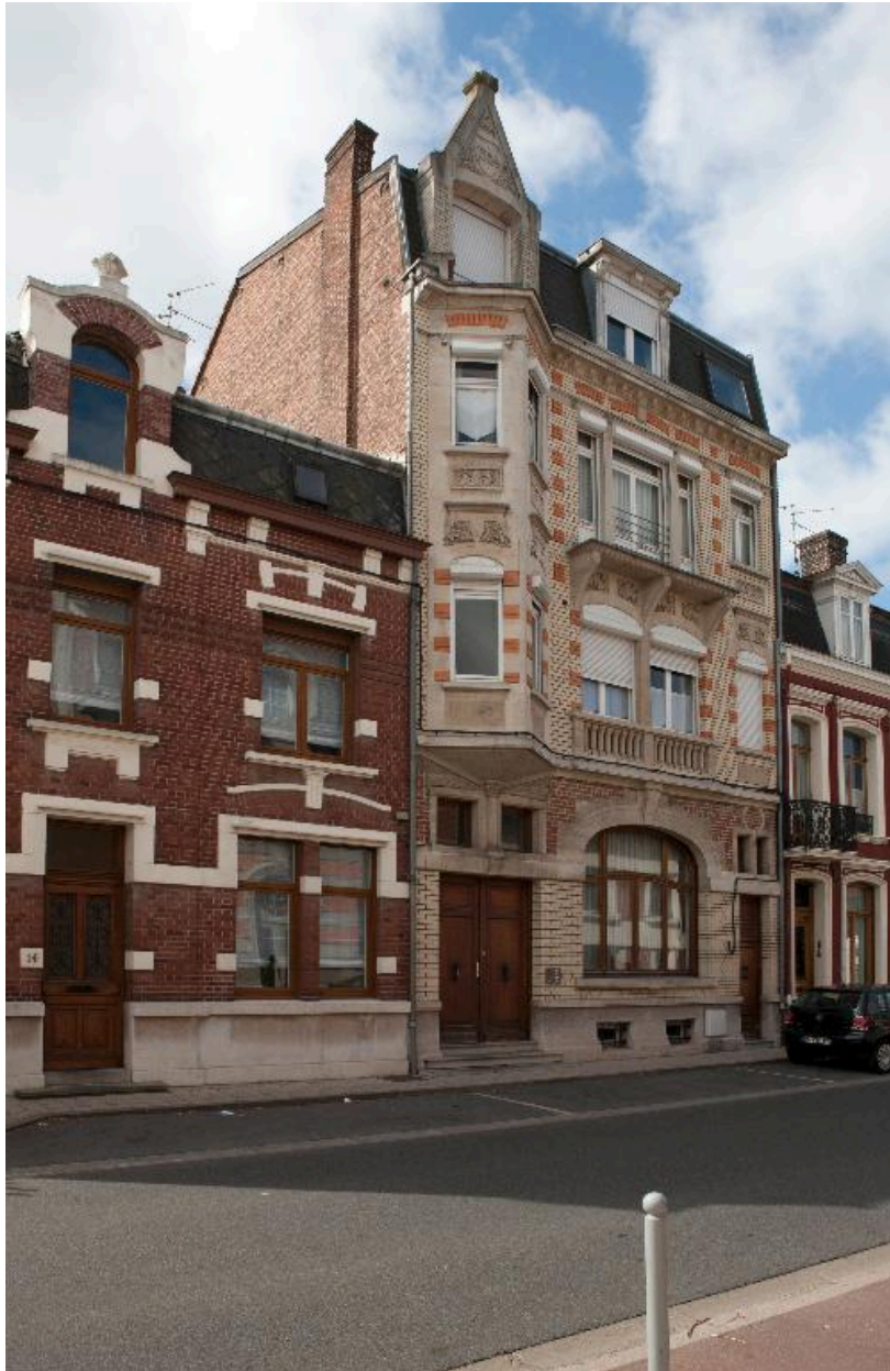
Maison construite dans les années 1920 d'inspiration de style Art-Déco, avenue du Clos.