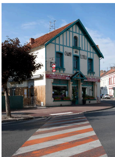
Café Aux Champs Elysées, 40 avenue du Clos, construit dans les années 1920.