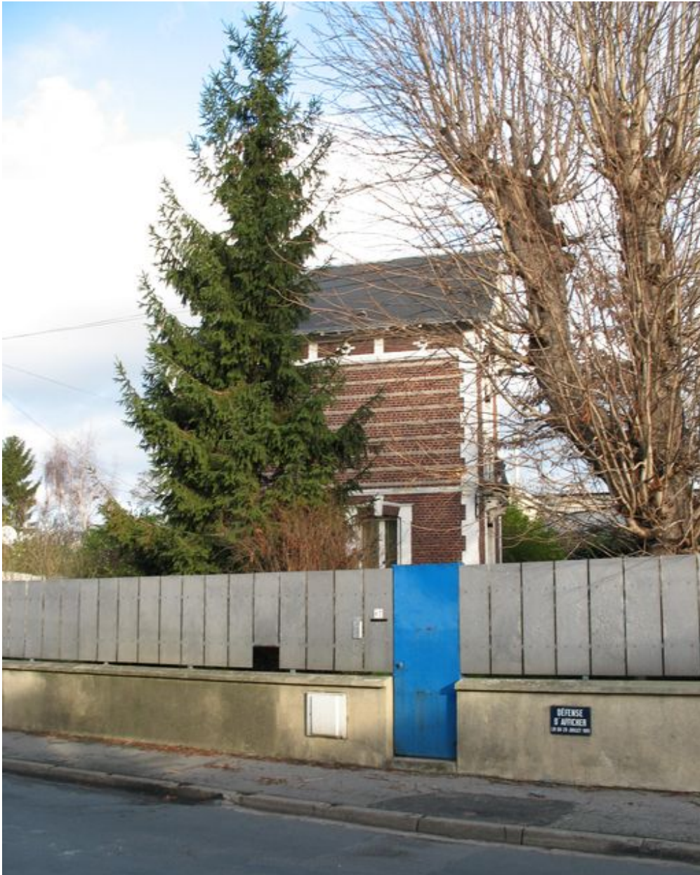
Entrée du logement sur la rue Jean-de-la-Fontaine entouré par une clôture en plaques d'aluminium.