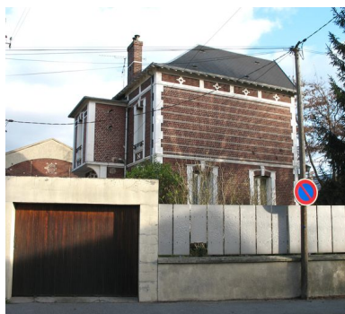
L'ancien logement patronal depuis la rue Jean-de-La-Fontaine. IVR22_20066005080NUCA