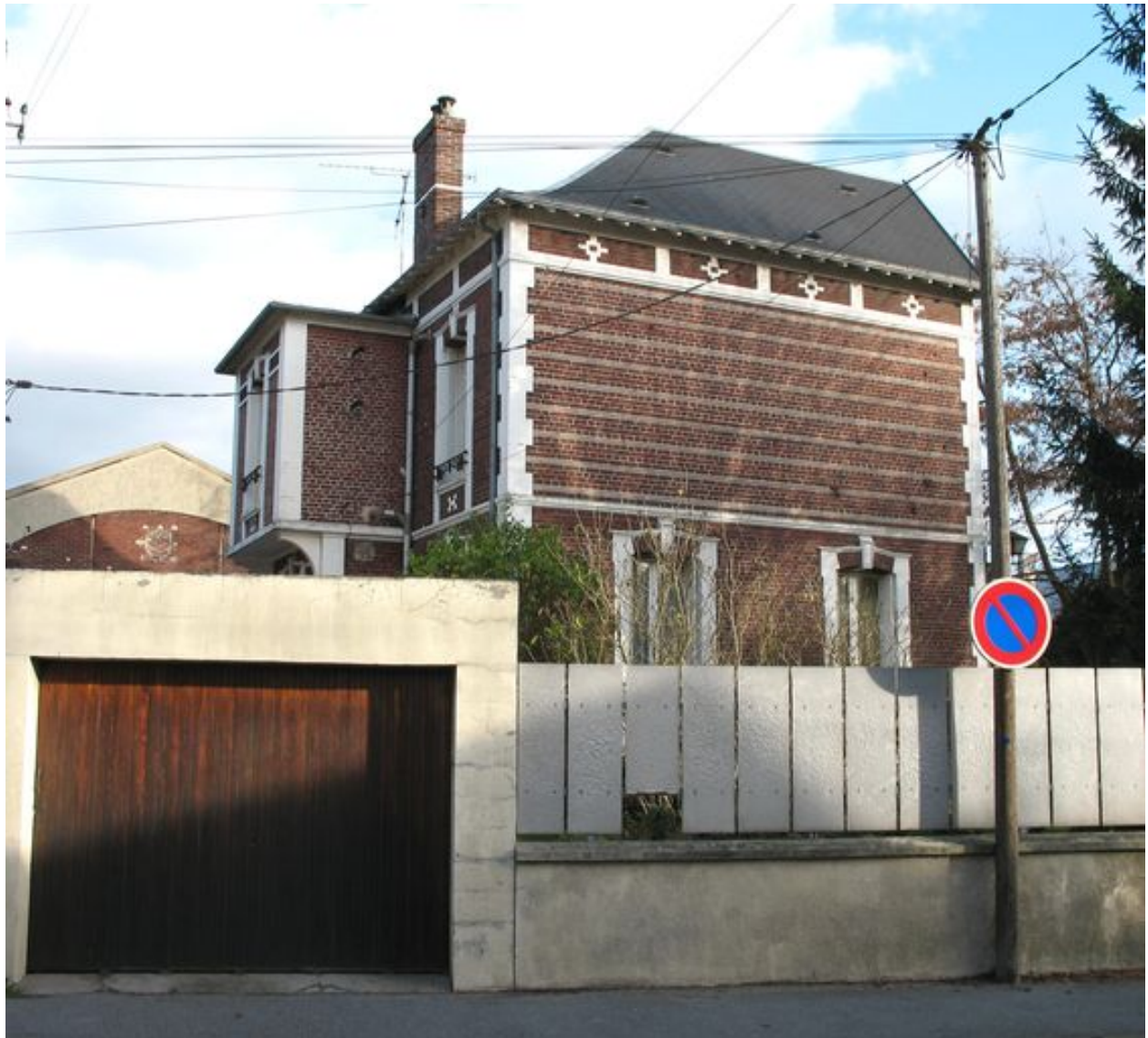
L'ancien logement patronal depuis la rue Jean-de-La-Fontaine.