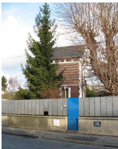
Entrée du logement sur la rue Jean-de-la-Fontaine entouré par une clôture en plaques d'aluminium.