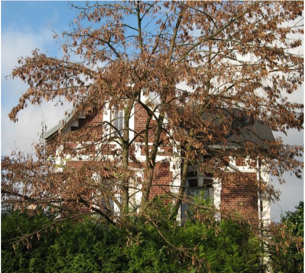
Le logement depuis la cour de l'usine.