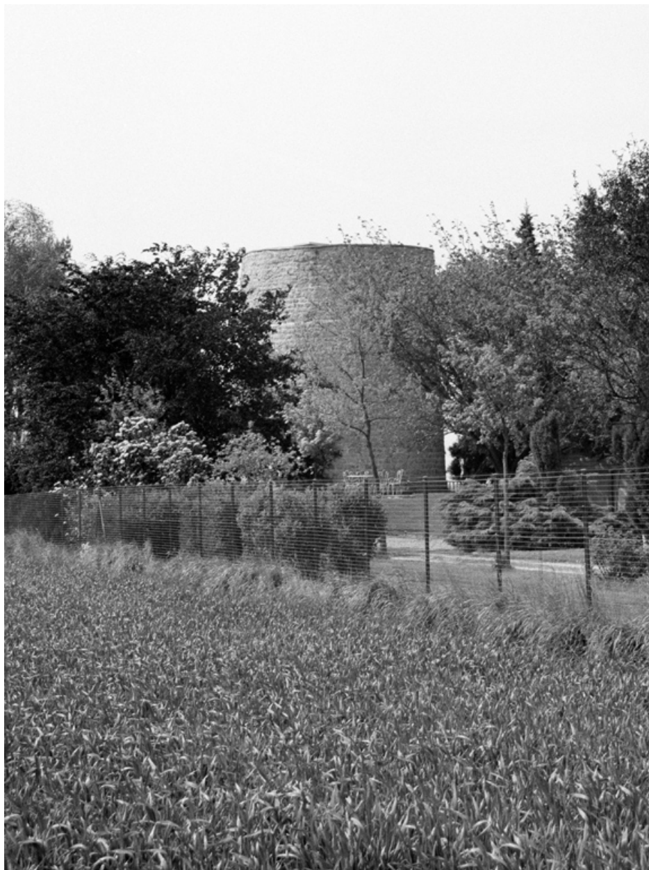
Le moulin Arrachard.