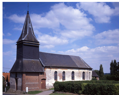
L'église Saint Jean-Baptiste.