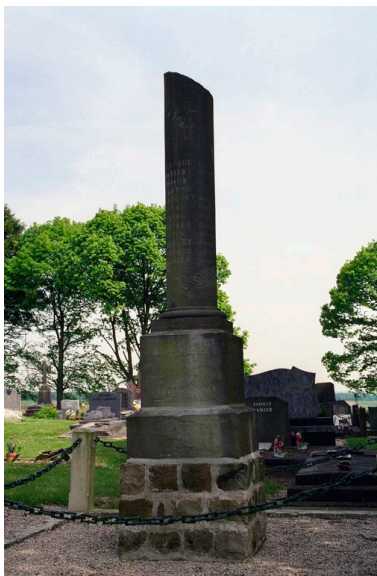
Le monument aux morts. IVR22_20018000120ZE