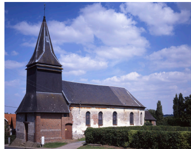
L'église Saint Jean-Baptiste.