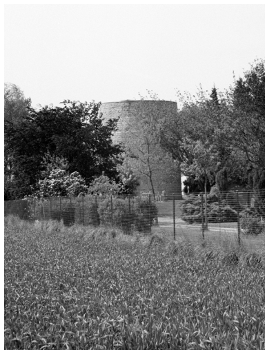
Le moulin Arrachard. IVR22_20018000284Z