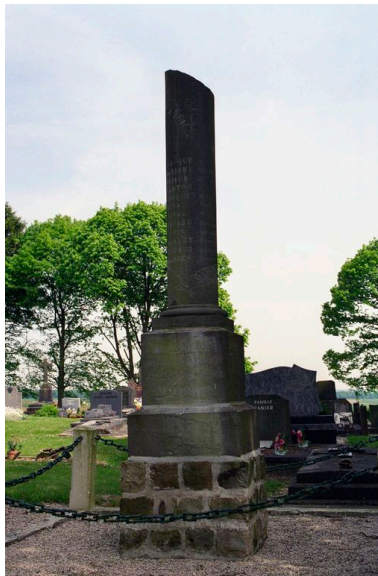
Le monument aux morts. IVR22_20018000120ZE