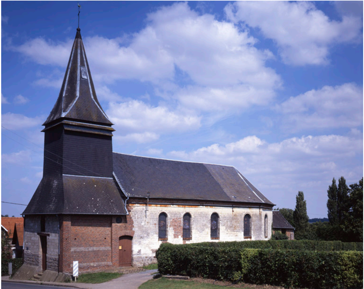
L'église Saint Jean-Baptiste.