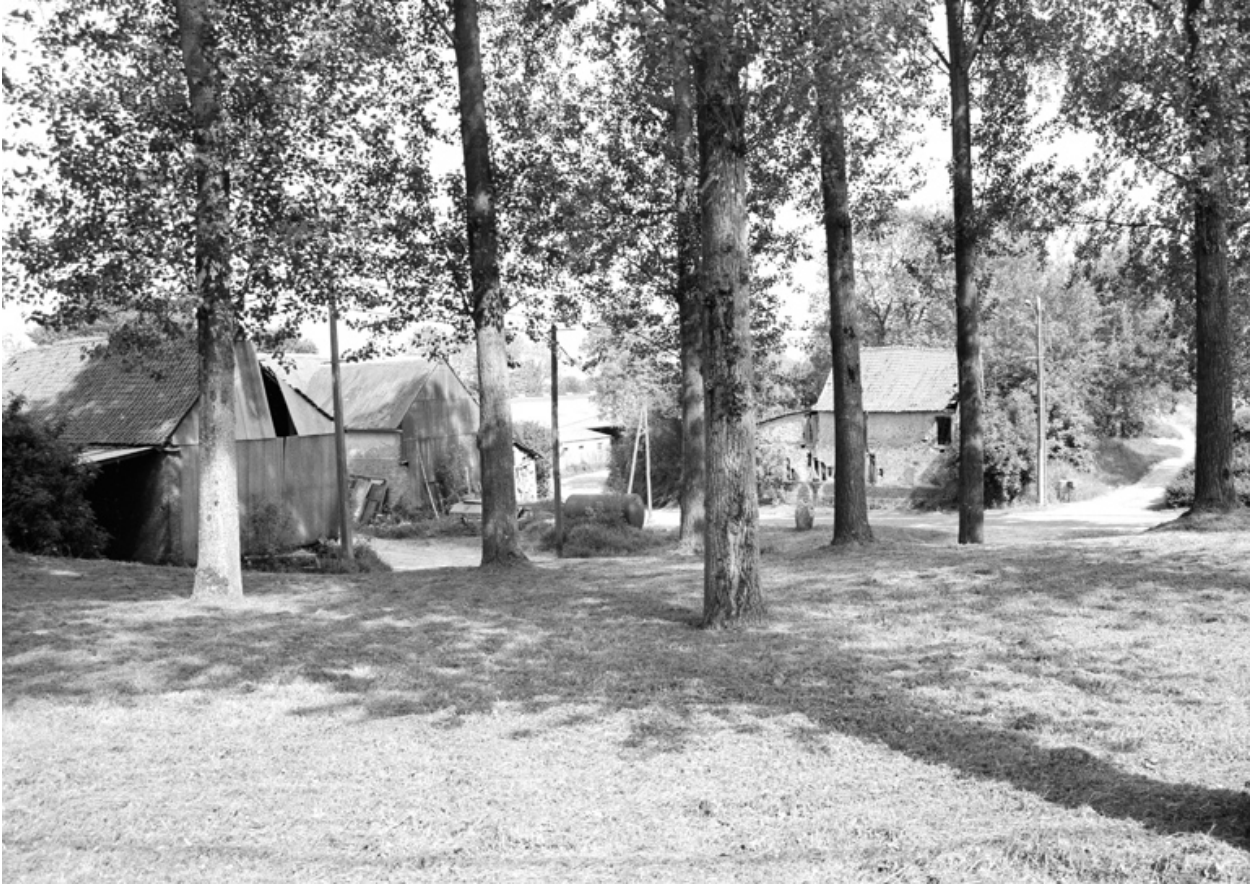
La place, au bas du village.