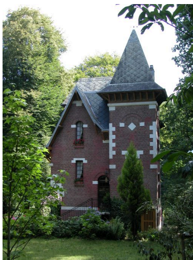
Vue d'ensemble depuis l'allée Marie. IVR22_20058003311NUCA