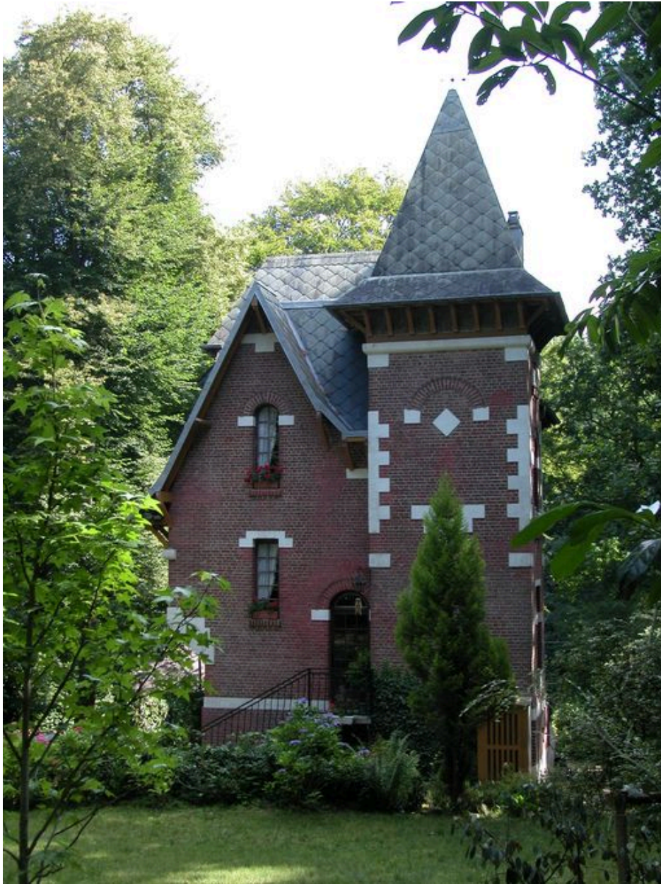
Vue d'ensemble depuis l'allée Marie.