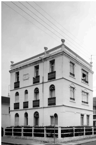
La maison en 1981, avec sa balustrade. IVR31_19816203689X