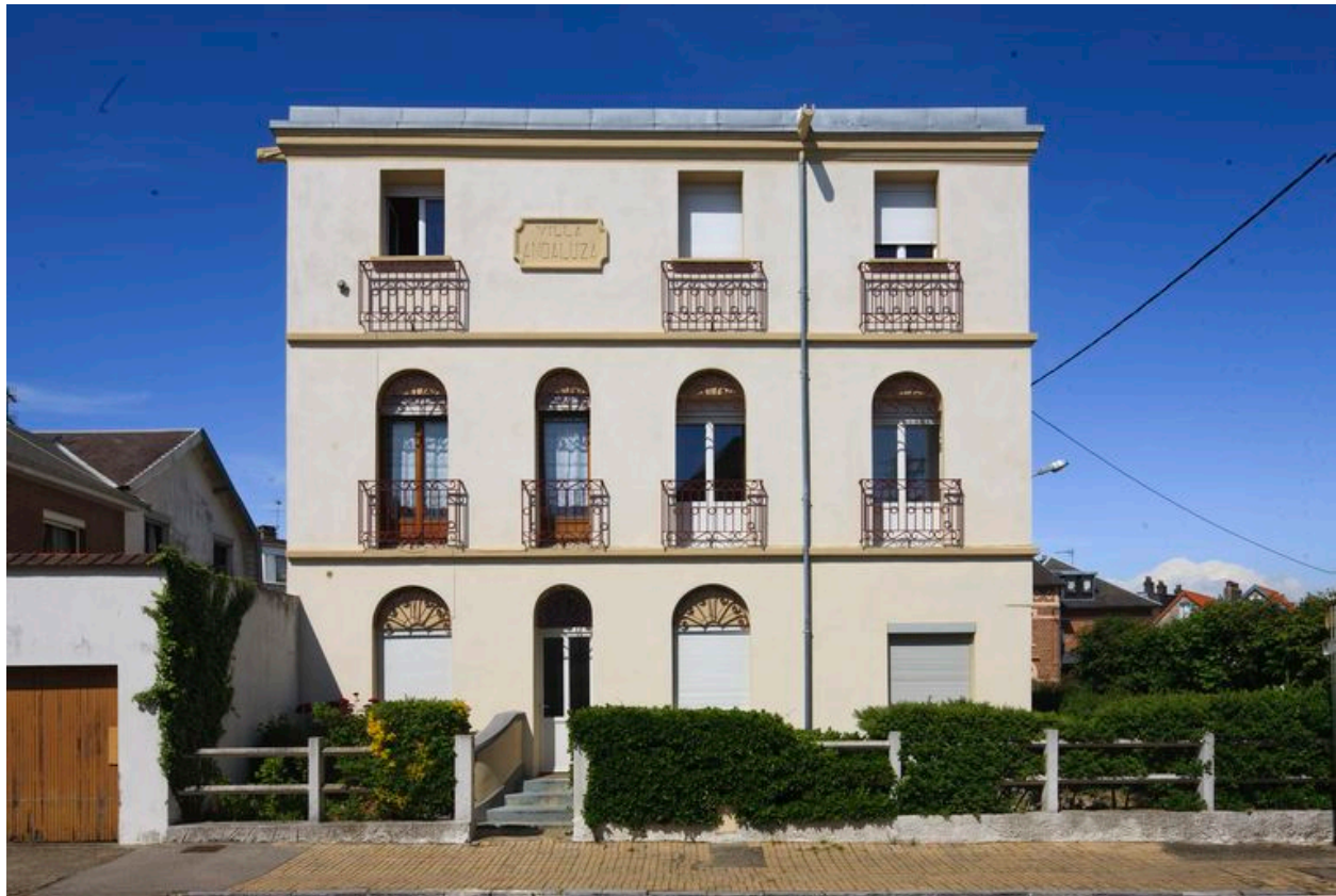
Vue générale, élévation rue Arthur-Becquart.