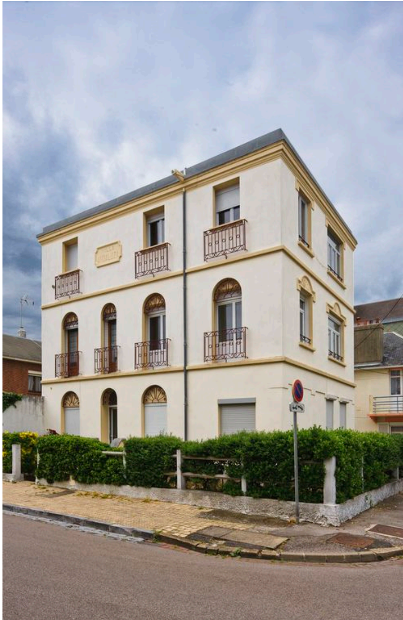
Vue générale de trois quarts.