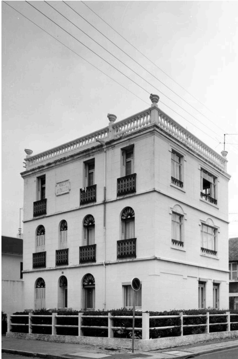
La maison en 1981, avec sa balustrade.