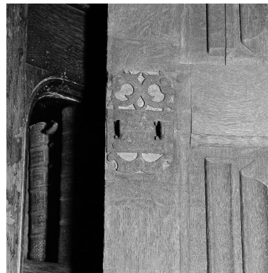
Détail de la ferrure d'un des volets.