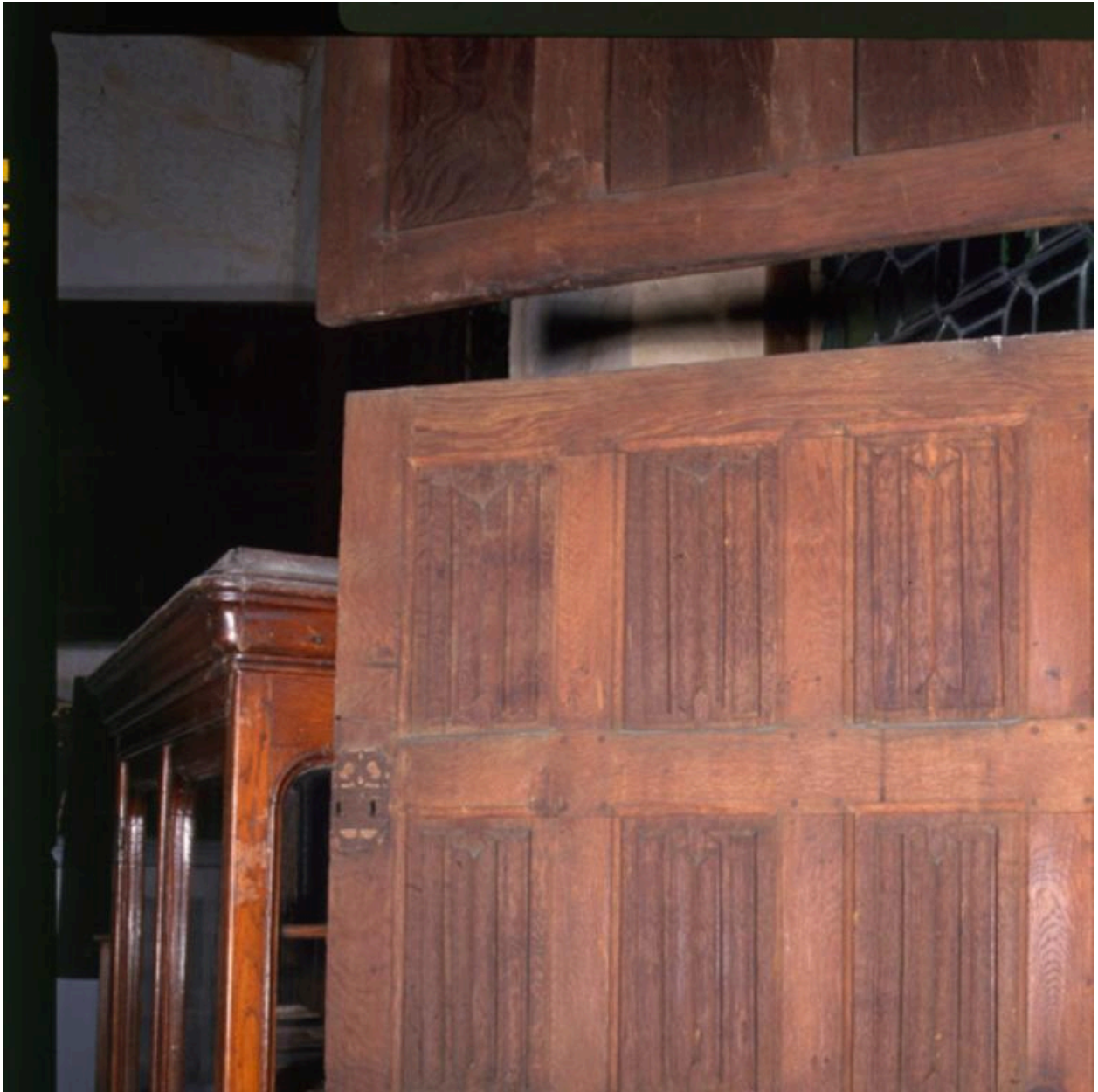
Volet intérieur : face extérieure du volet du bas.