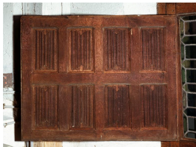
Vue du volet intérieur de la sacristie des enfants de chœur.