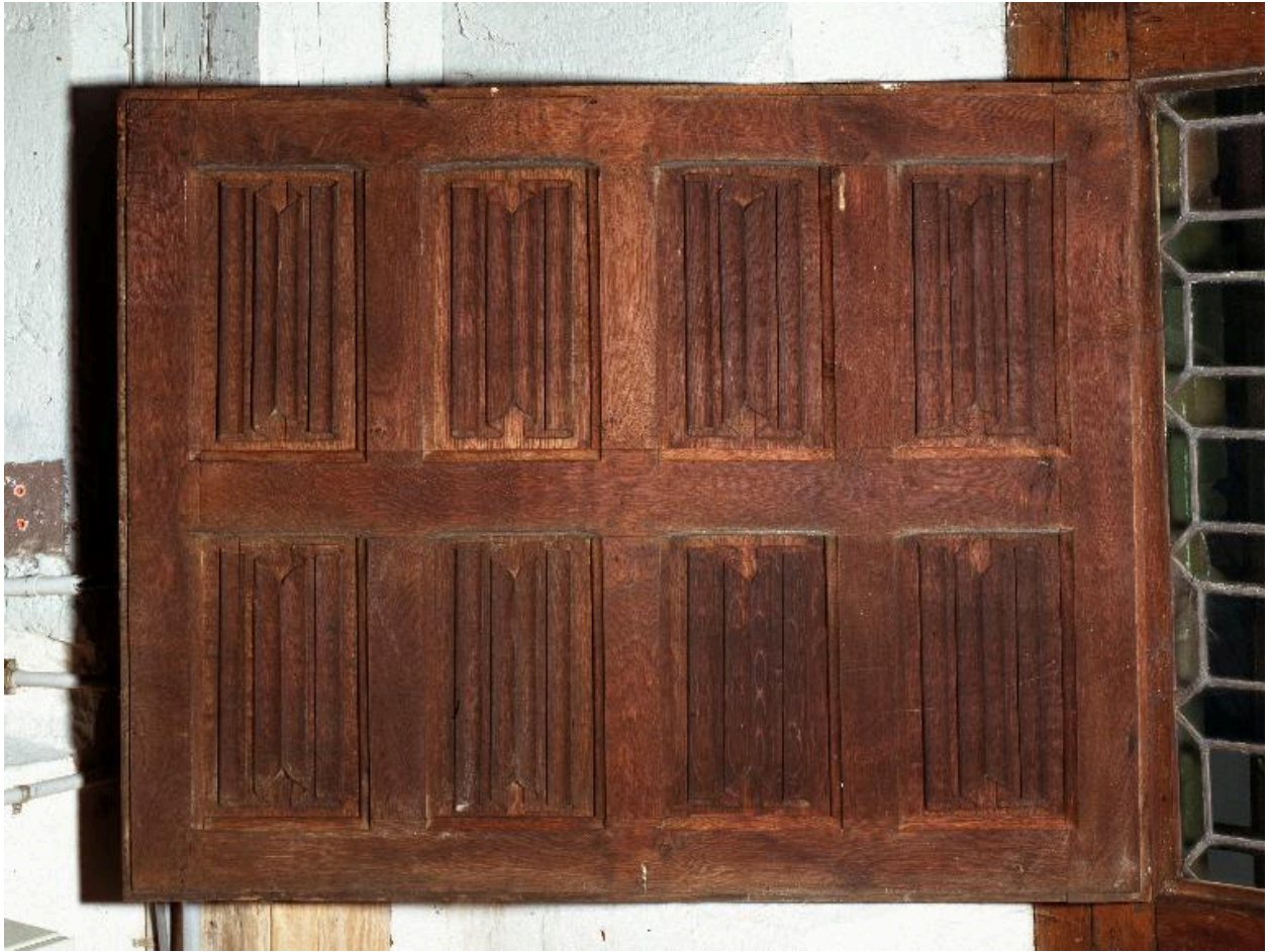
Vue du volet intérieur de la sacristie des enfants de chœur.