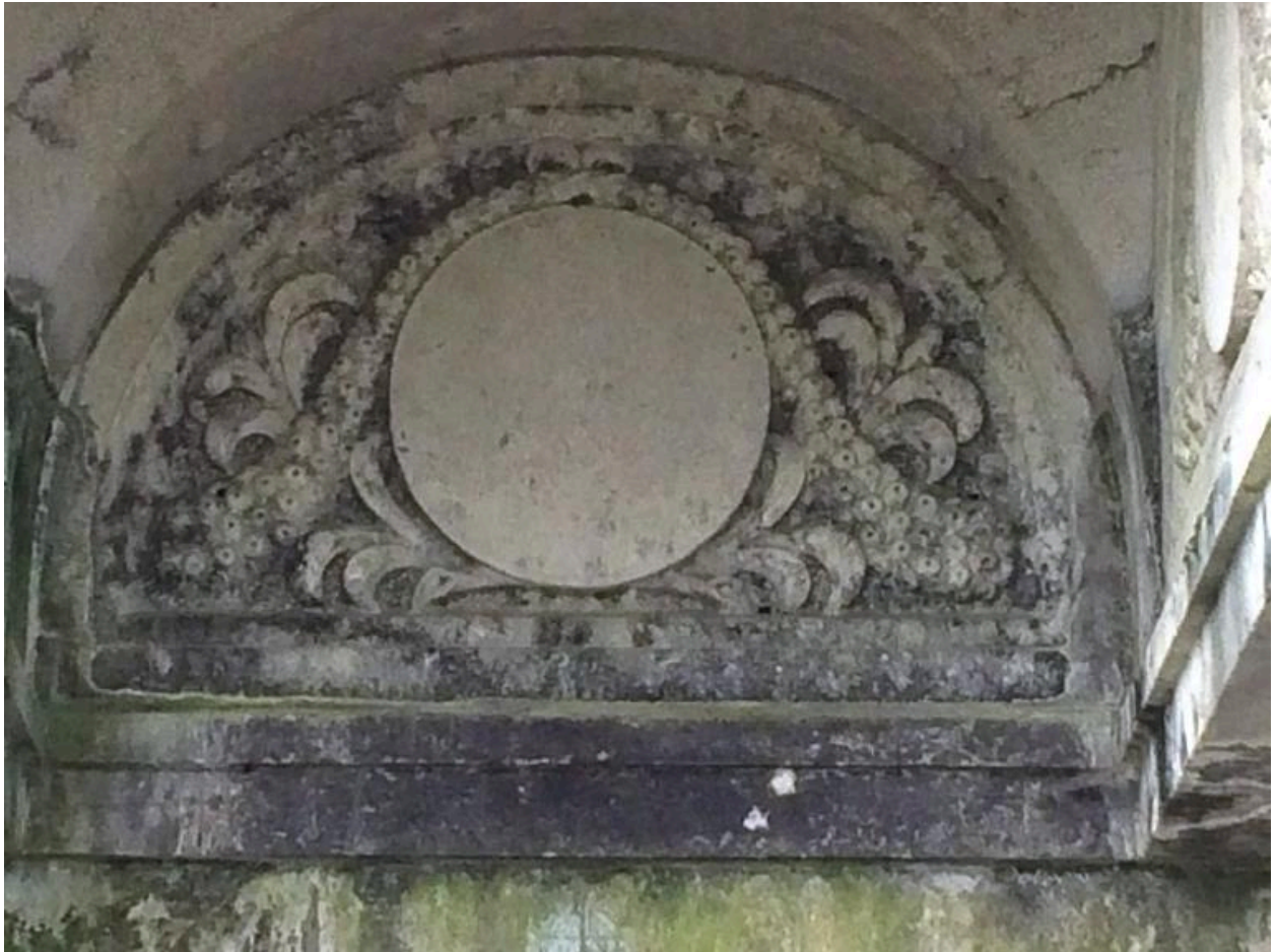
Détail du décor sculpté (intérieur du tombeau).