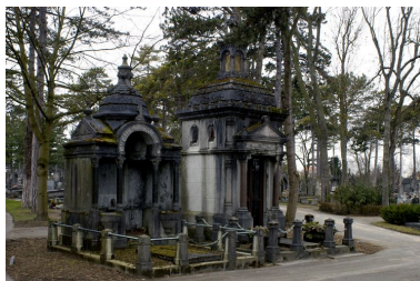
Vue de situation, tombeau à gauche de l'image.