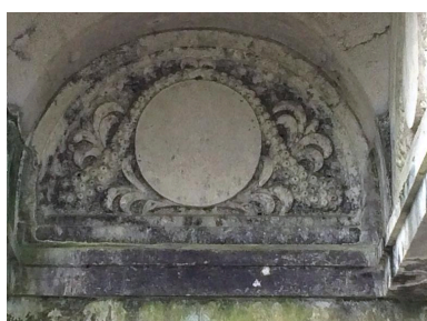
Détail du décor sculpté (intérieur du tombeau). IVR32_20178005160NUCA