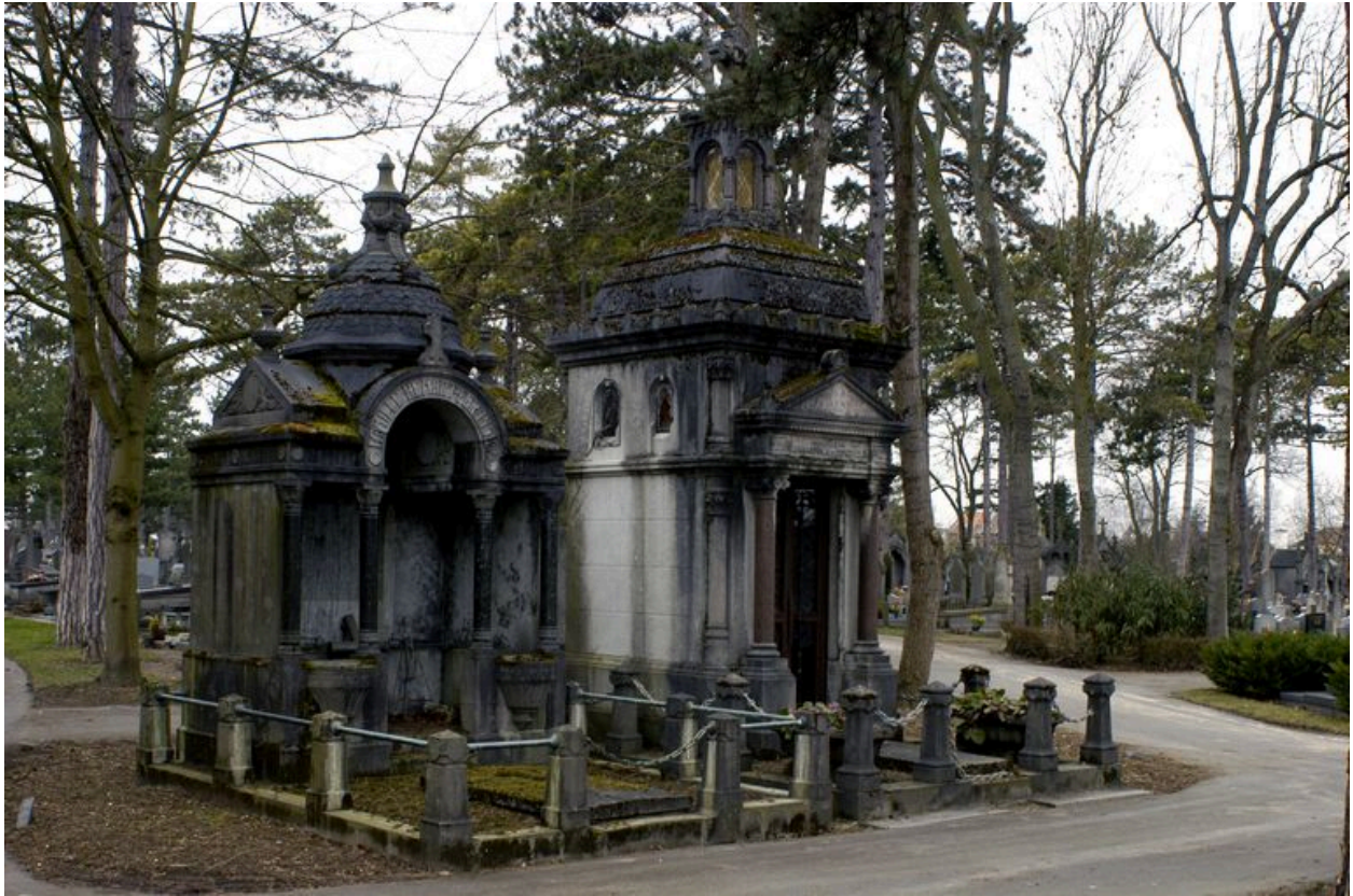
Vue de situation, tombeau à gauche de l'image.