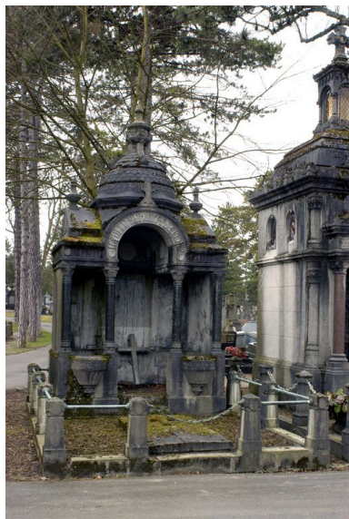
Vue générale. IVR22_20058000288NUCA