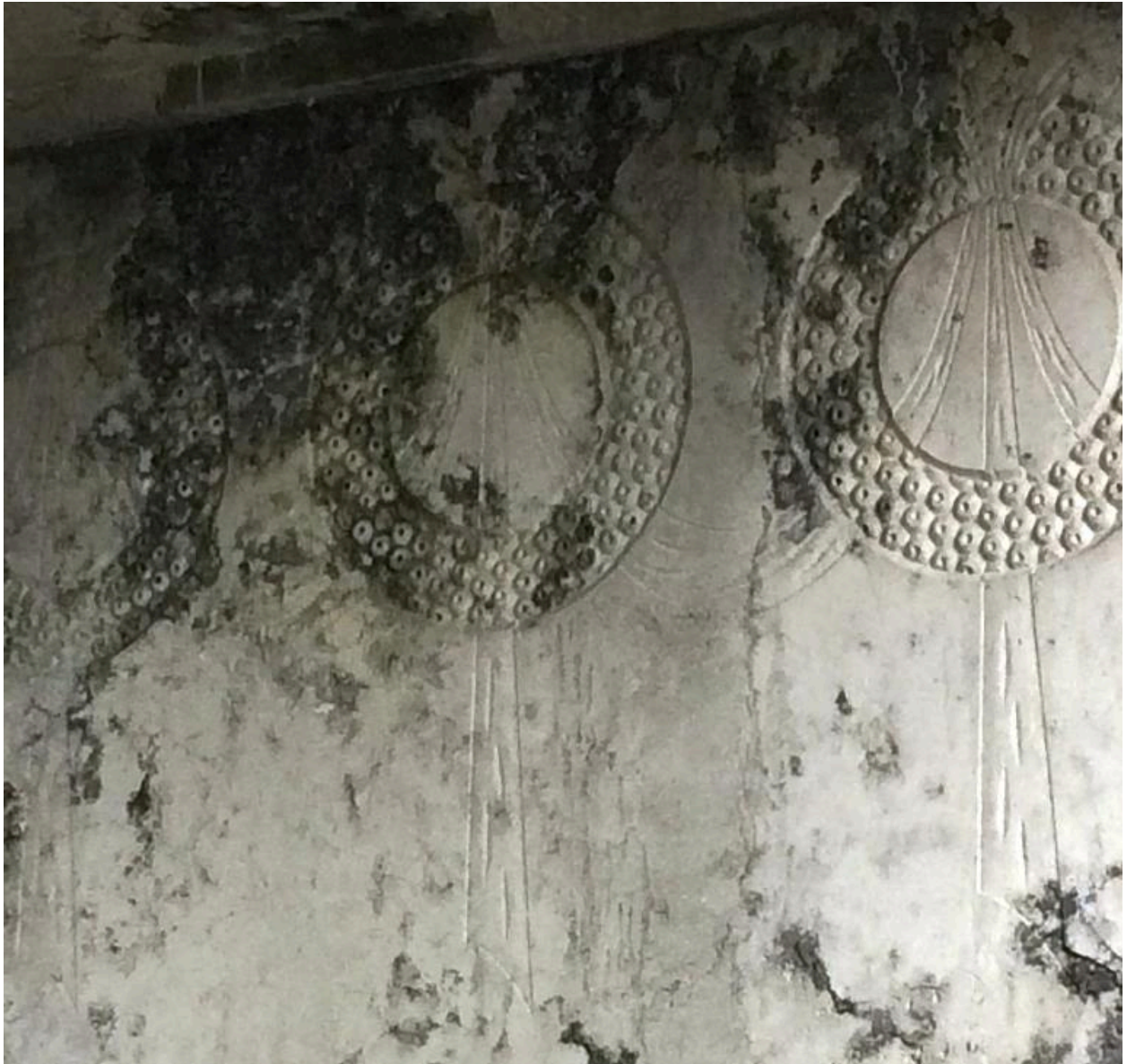
Détail du décor sculpté (intérieur du tombeau).