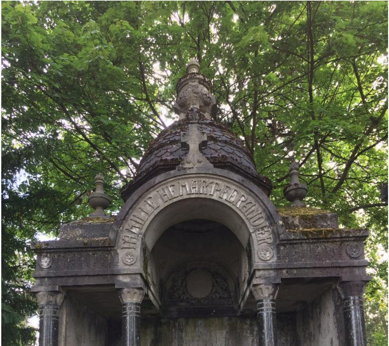
Détail de la partie supérieure du tombeau.