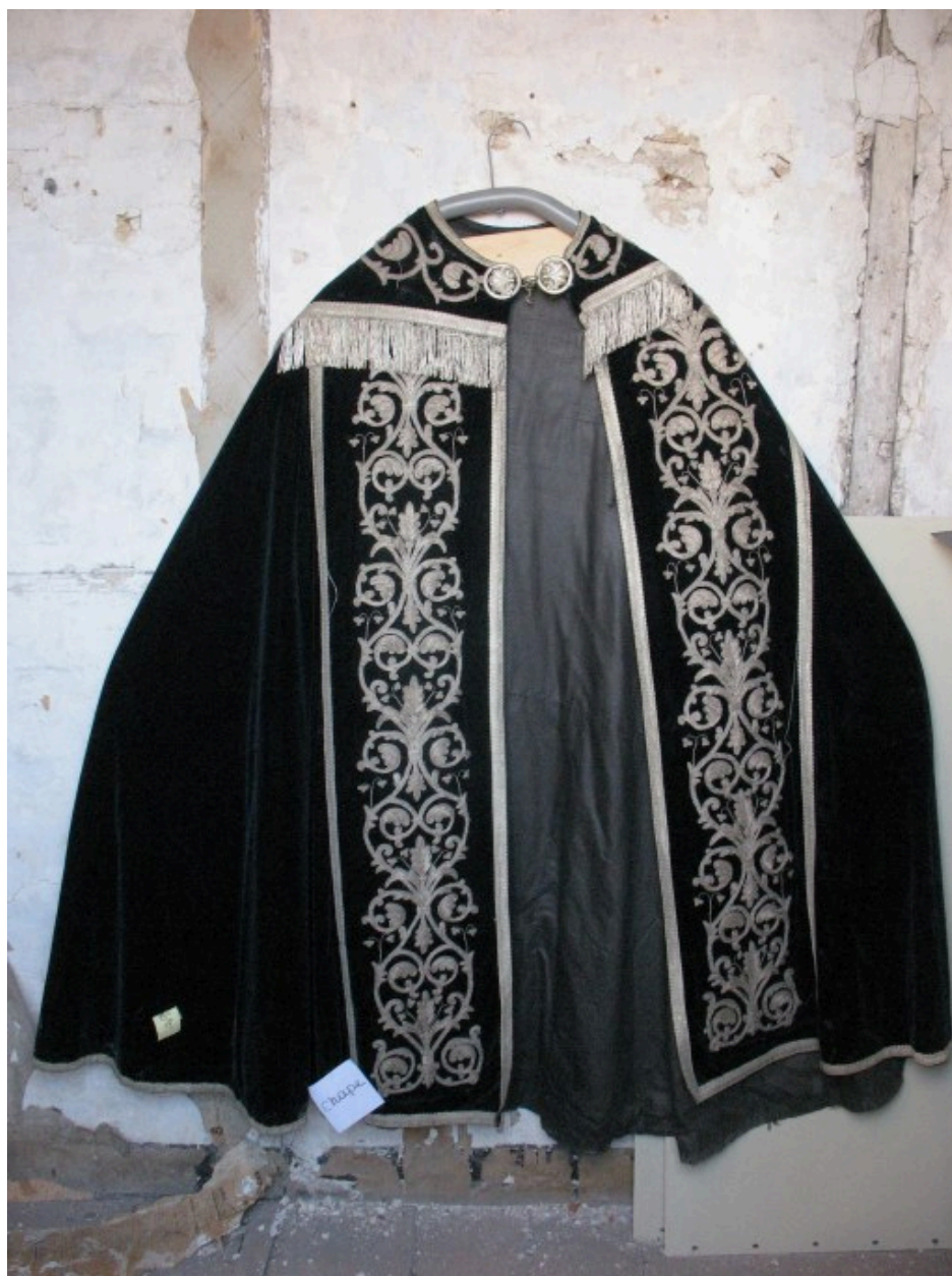
Chape : vue générale, devant