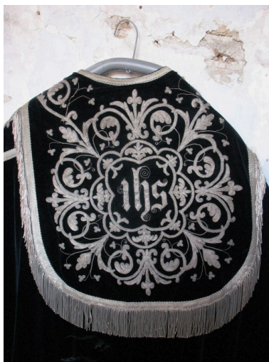
Chape : vue de détail, chaperon IVR31_20106204124NUCA