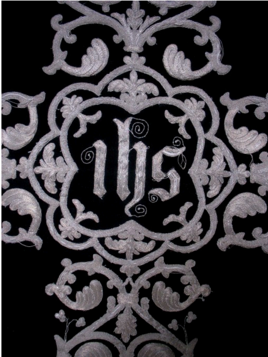
Chasuble : vue de détail, dos, motif central