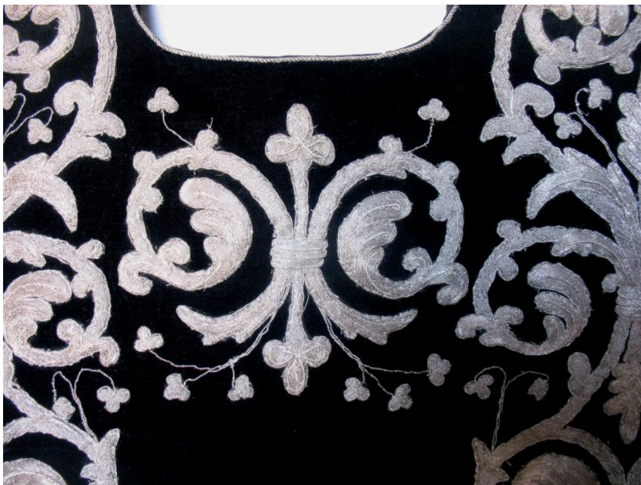
Dalmatique : vue de détail, décor