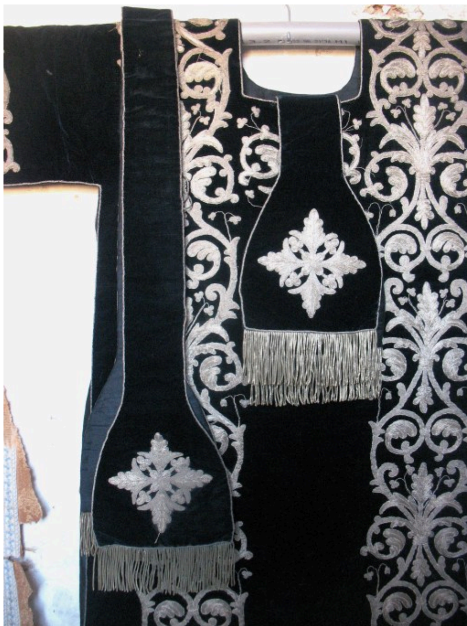
Dalmatique, étole, manipule : vue partielle