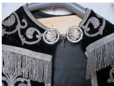
Chape : vue de détail, fermail IVR31_20106204123NUCA