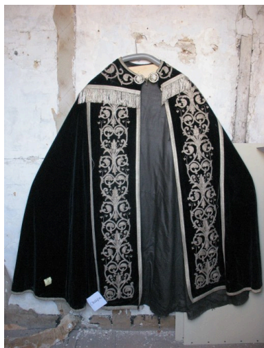
Chape : vue générale, devant IVR31_20106204121NUCA