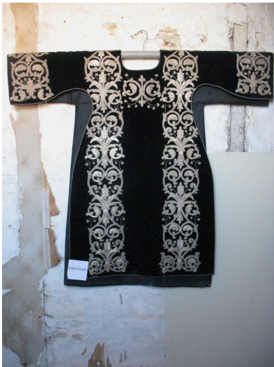
Dalmatique : vue générale, devant