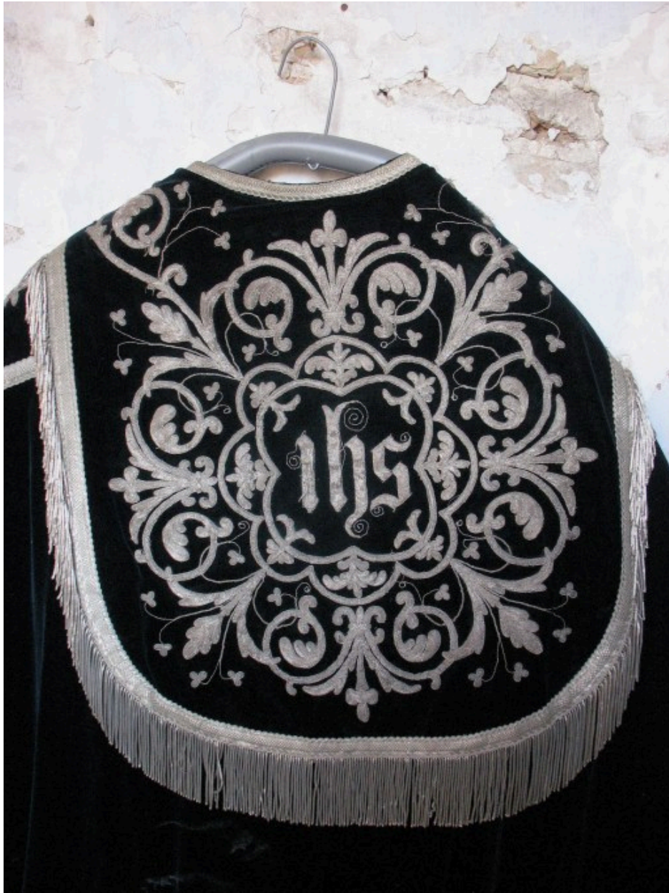
Chape : vue de détail, chaperon