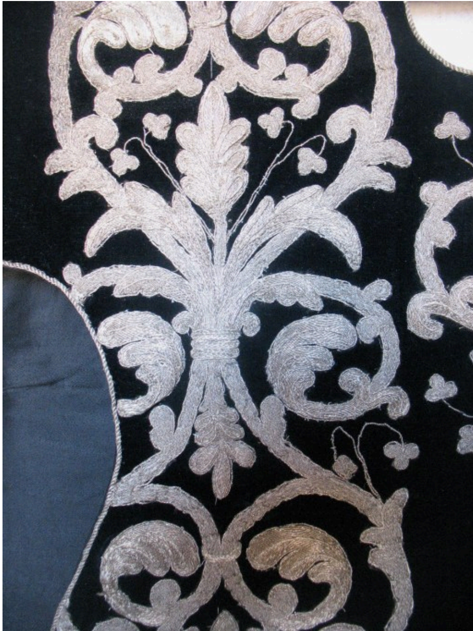
Dalmatique : vue de détail, décor