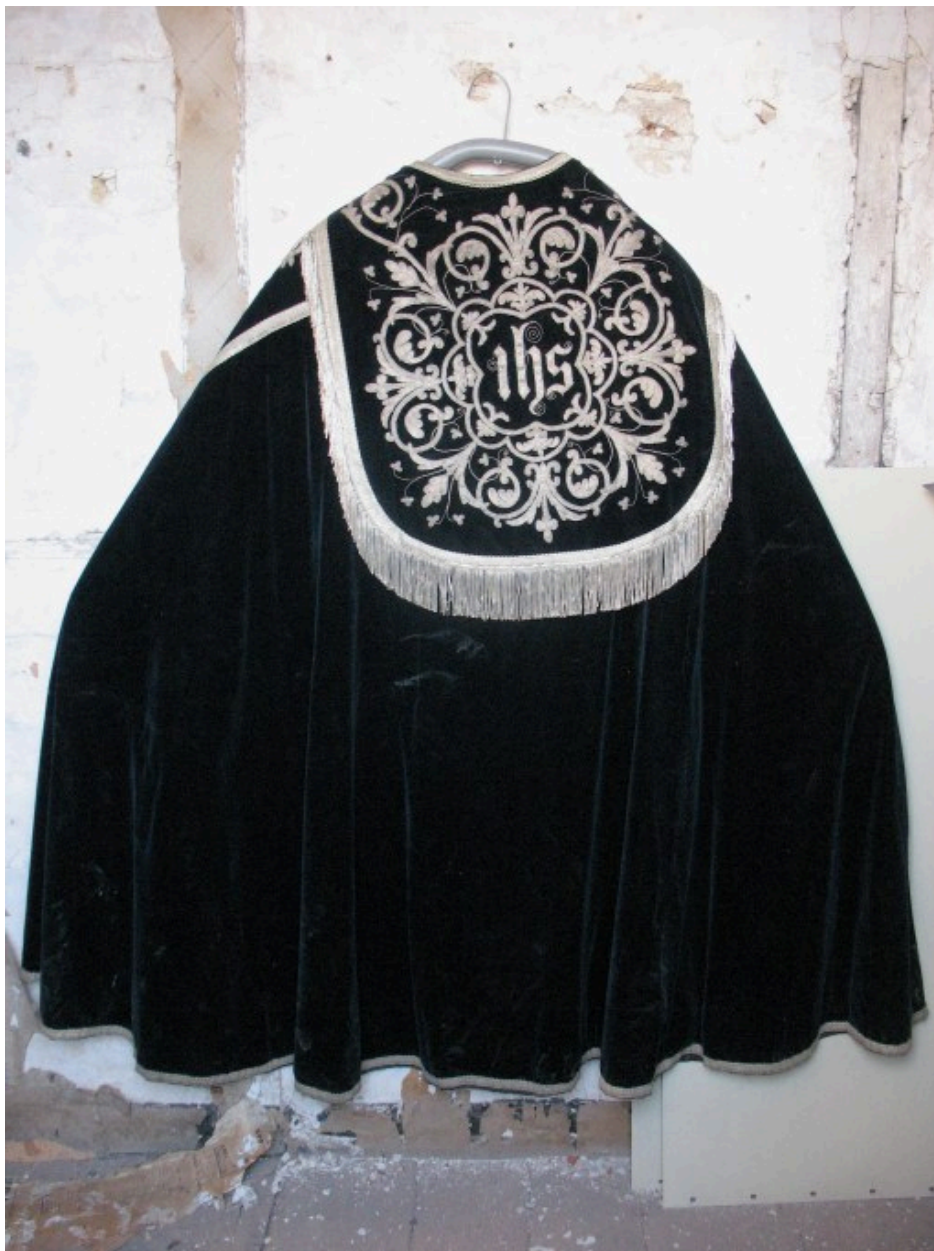
Chape : vue générale chape, dos