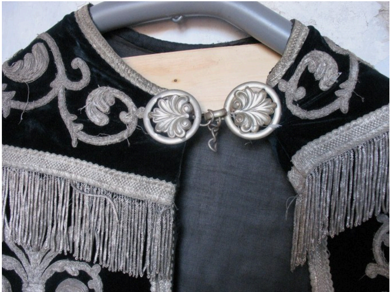
Chape : vue de détail, fermail