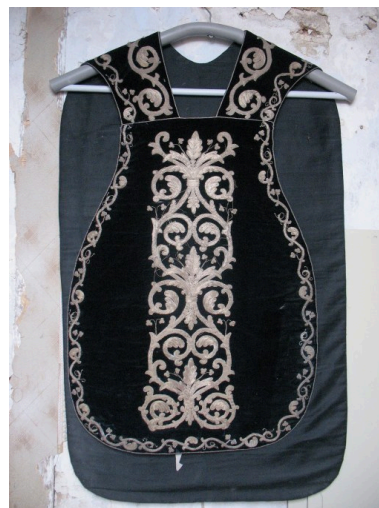
Chasuble : vue générale chasuble, devant IVR31_20106204125NUCA