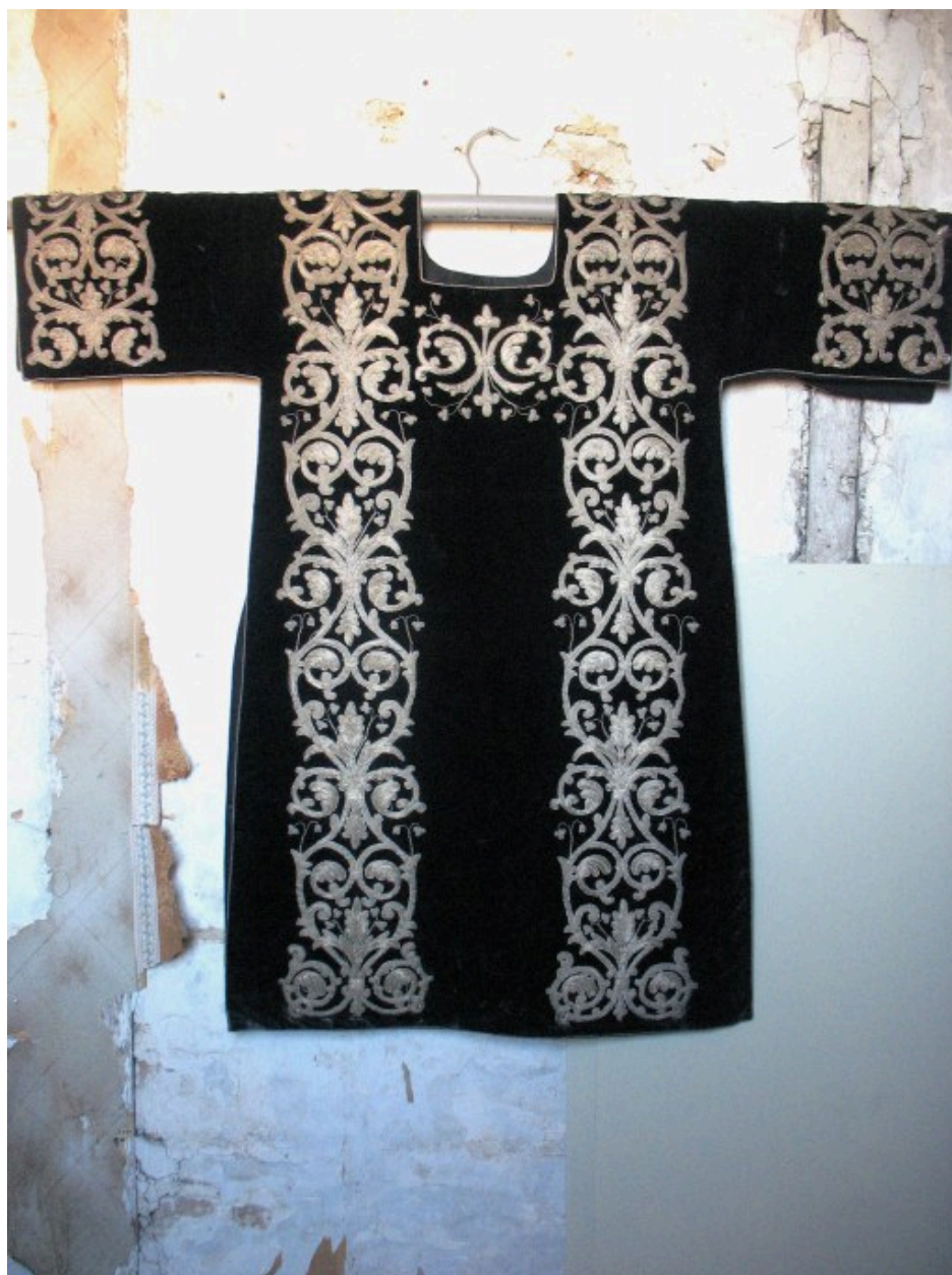
Dalmatique : vue générale, dos