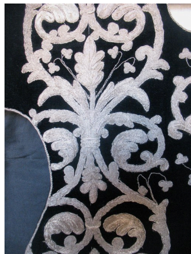
Dalmatique : vue de détail, décor IVR31_20106204129NUCA