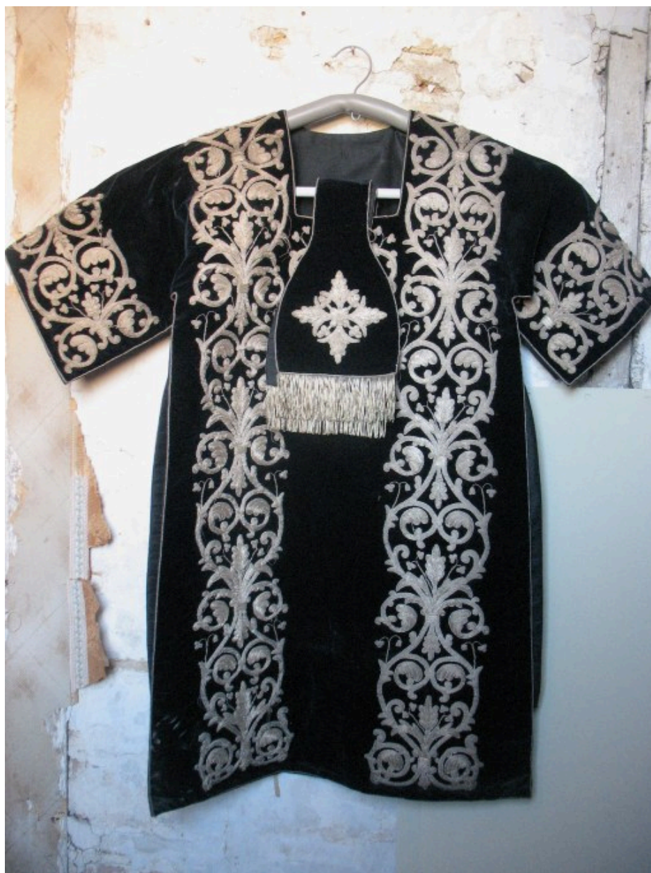
Dalmatique, étole : vue générale