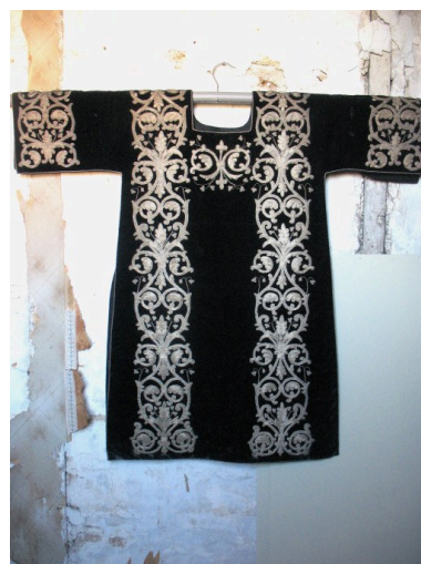
Dalmatique : vue générale, dos IVR31_20106204131NUCA