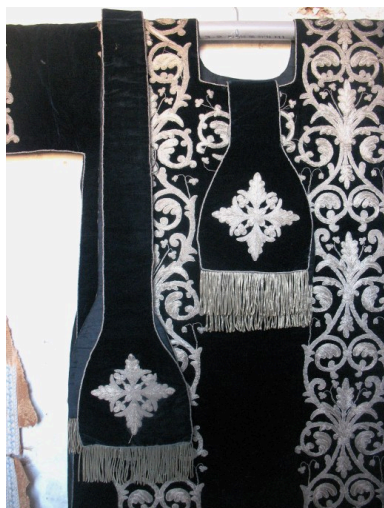
Dalmatique, étole, manipule : vue partielle IVR31_20106204132NUCA