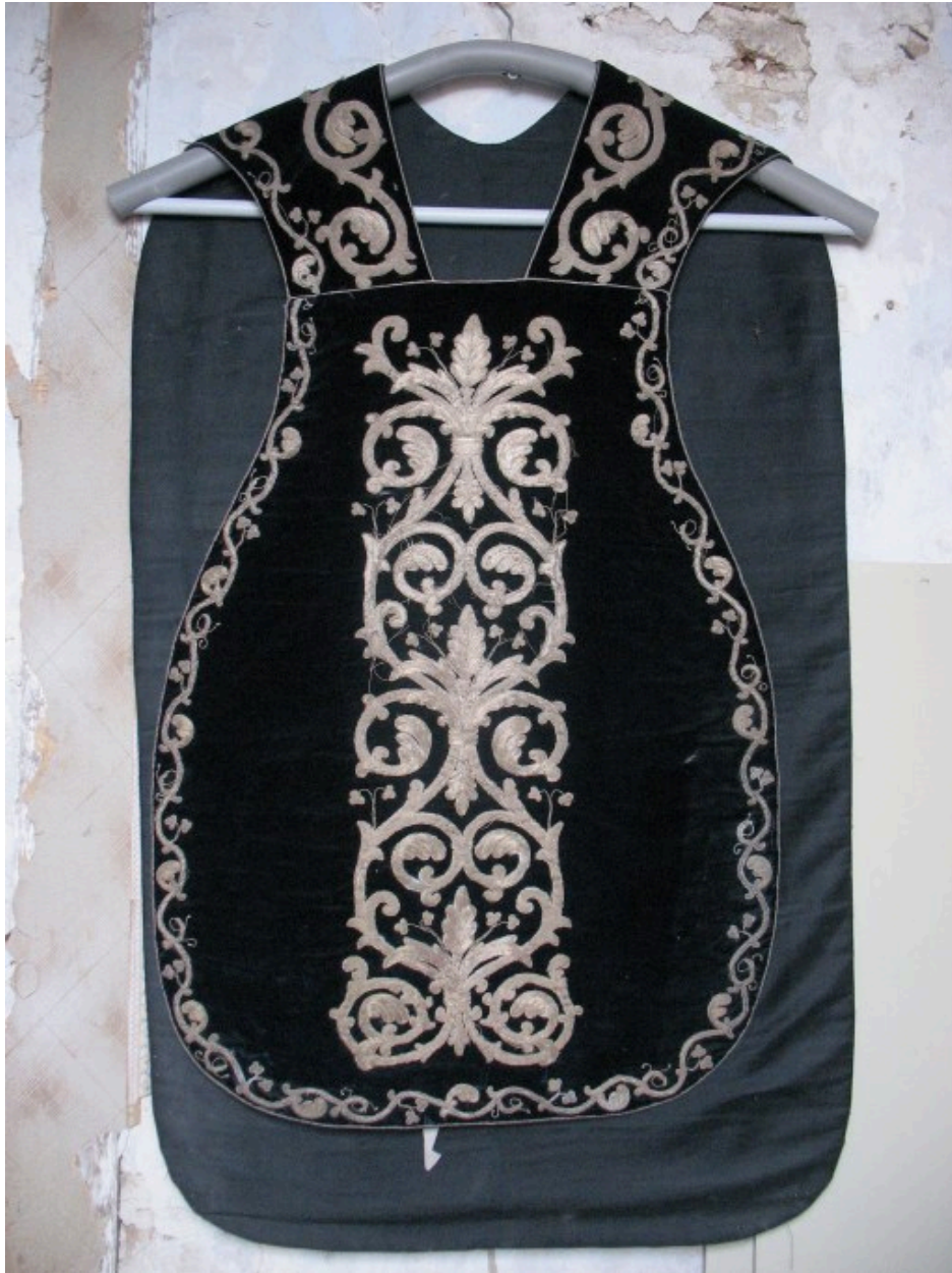
Chasuble : vue générale chasuble, devant