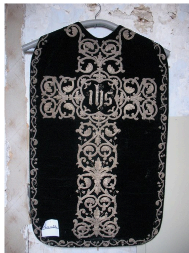
Chasuble : vue générale, dos