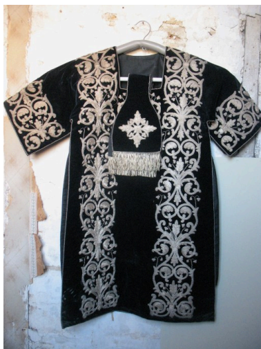
Dalmatique, étole : vue générale IVR31_20106204133NUCA