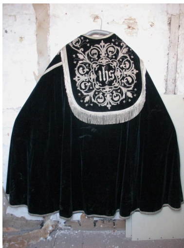
Chape : vue générale chape, dos IVR31_20106204122NUCA