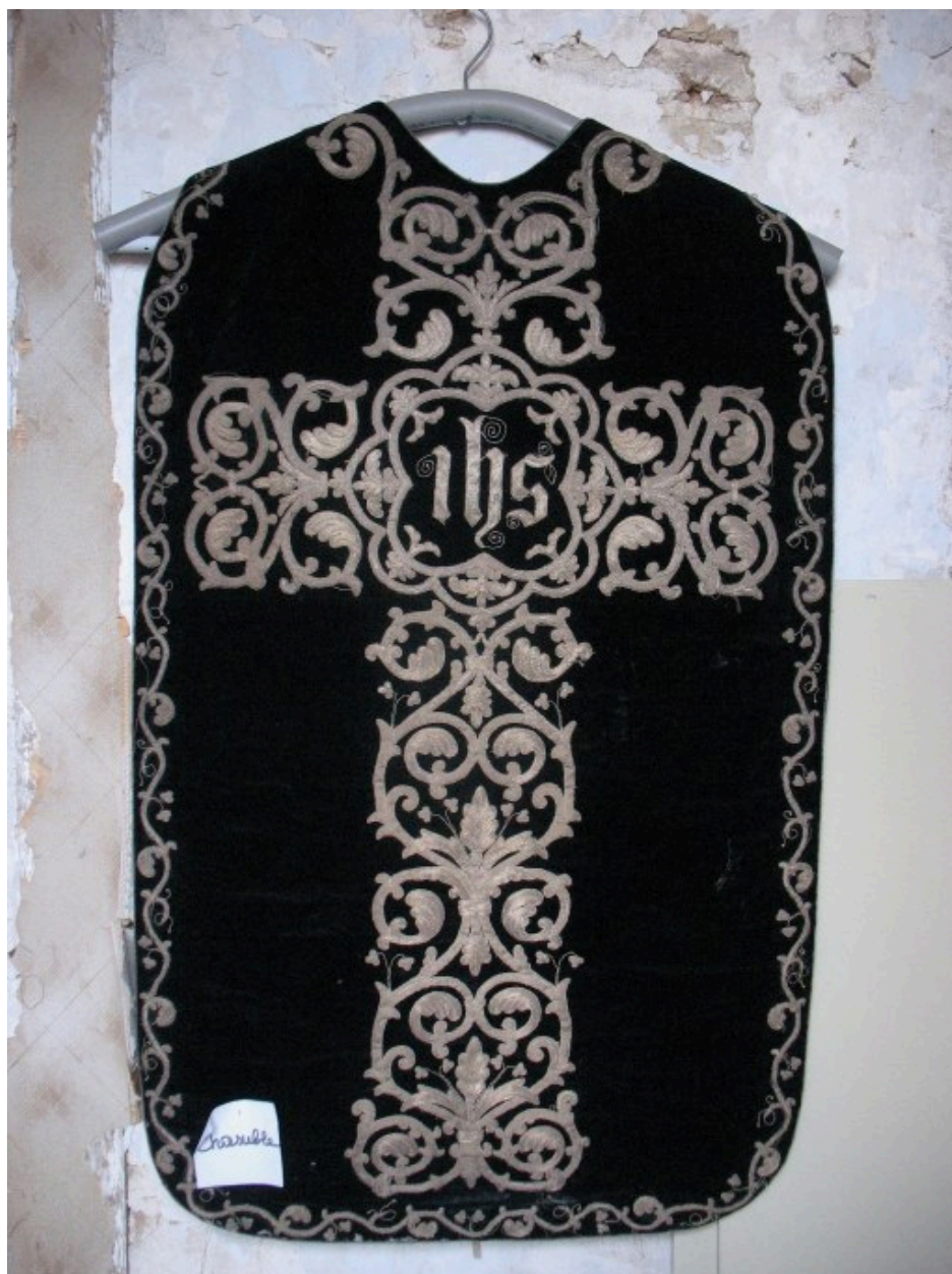
Chasuble : vue générale, dos