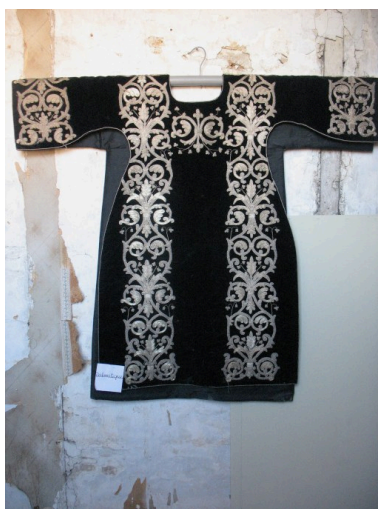
Dalmatique : vue générale, devant IVR31_20106204128NUCA