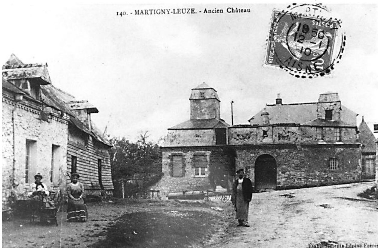
Vue de l'ancien presbytère détruit en 1940 (AP).