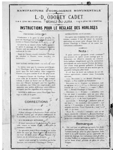
Instructions du fabricant. IVR22_19910201075X