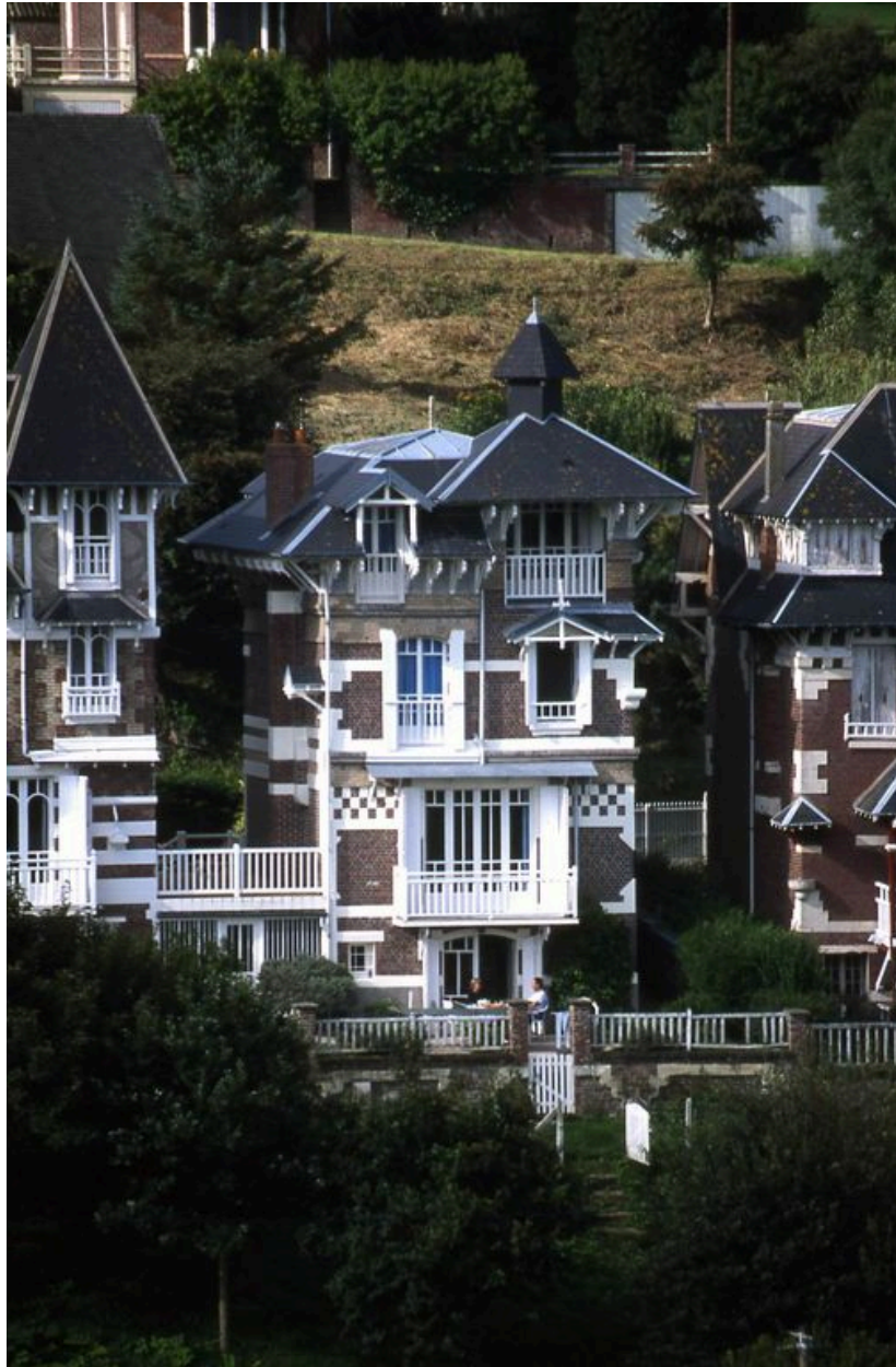
Elévation côté mer.