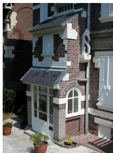
Détail du porche d'entrée.