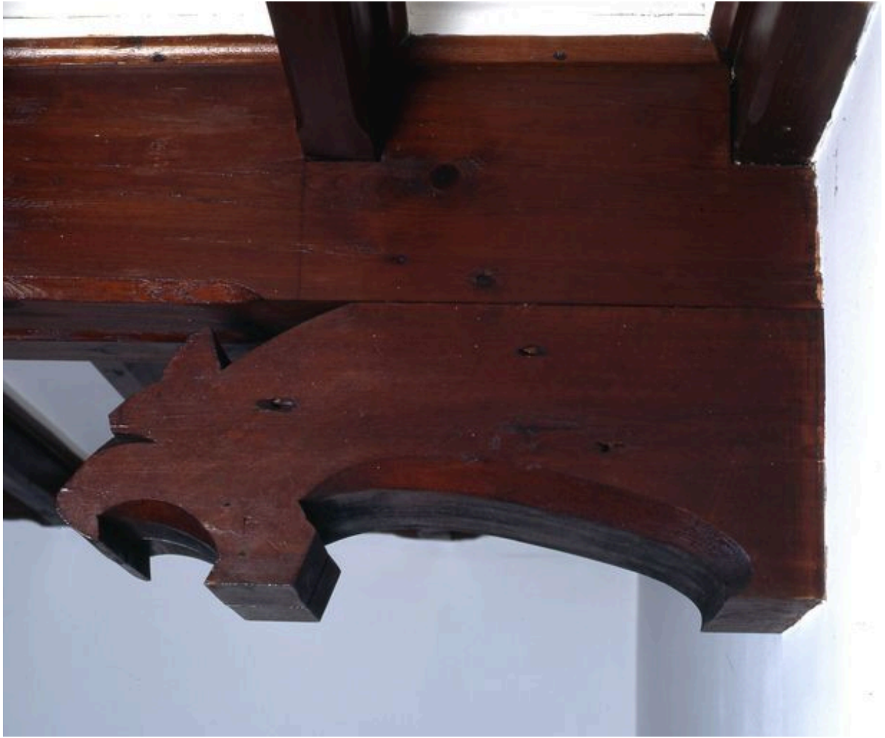
Détail d'une console décorative du 'hall' figurant un animal.