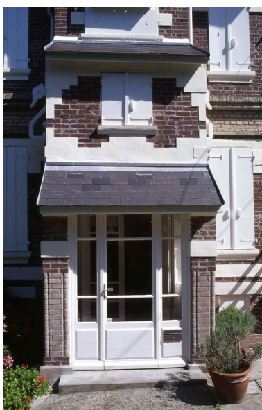
Détail du porche d'entrée.