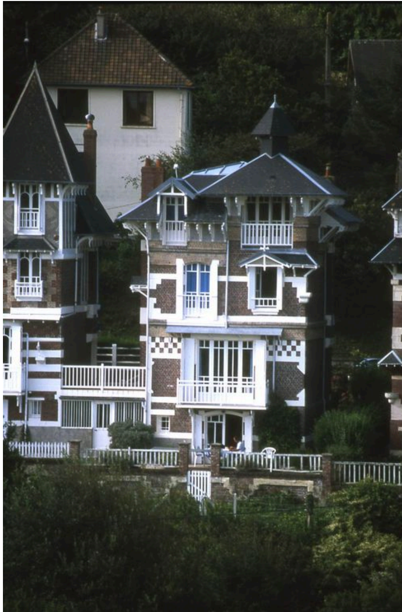
Elévation côté mer.