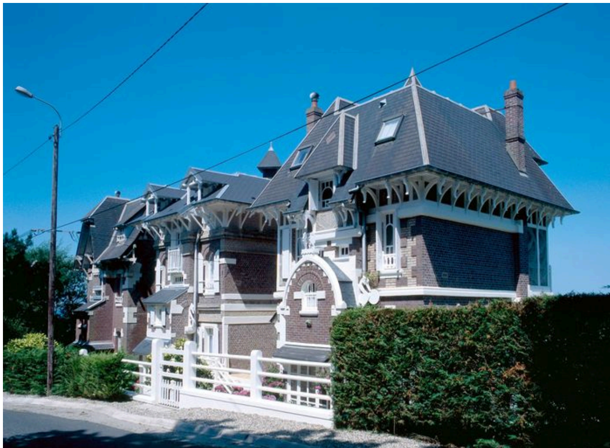
Vue d'ensemble des trois chalets, élévations postérieures.