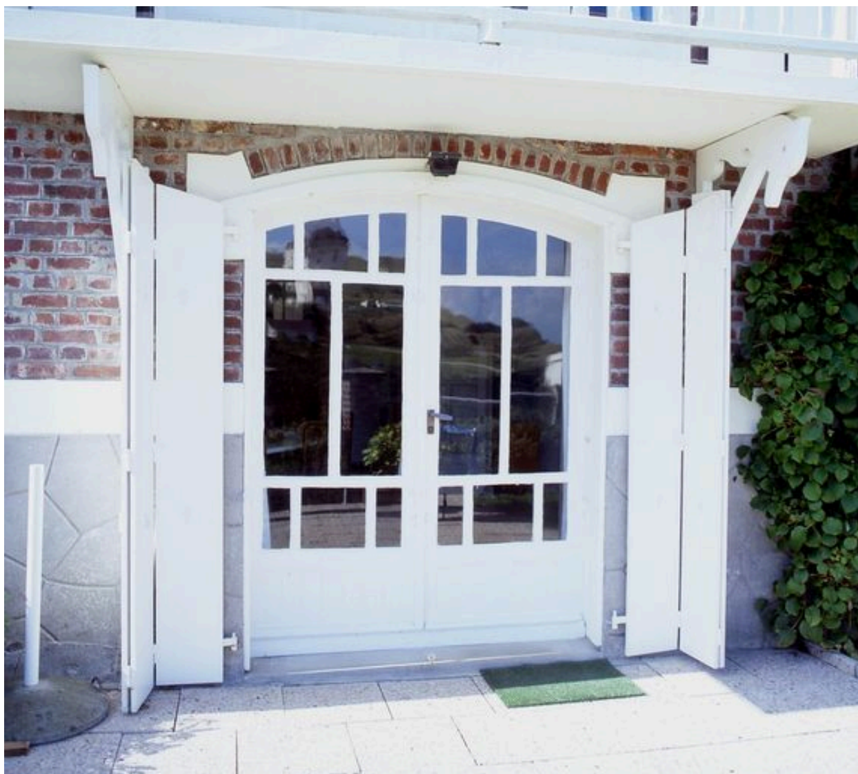
Détail de la baie donnant accès à l'étage de soubassement, côté mer.