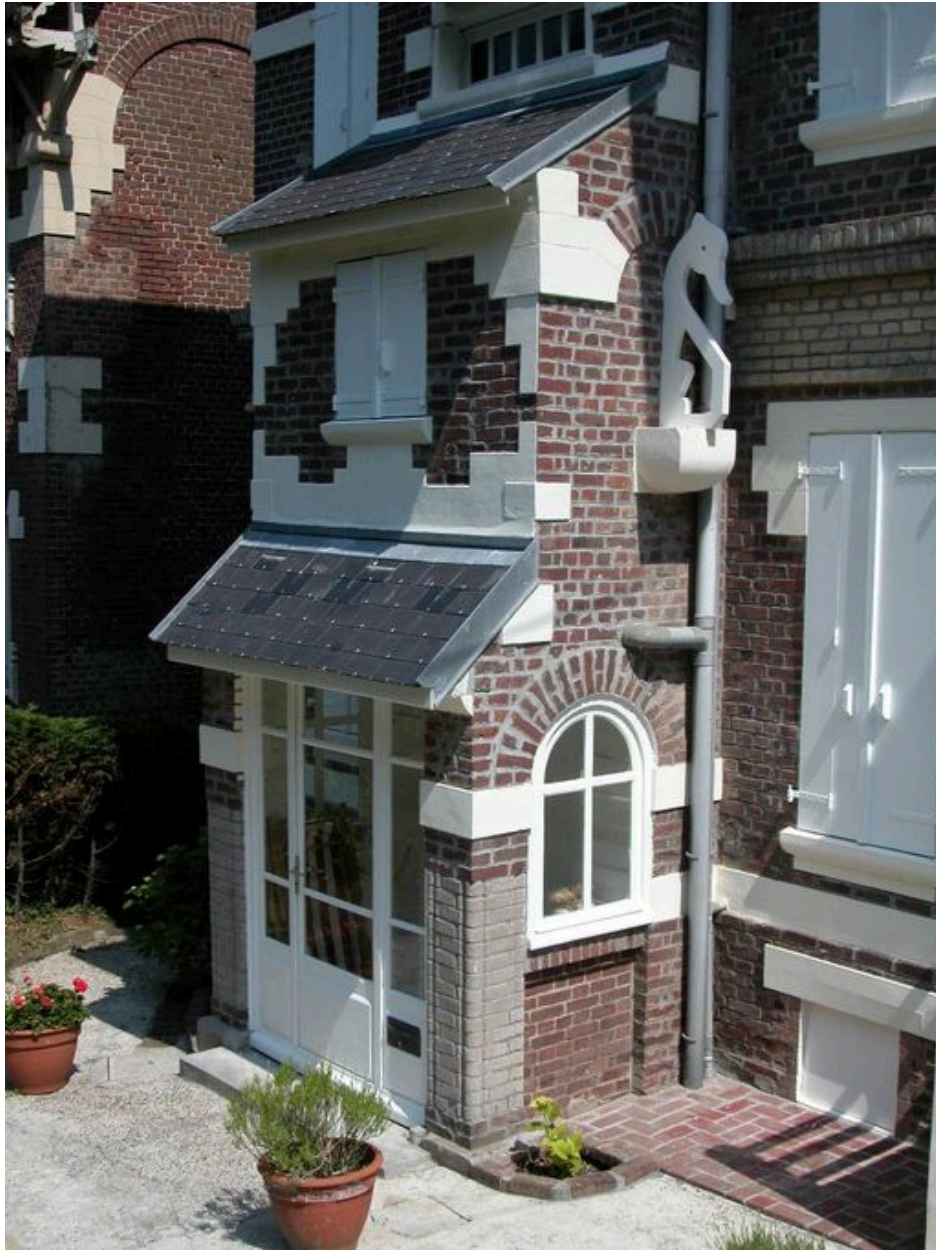
Détail du porche d'entrée.