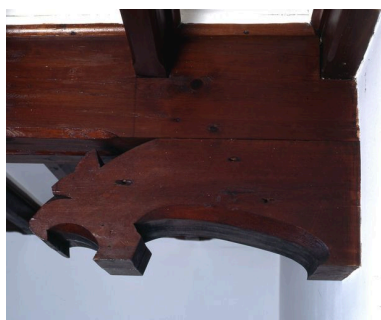
Détail d'une console décorative du 'hall' figurant un animal. IVR22_20058001738XA