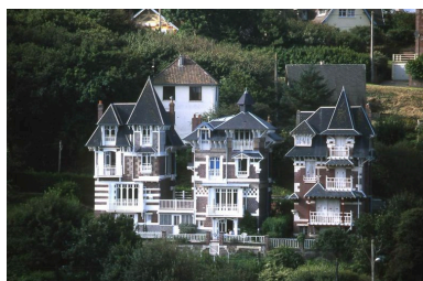
Vue générale des 'Trois chalets', avec Les Cormorans au centre. IVR22_20048000176ZA