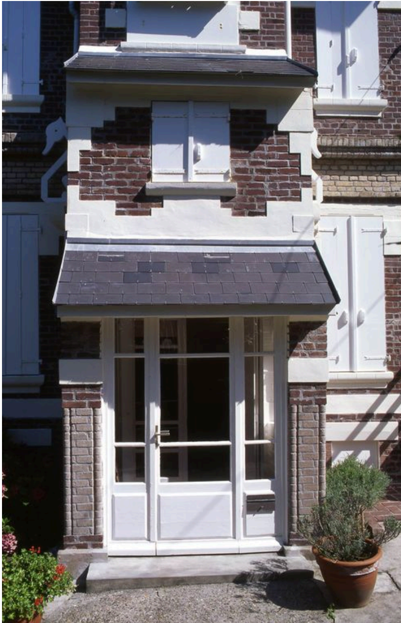
Détail du porche d'entrée.