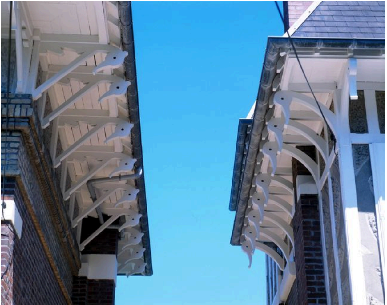
Détail des aisseliers en menuiserie.