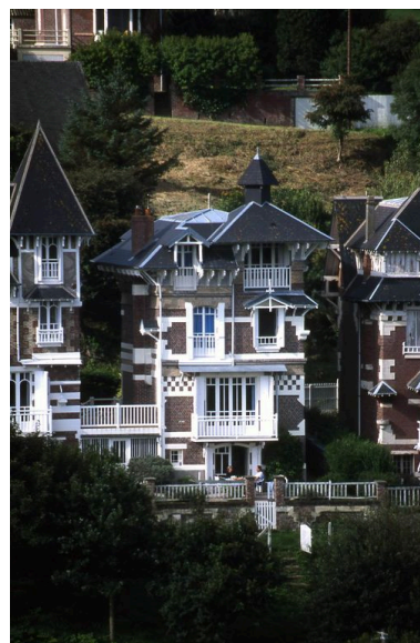
Elévation côté mer. IVR22_20048000179ZA