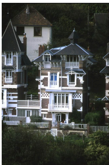
Elévation côté mer. IVR22_20048000180ZA