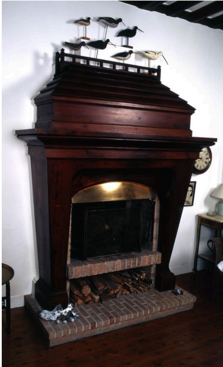
Cheminée du 'hall' ou pièce de réception.