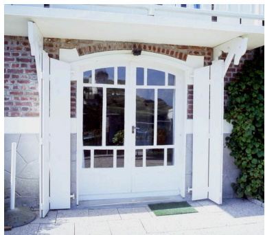
Détail de la baie donnant accès à l'étage de soubassement, côté mer.