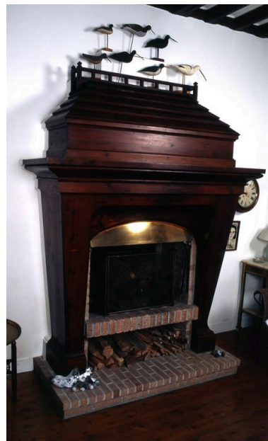
Cheminée du 'hall' ou pièce de réception. IVR22_20058001737XA