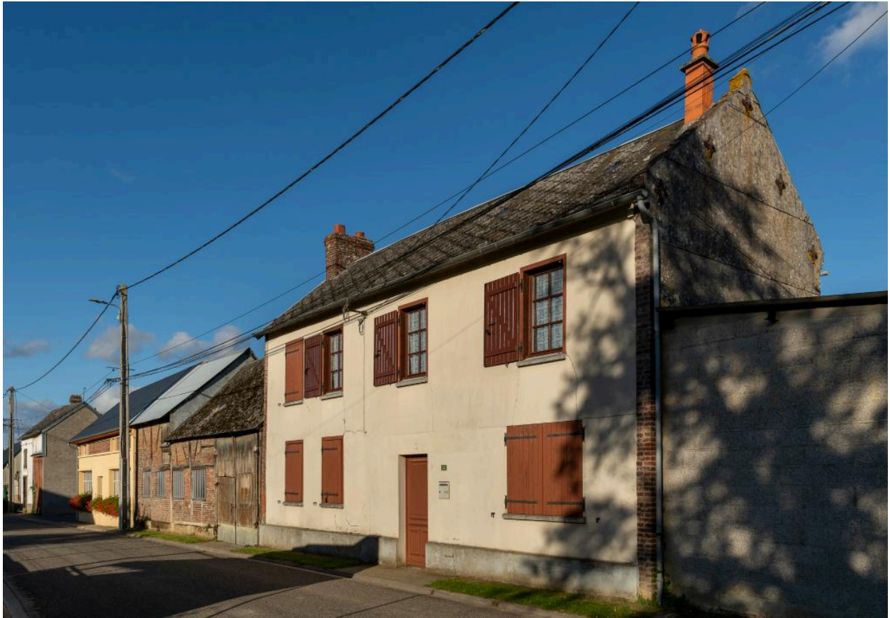
Ancien commerce et ateliers de serges (?), n°23 rue du Sac, vue depuis l'ouest.