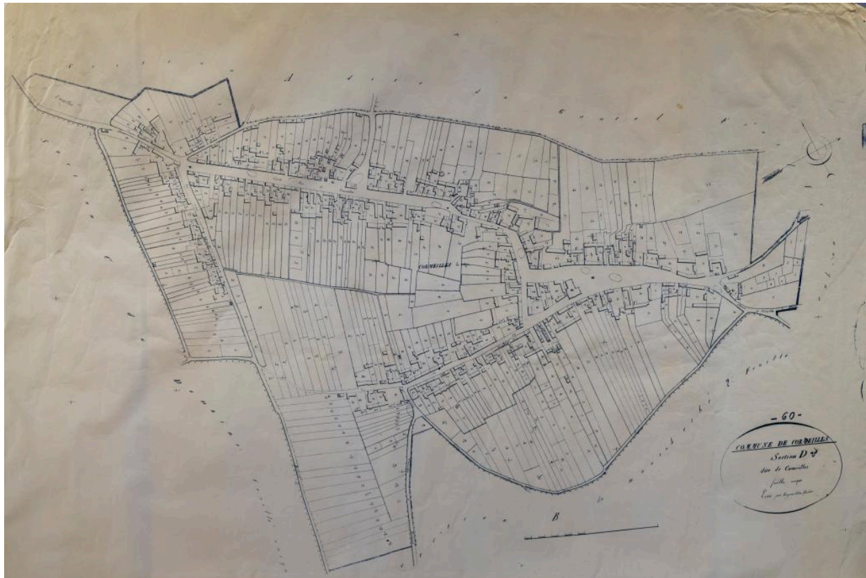
Cormeilles. Copie du plan cadastral du 2e tiers du 19e siècle, section D du village (coll. communale).