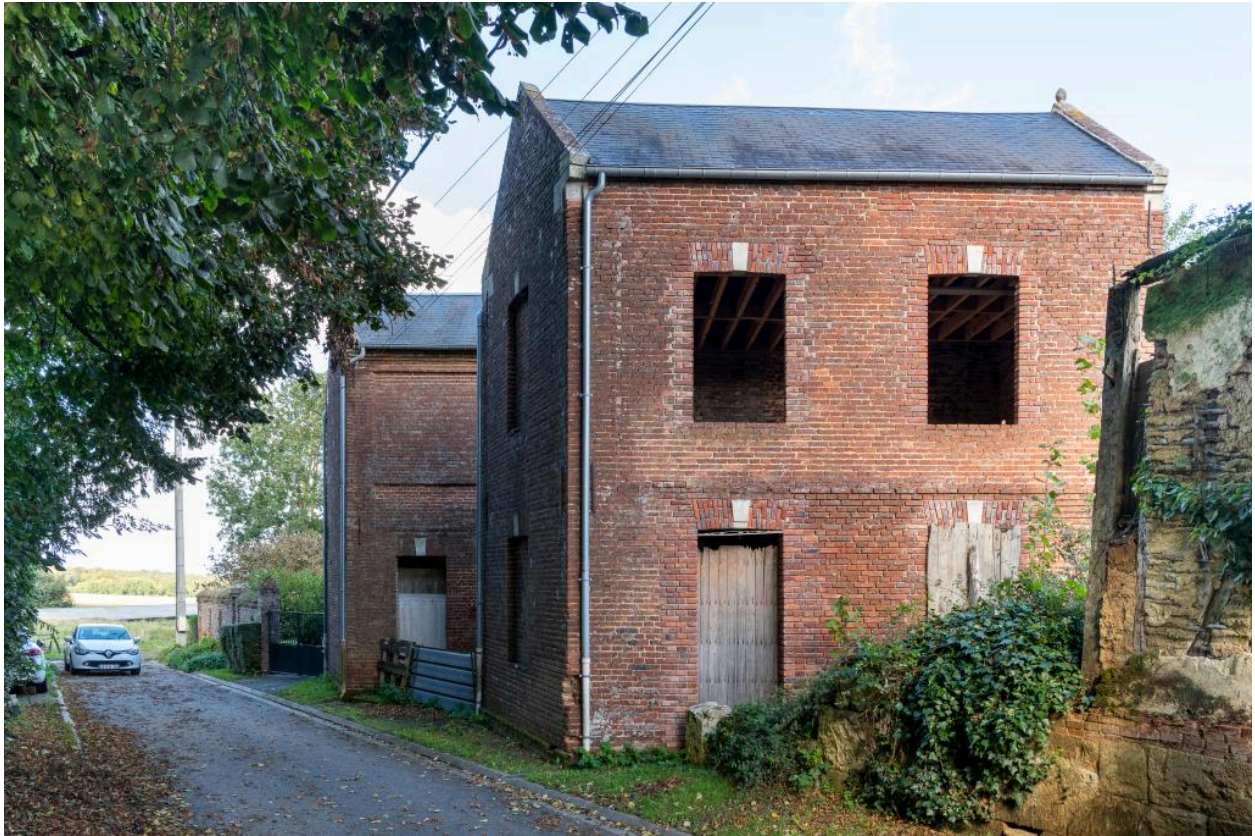
Anciens ateliers ou entrepôts de stockage d'un commerce, rue Fiscale, vue depuis le sud-ouest.