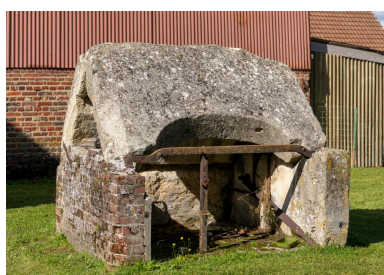
Ancien puits comblé, en face du n°30 Grande Rue, vue depuis le sud-est. IVR32_20216001004NUCA