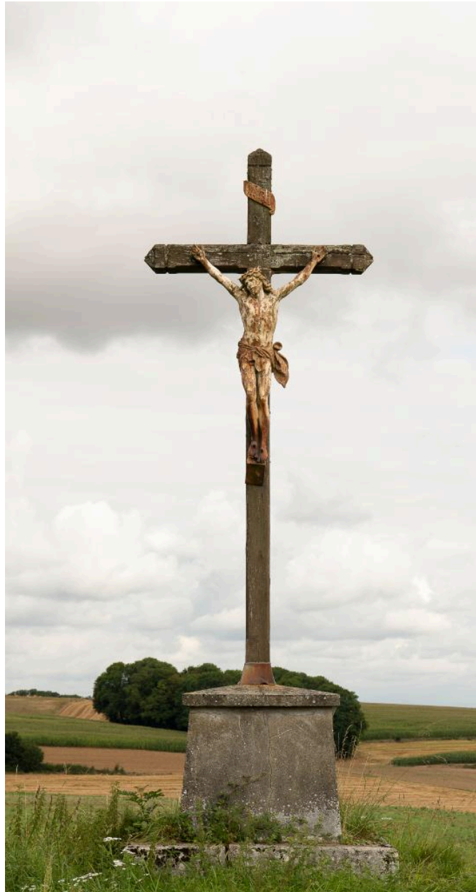
Croix de chemin au nord du village, sur le chemin du cimetière, vue depuis l'est.