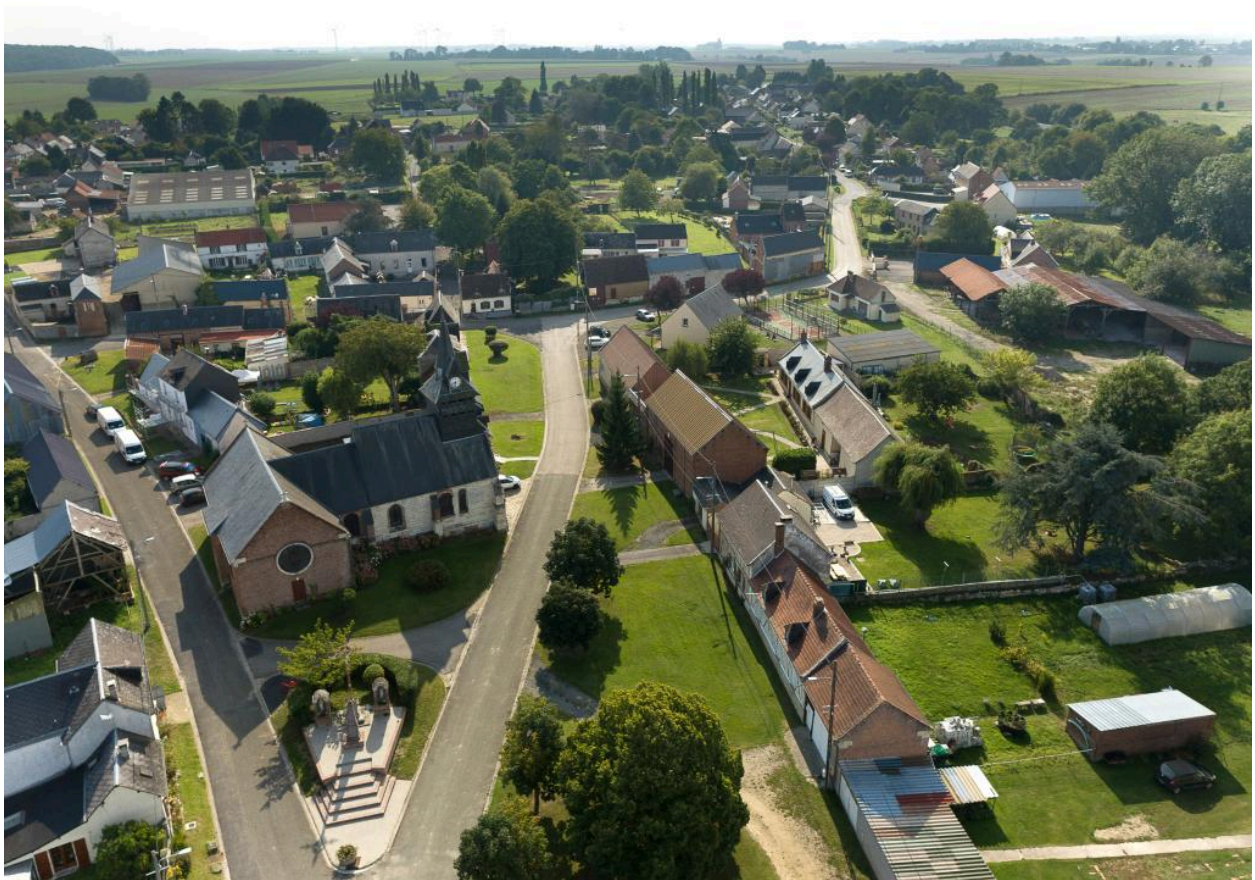
Vue du village depuis le nord-est.