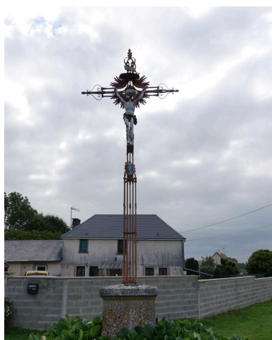
Croix de chemin rue de Breteuil, sortie est du village, vue depuis l'ouest.