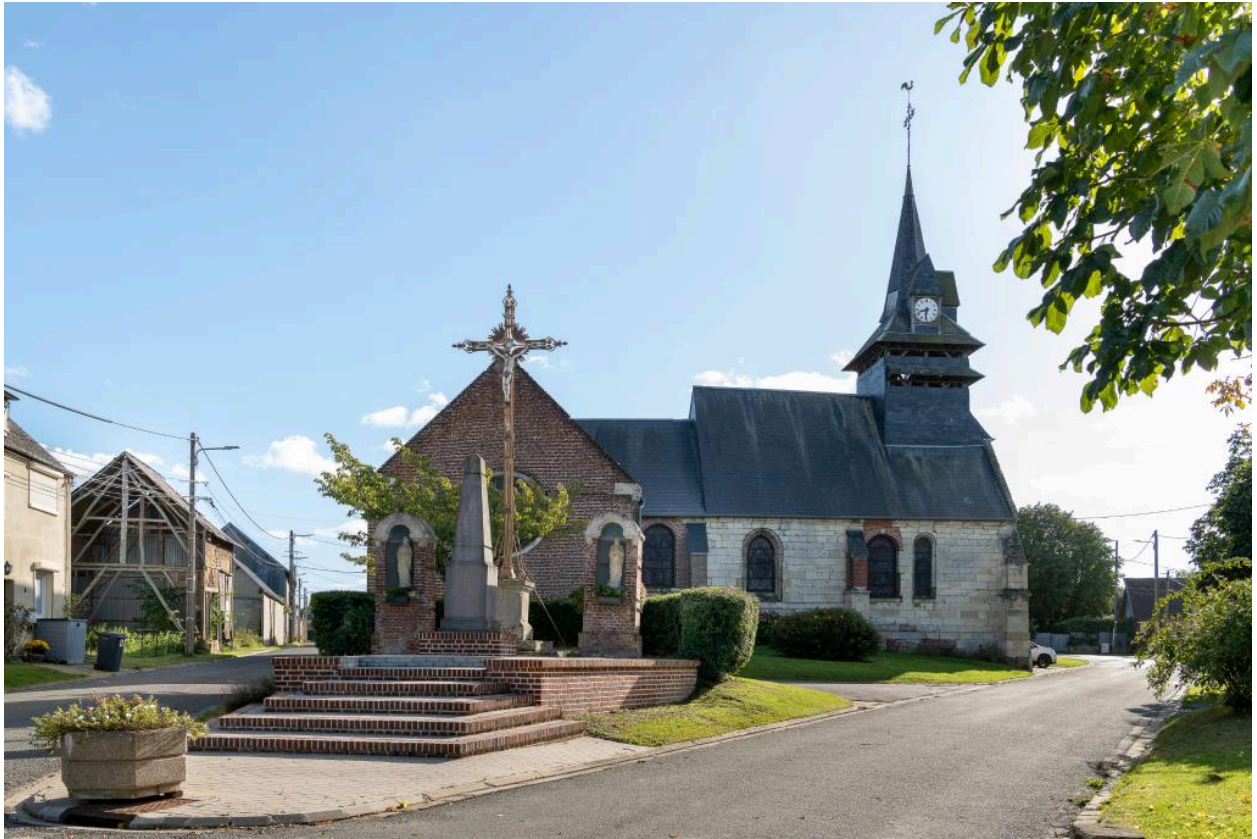
Vue générale depuis le nord de la place de l'église avec le calvaire et le monument aux morts.