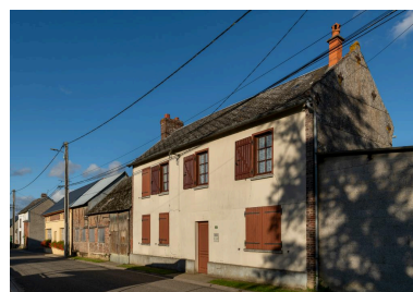
Ancien commerce et ateliers de serges (?), n°23 rue du Sac, vue depuis l'ouest. IVR32_20216001053NUCA