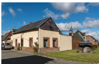
Ancien café n°1 rue de la Mairie, vue depuis l'est.