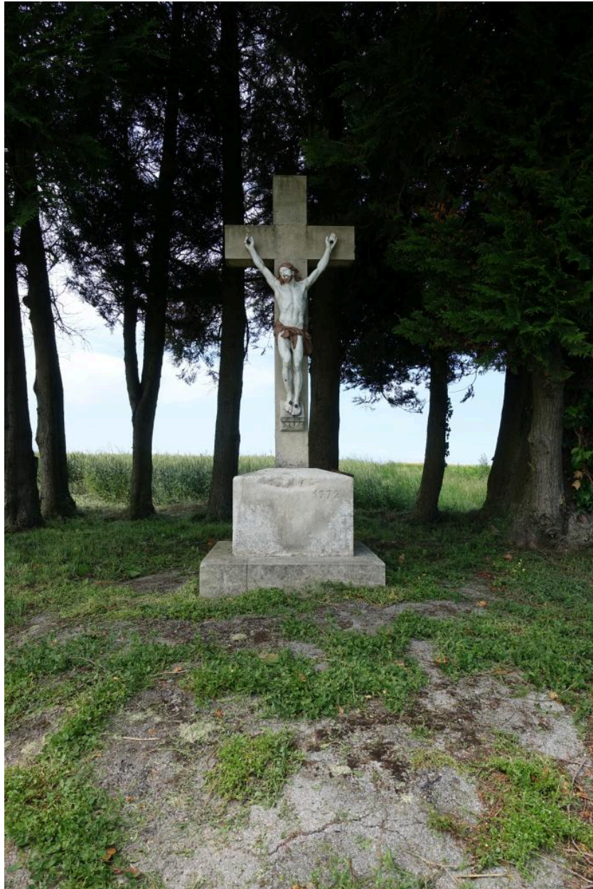
Croix de chemin rue du Crocq, vue depuis l'est.