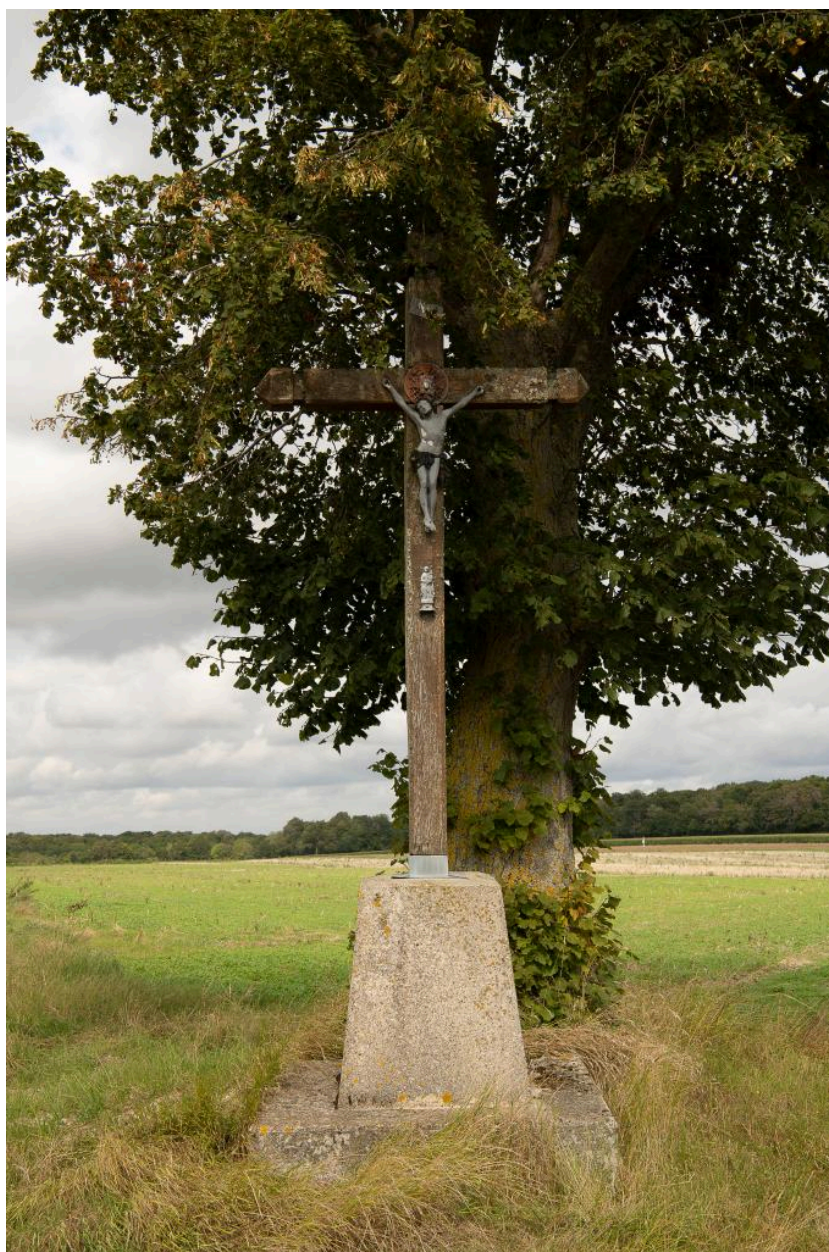
Croix de chemin entre la chapelle du Planton et le village, vue du sud-est.