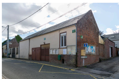
Ancienne mairie-école (aujourd'hui école), vue depuis le nord-ouest.