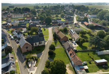
Vue du village depuis le nord-est.