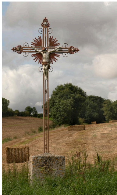
Croix de chemin à l'ouest du village, au bord de la D65, vue depuis le nord-est. IVR32_20216000909NUCA

IVR32_20216000908NUCA