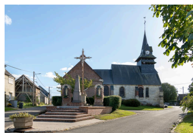
Vue générale depuis le nord de la place de l'église avec le calvaire et le monument aux morts.