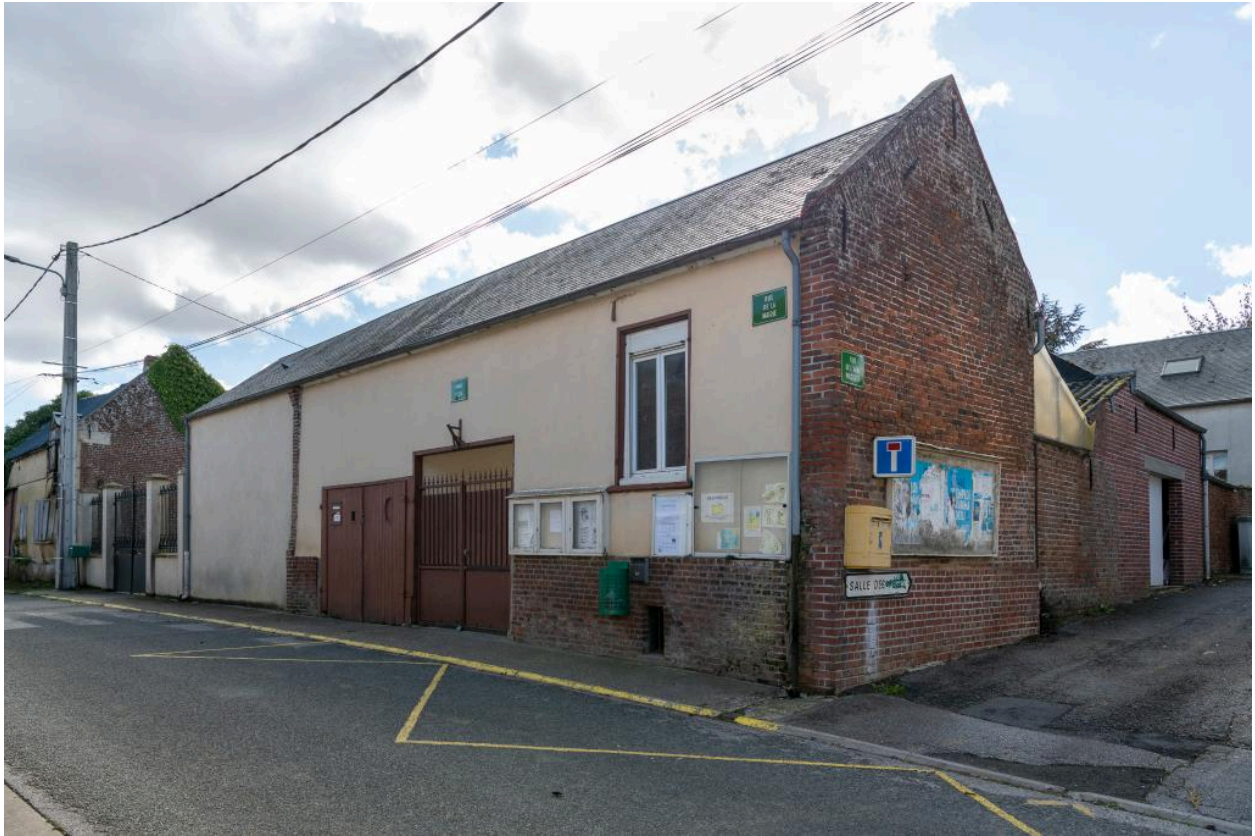
Ancienne mairie-école (aujourd'hui école), vue depuis le nord-ouest.