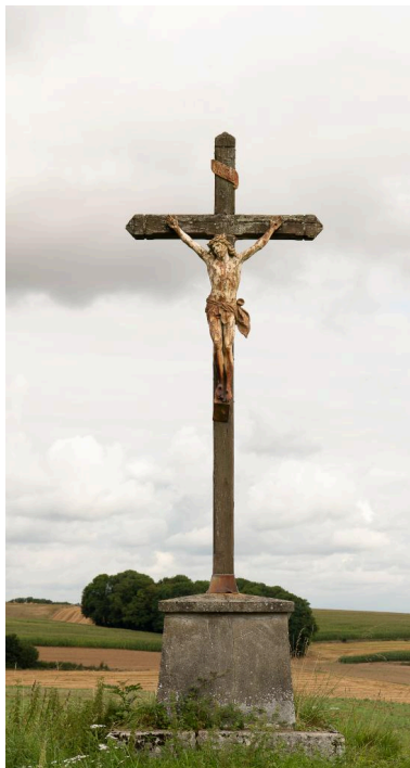
Croix de chemin au nord du village, sur le chemin du cimetière, vue depuis l'est. IVR32_20216000910NUCA