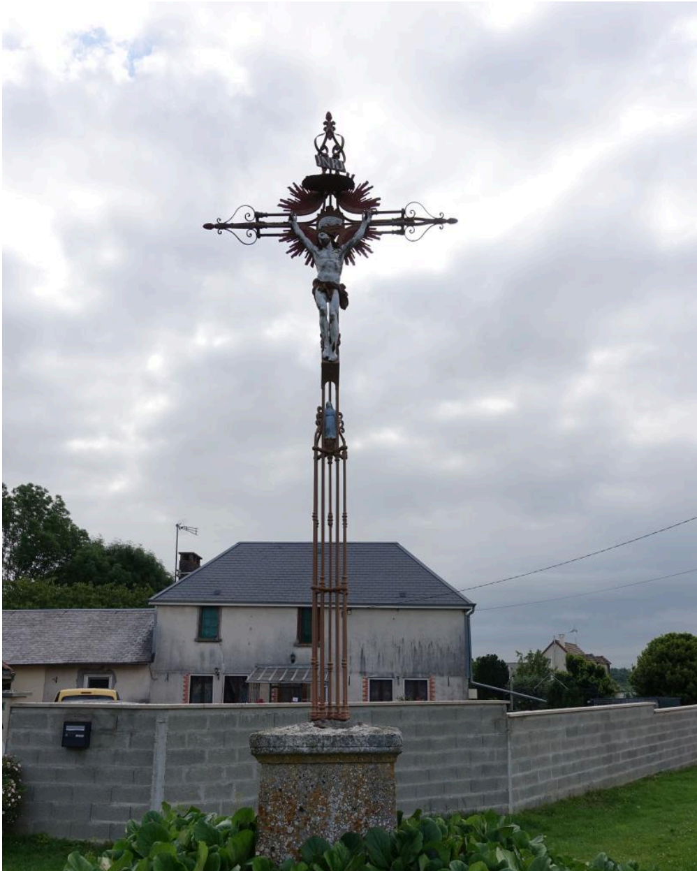
Croix de chemin rue de Breteuil, sortie est du village, vue depuis l'ouest.