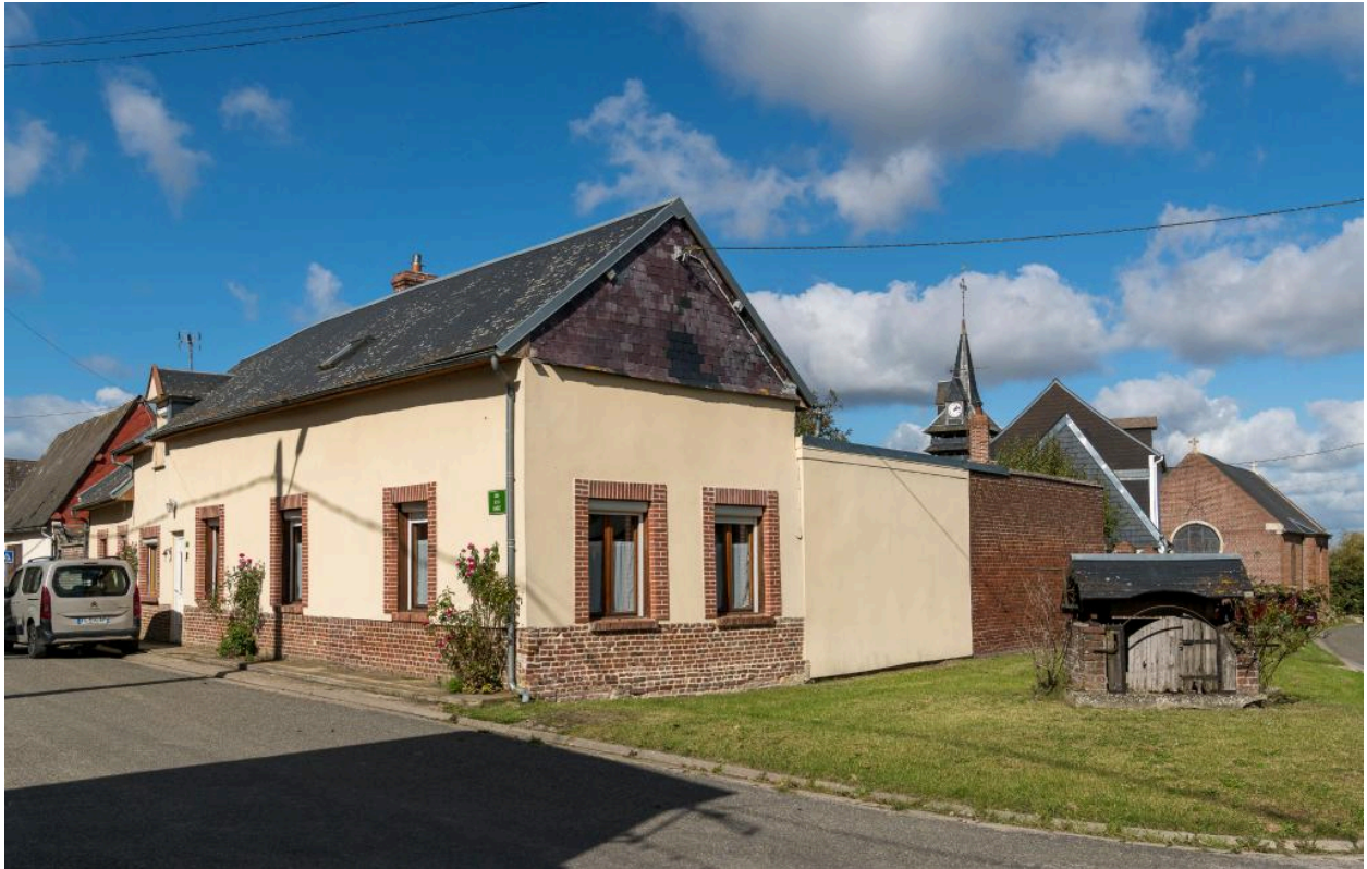
Ancien café n°1 rue de la Mairie, vue depuis l'est.