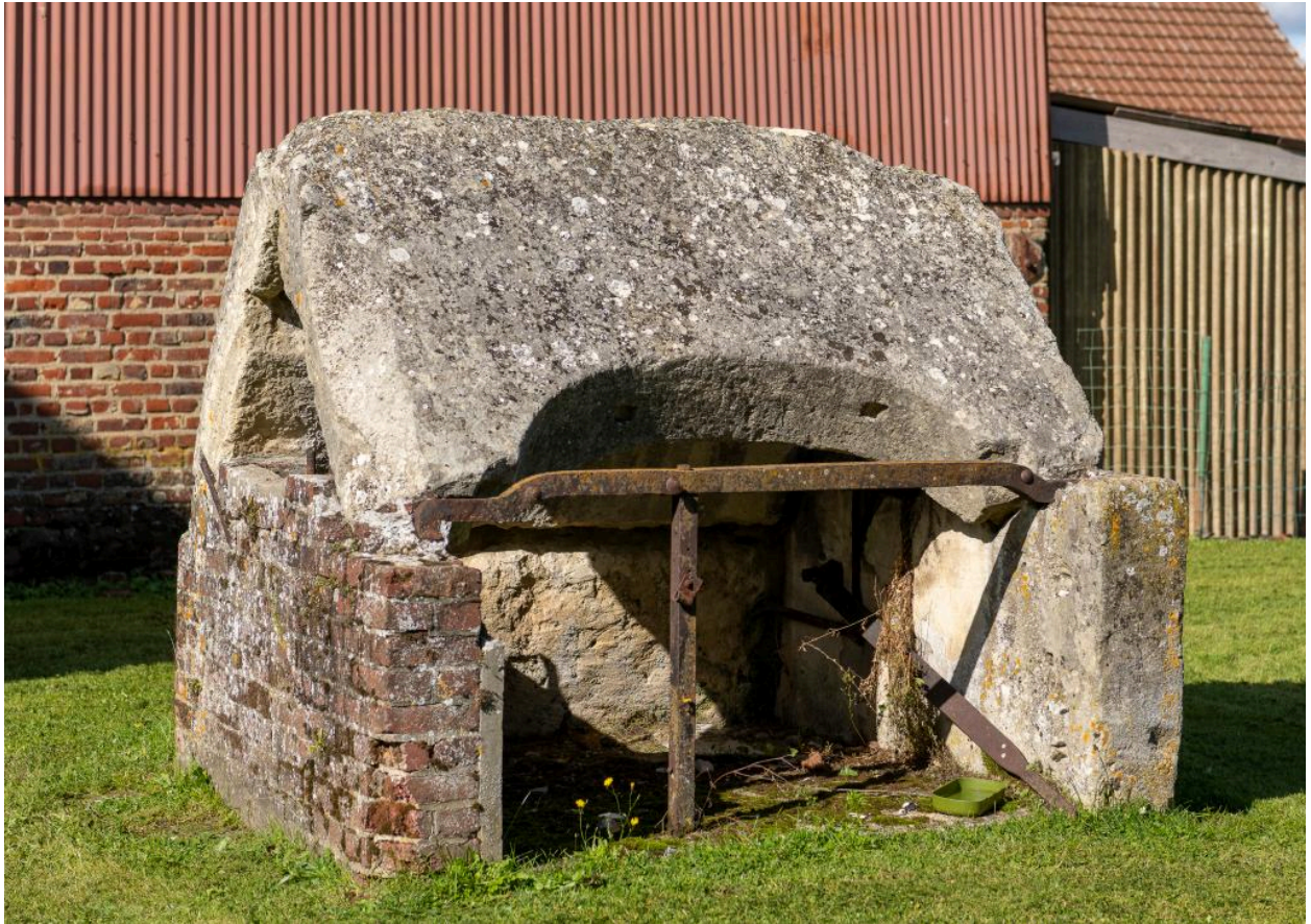
Ancien puits comblé, en face du n°30 Grande Rue, vue depuis le sud-est.