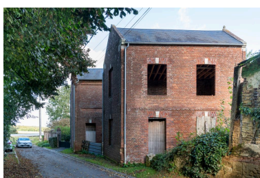
Anciens ateliers ou entrepôts de stockage d'un commerce, rue Fiscale, vue depuis le sud-ouest.