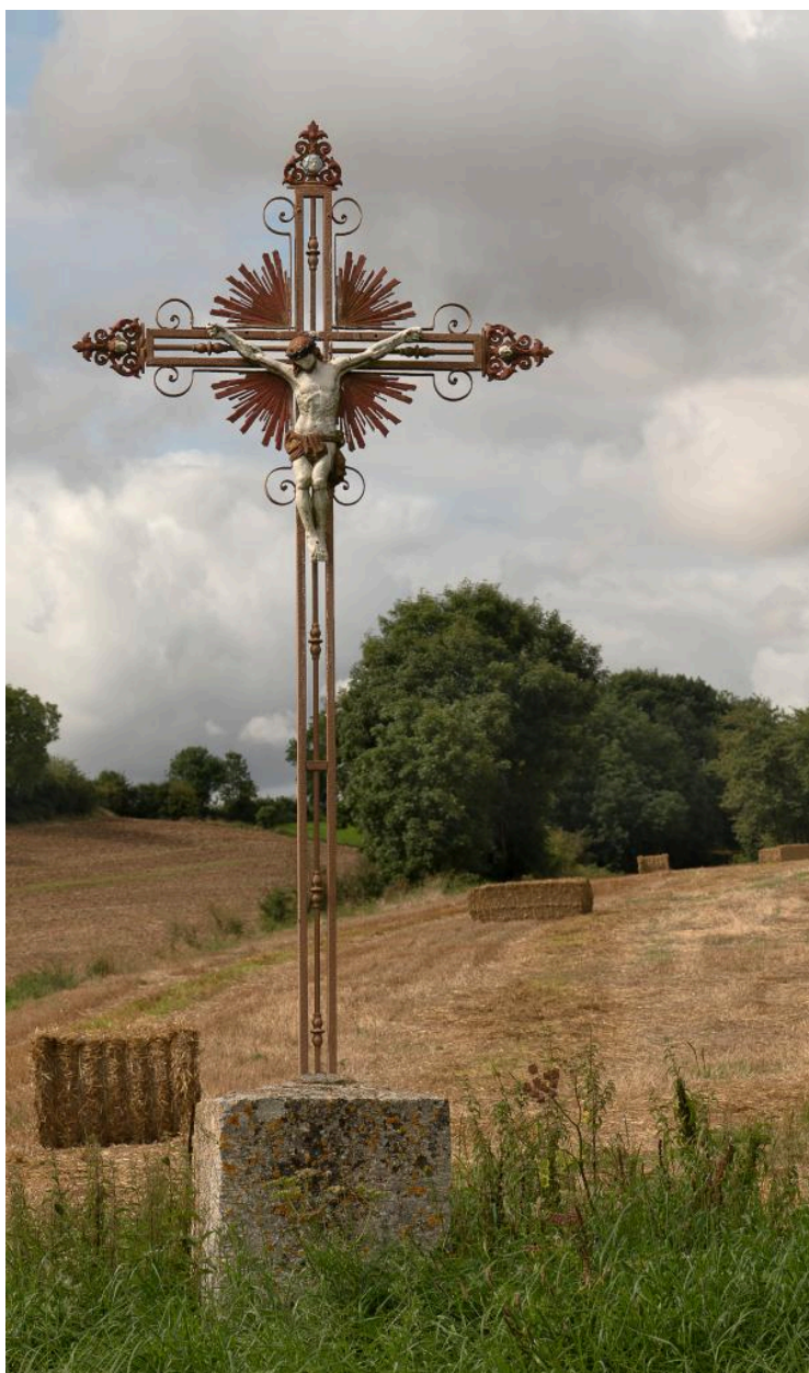
Croix de chemin à l'ouest du village, au bord de la D65, vue depuis le nord-est.