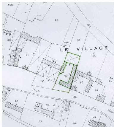
Plan de situation. Extrait du plan cadastral de 1978, section AB 62.