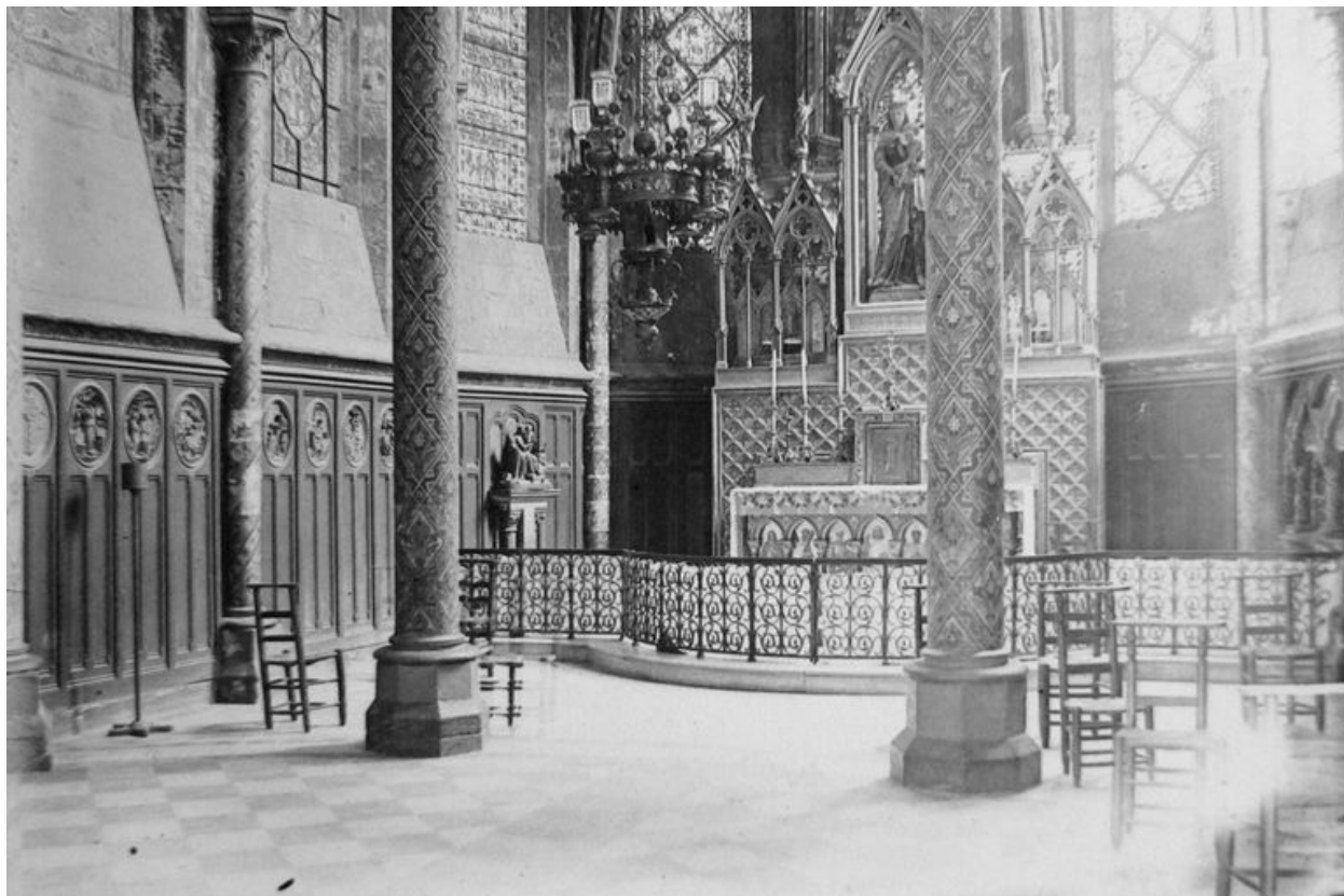
Détail d'une vue intérieure de la chapelle axiale, par Félix Martin-Sabon, vers 1900 (AMH, Médiathèque du Patrimoine : 96/25/31).