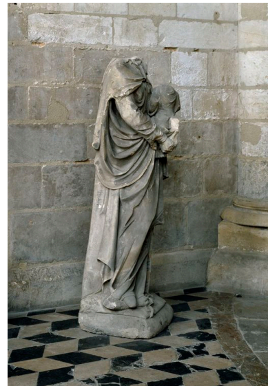
Vue de trois-quarts. IVR22_20090200207XA