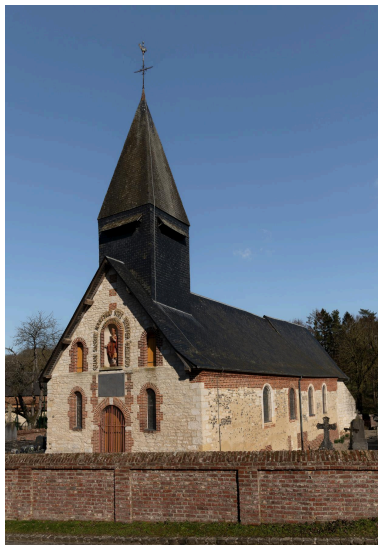
Vue générale de l'église depuis le sud-ouest. IVR32_20236000161NUCA