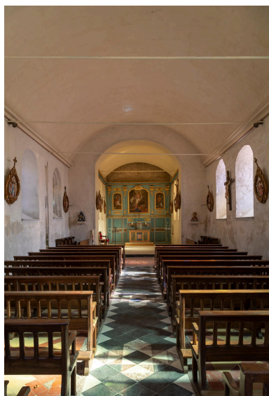
Vue intérieure vers le chœur. IVR32_20236000156NUCA