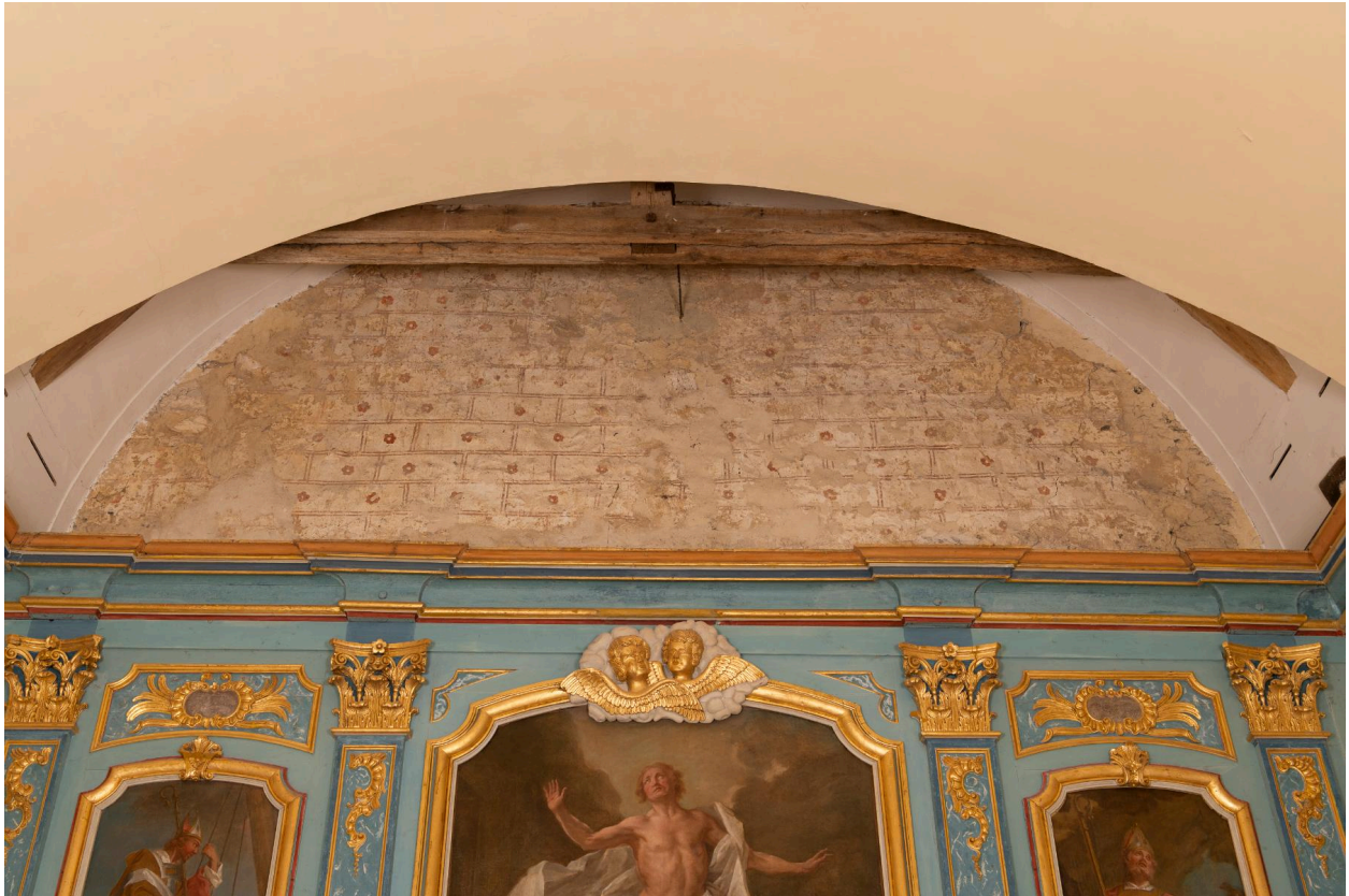
Peintures murales au-dessus du maître-autel.