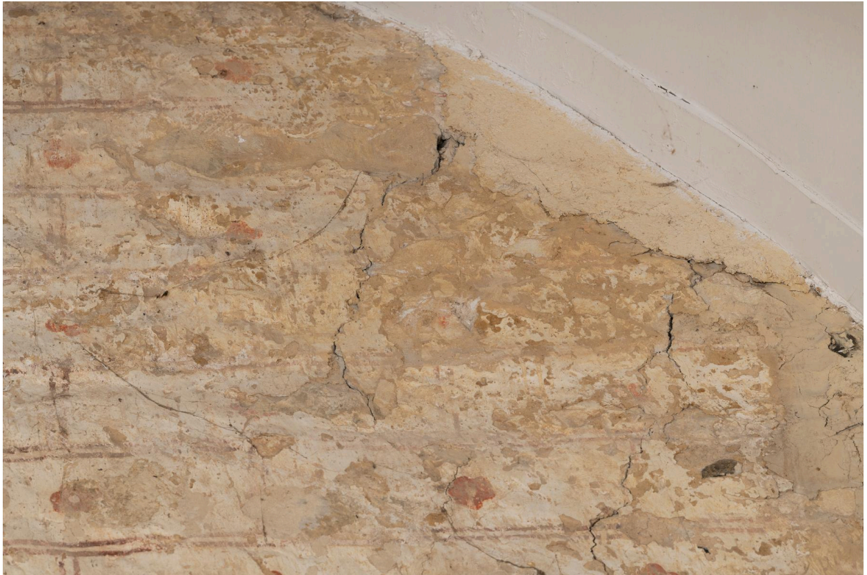
Détail : peintures murales au-dessus du maître-autel.