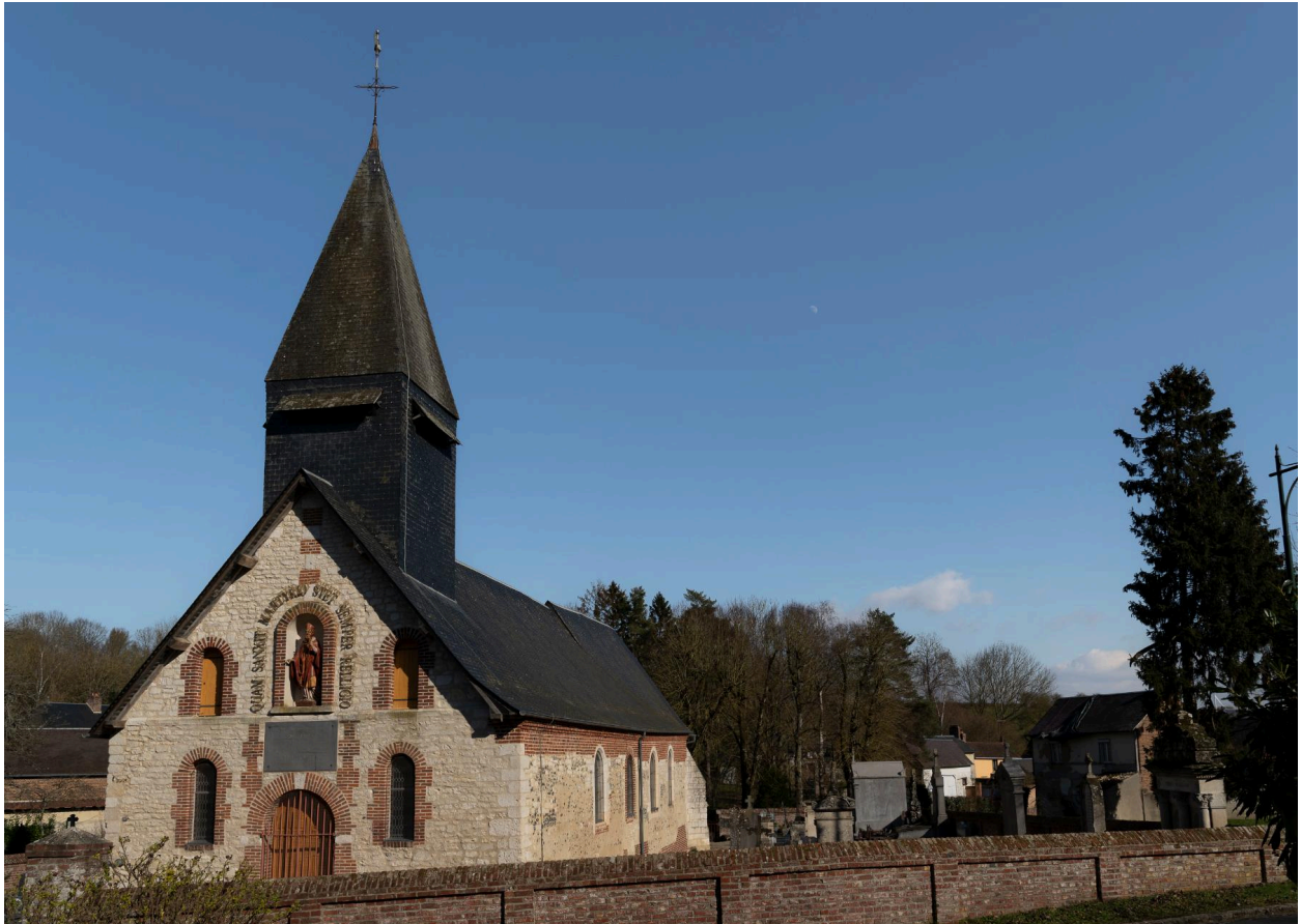
Vue générale de l'église et son cimetière depuis le sud-ouest.