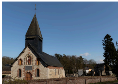
Vue générale de l'église et son cimetière depuis le sud-ouest.