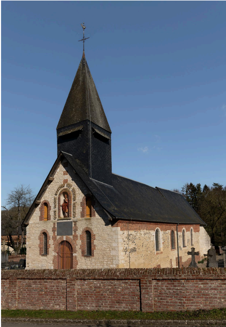
Vue générale de l'église depuis le sud-ouest.