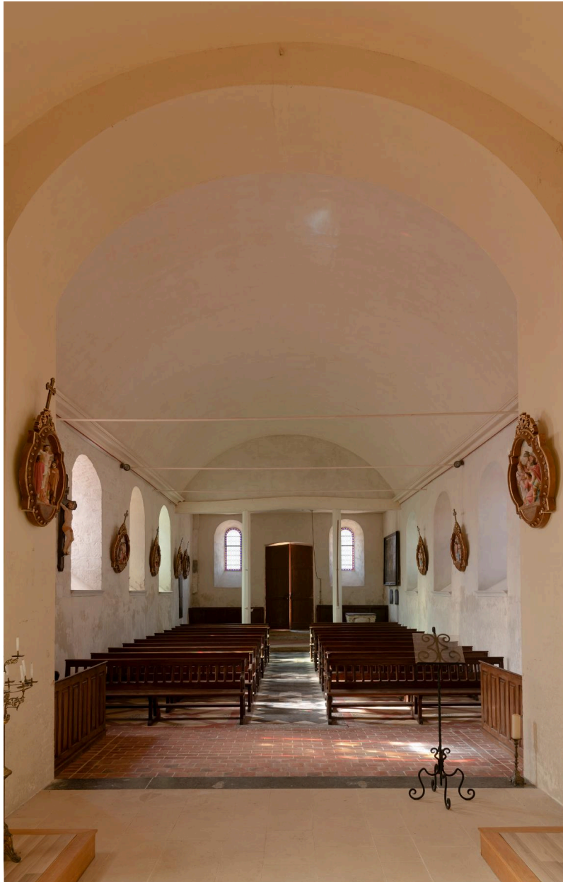
Vue intérieure vers la nef.