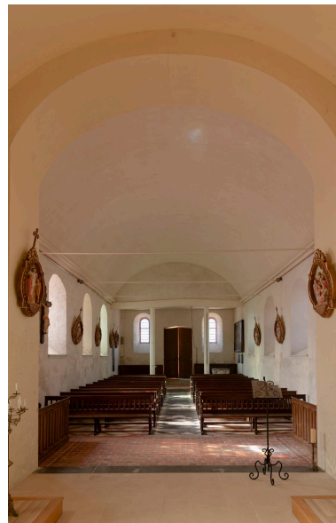
Vue intérieure vers la nef.