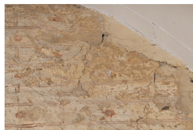
Détail : peintures murales au-dessus du maître-autel.