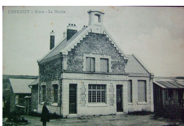
Vue de la mairie juste après sa reconstruction (coll. part).