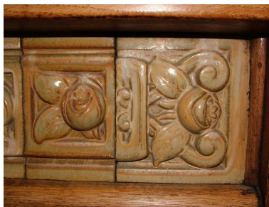
Détail du décor de la cheminée. IVR22_20050200657NUCA