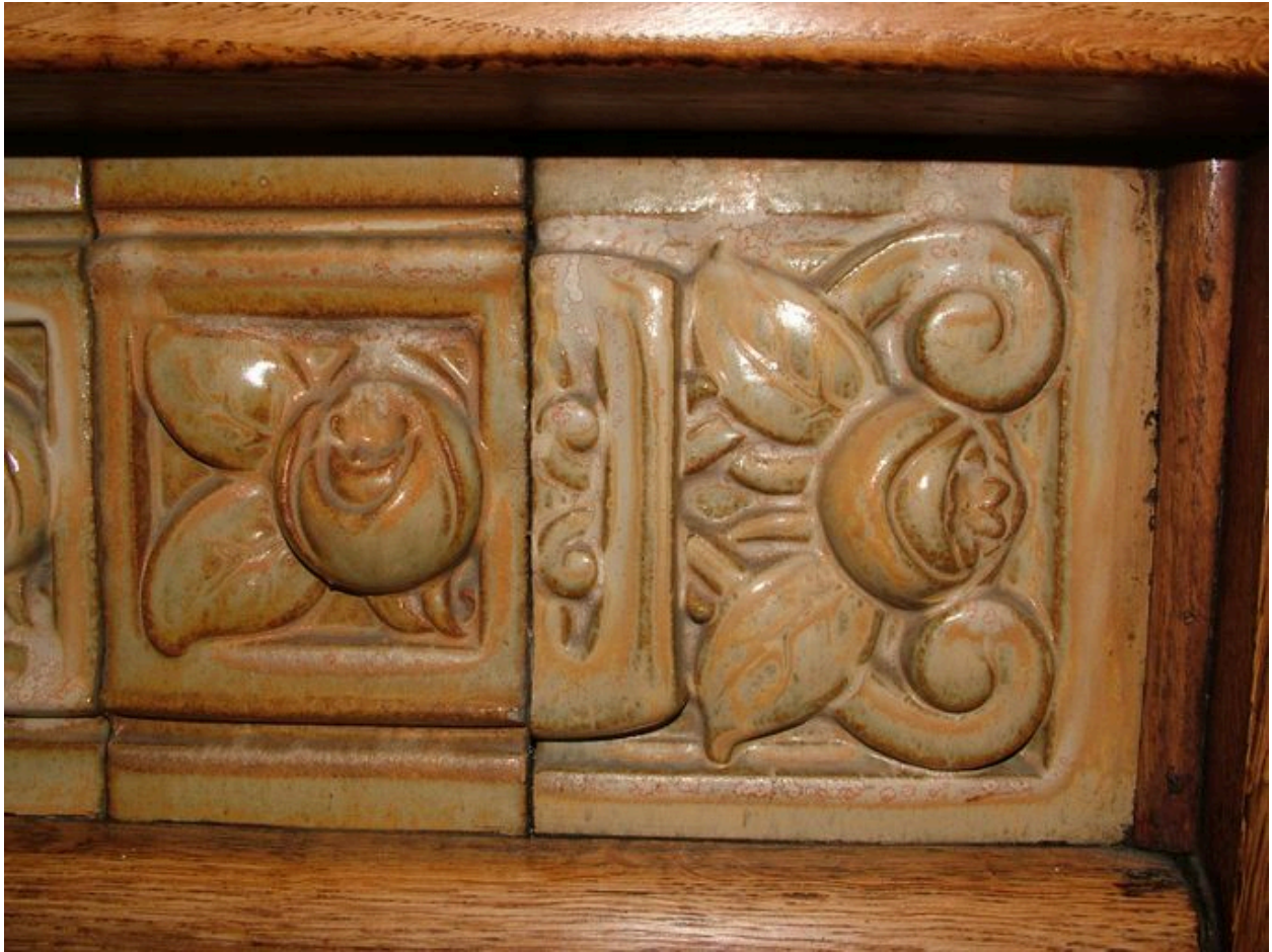
Détail du décor de la cheminée.