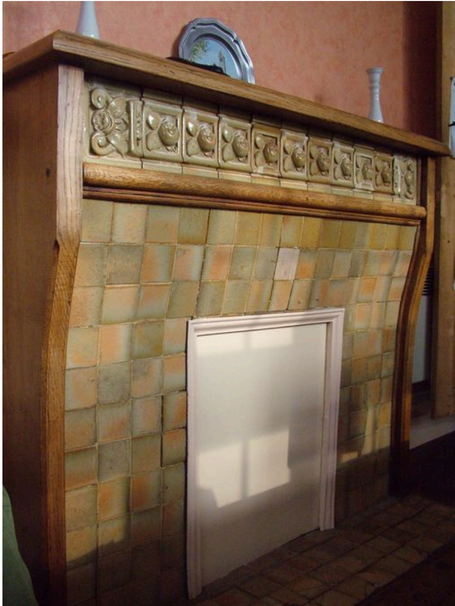
Vue de la cheminée de la salle de mairie.