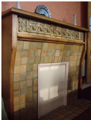
Vue de la cheminée de la salle de mairie. IVR22_20030203290NUCA