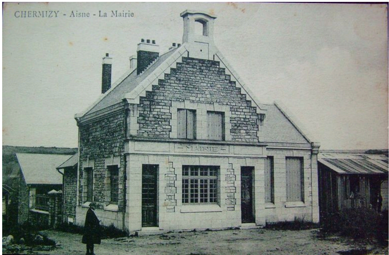
Vue de la mairie juste après sa reconstruction (coll. part).