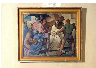
Station IV : la rencontre avec Marie.