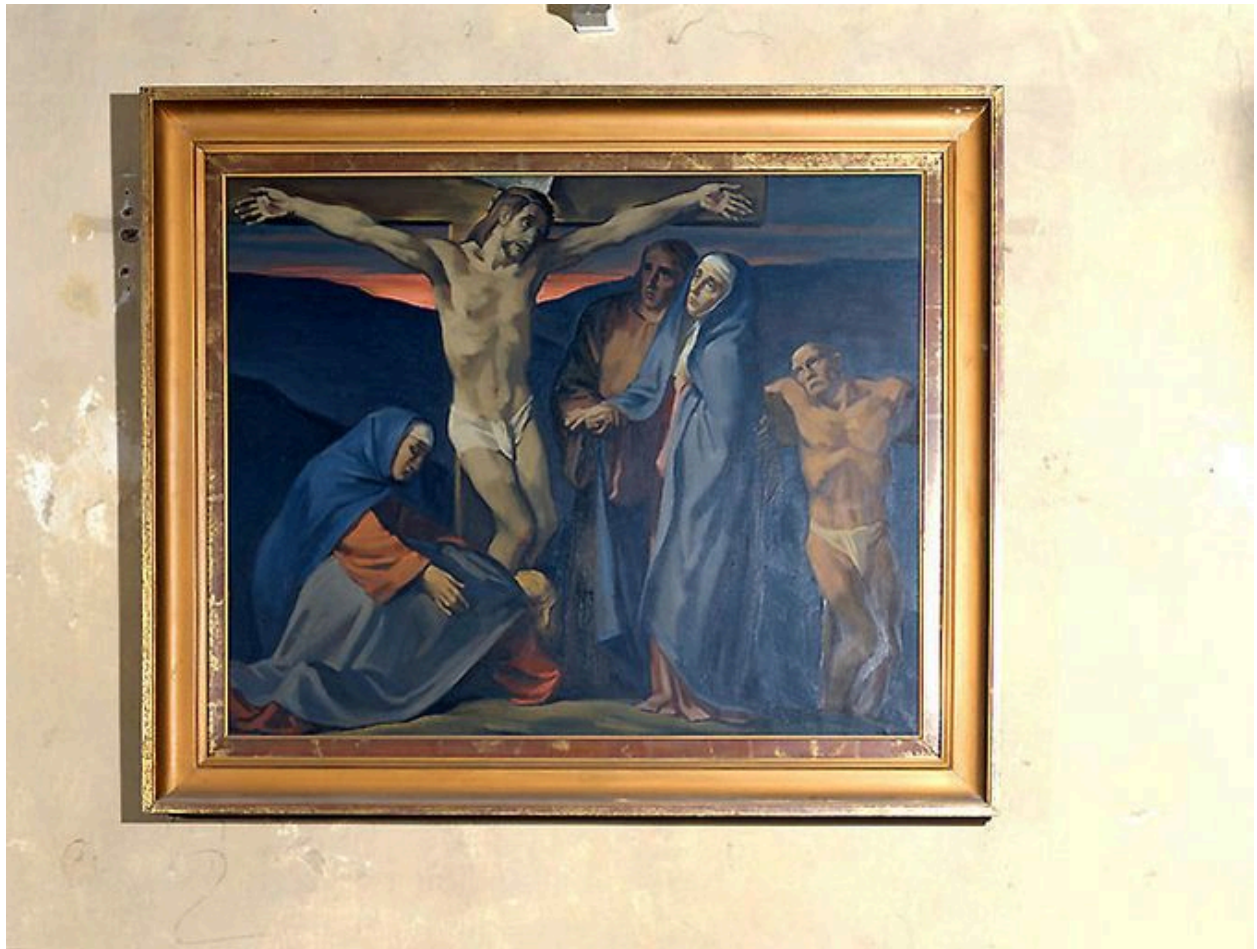
Station XII : Jésus sur la croix.