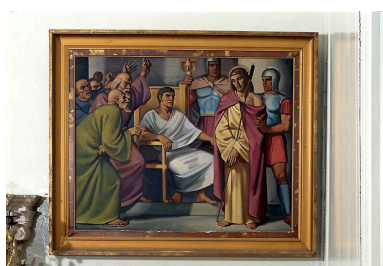
Station I : Jésus devant Pilate. IVR22_19980200904XA