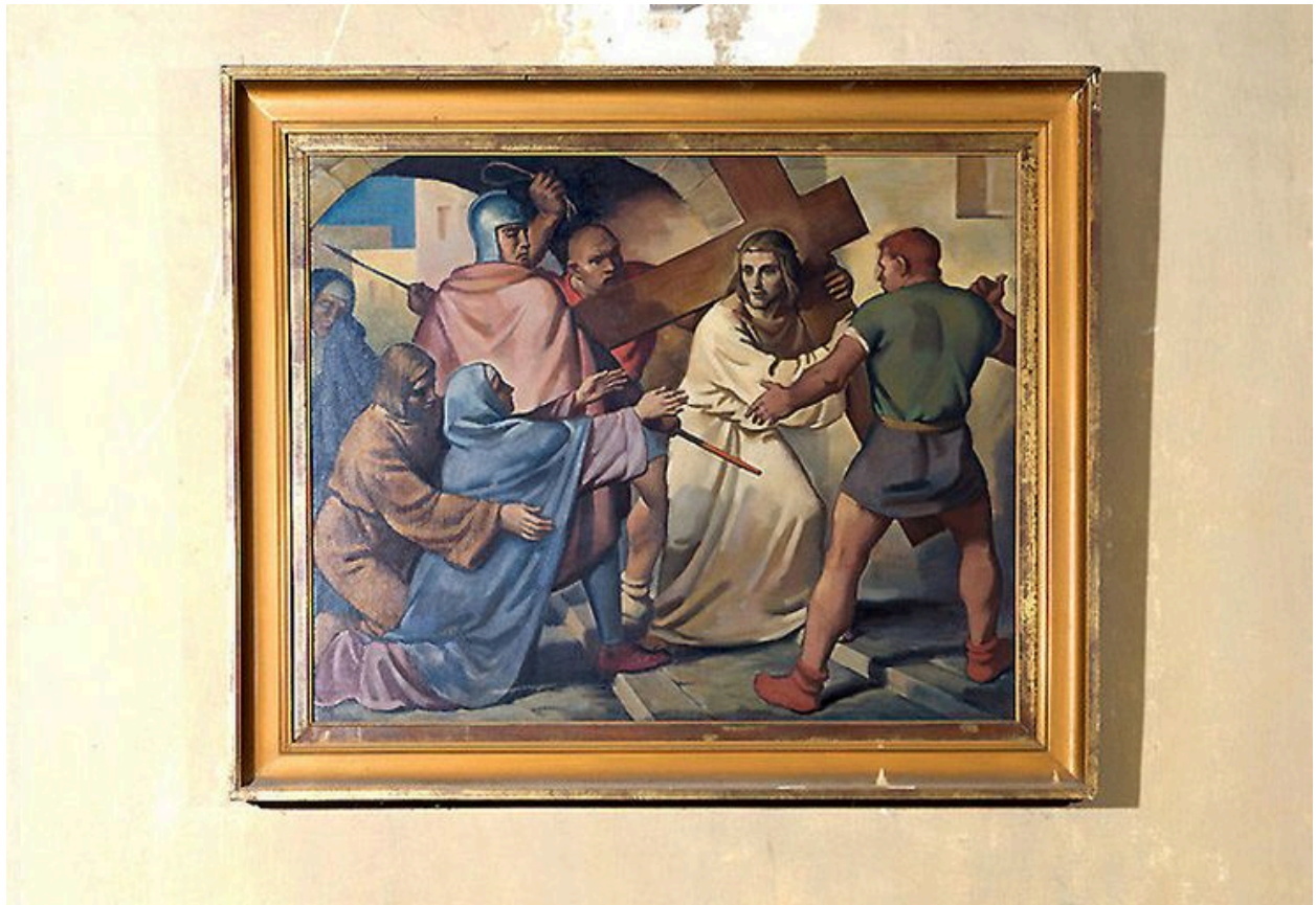
Station IV : la rencontre avec Marie.