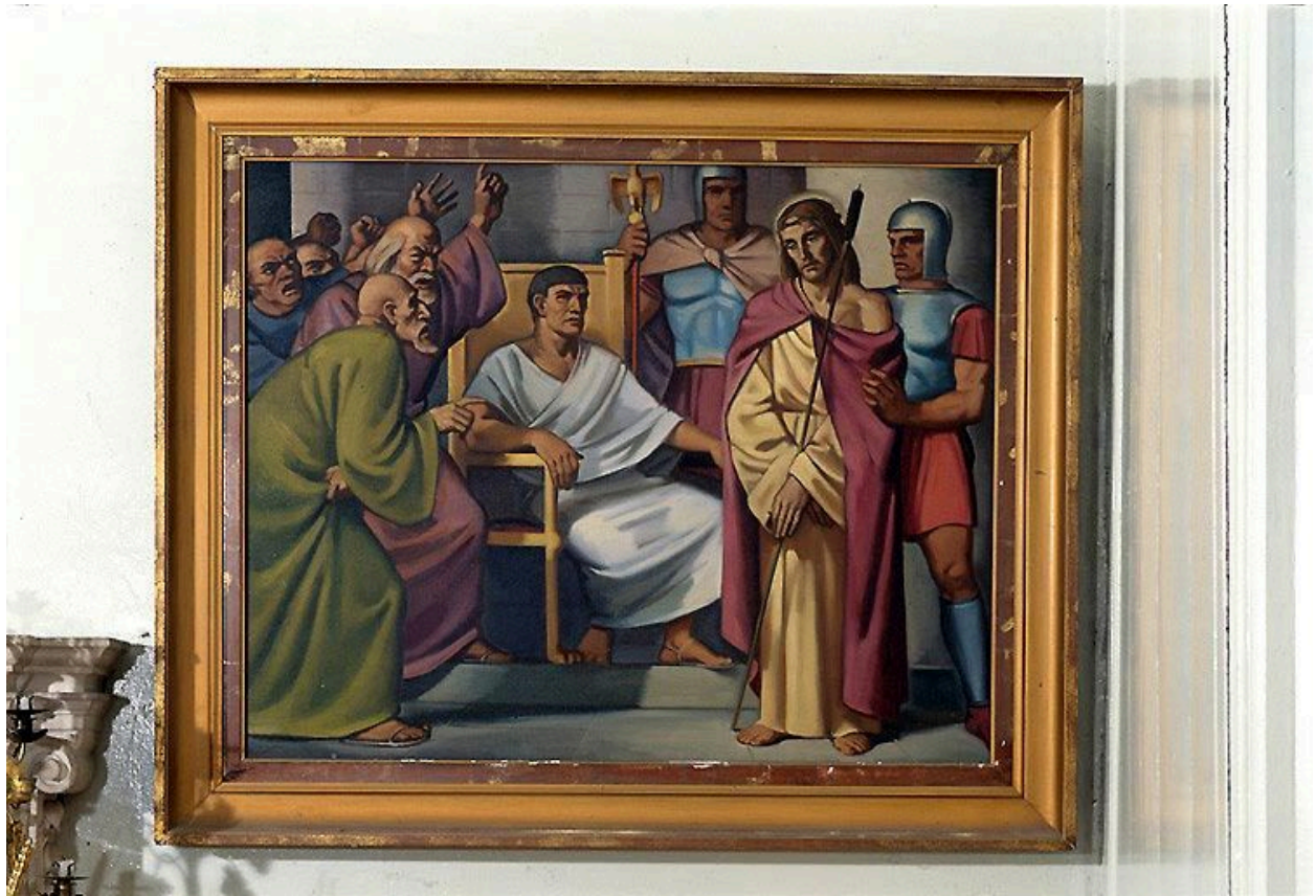
Station I : Jésus devant Pilate.