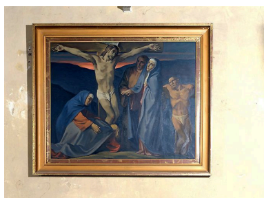
Station XII : Jésus sur la croix. IVR22_19980200913XA