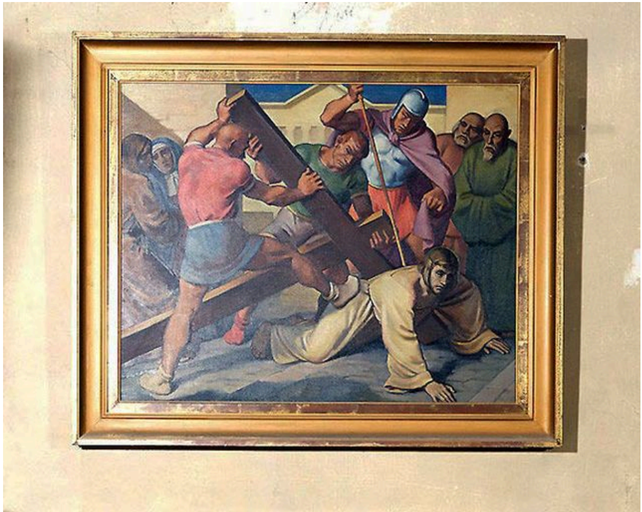
Station IX : Jésus tombe pour la troisième fois.