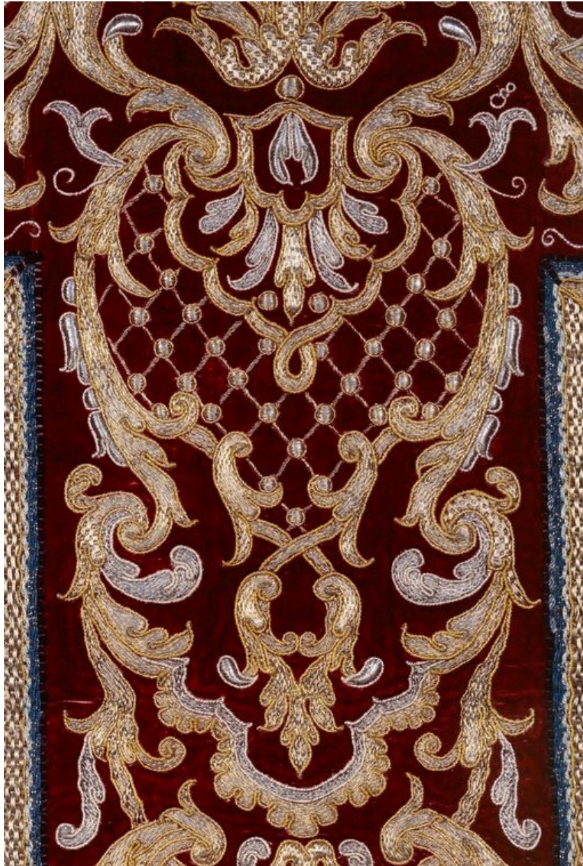
Détail de la chasuble.