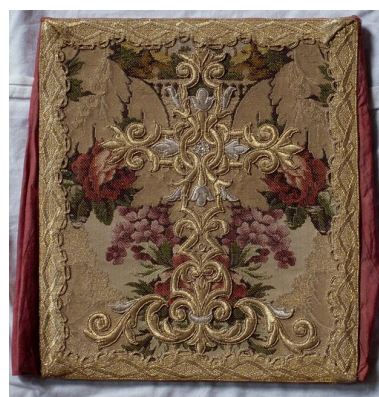
Bourse de corporal. Vue générale. IVR22_19946002035ZA