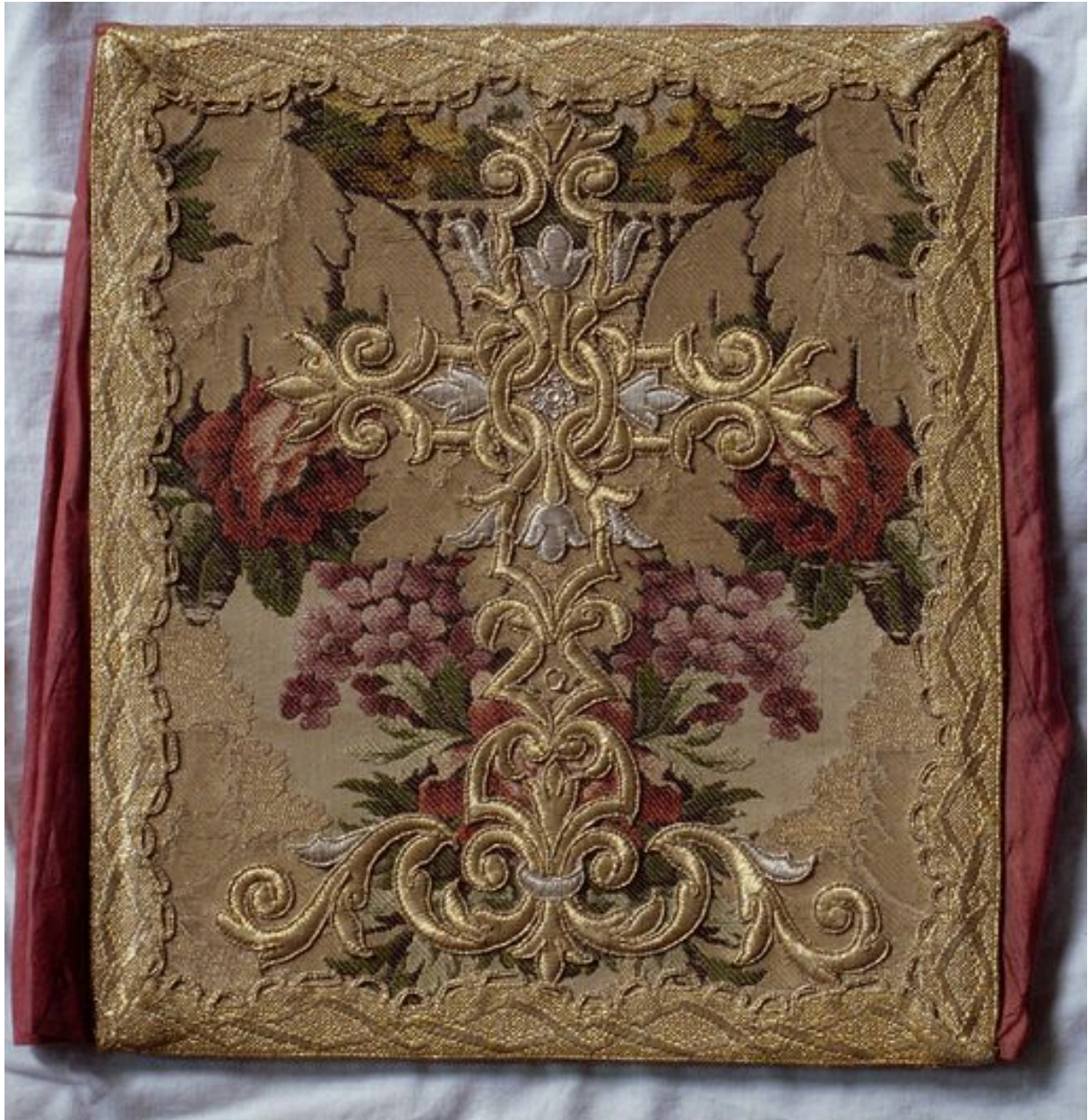
Bourse de corporal. Vue générale.