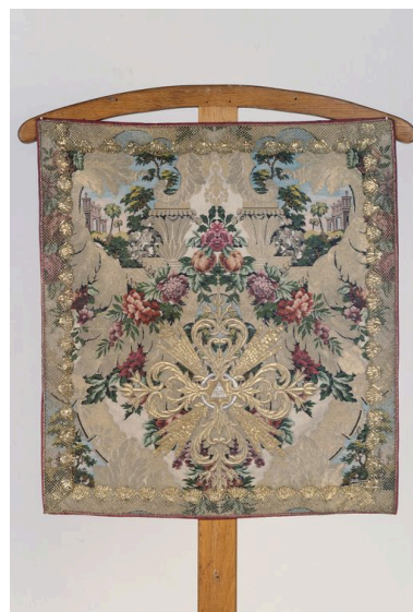
Voile de calice datant du 17e ou du 18e siècle.