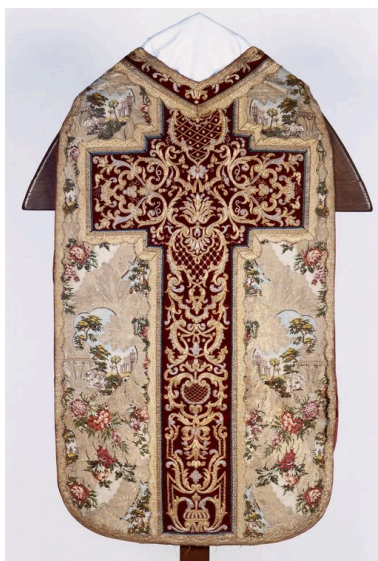
Revers de la chasuble.