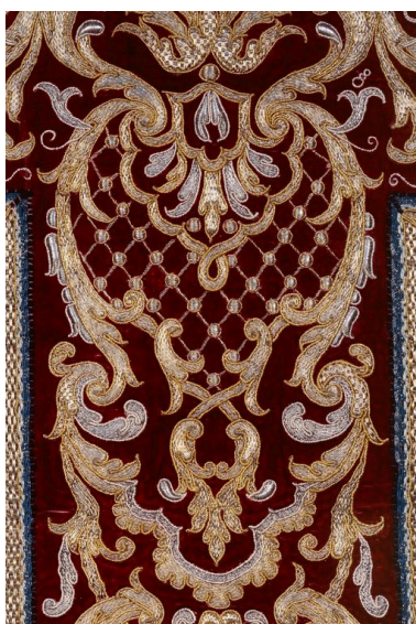
Détail de la chasuble.