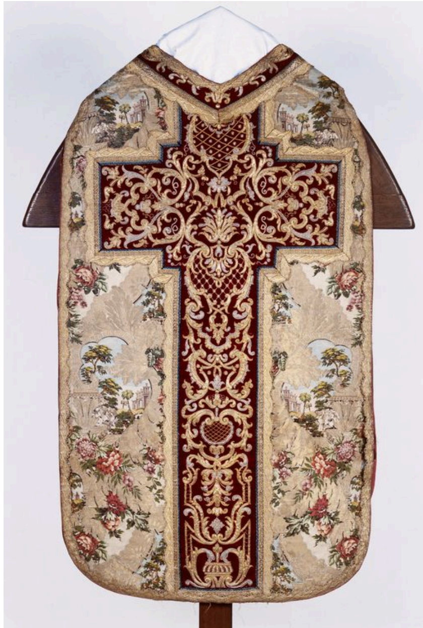
Revers de la chasuble.