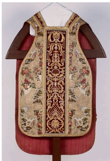
Devant de la chasuble. IVR22_19846000569XA