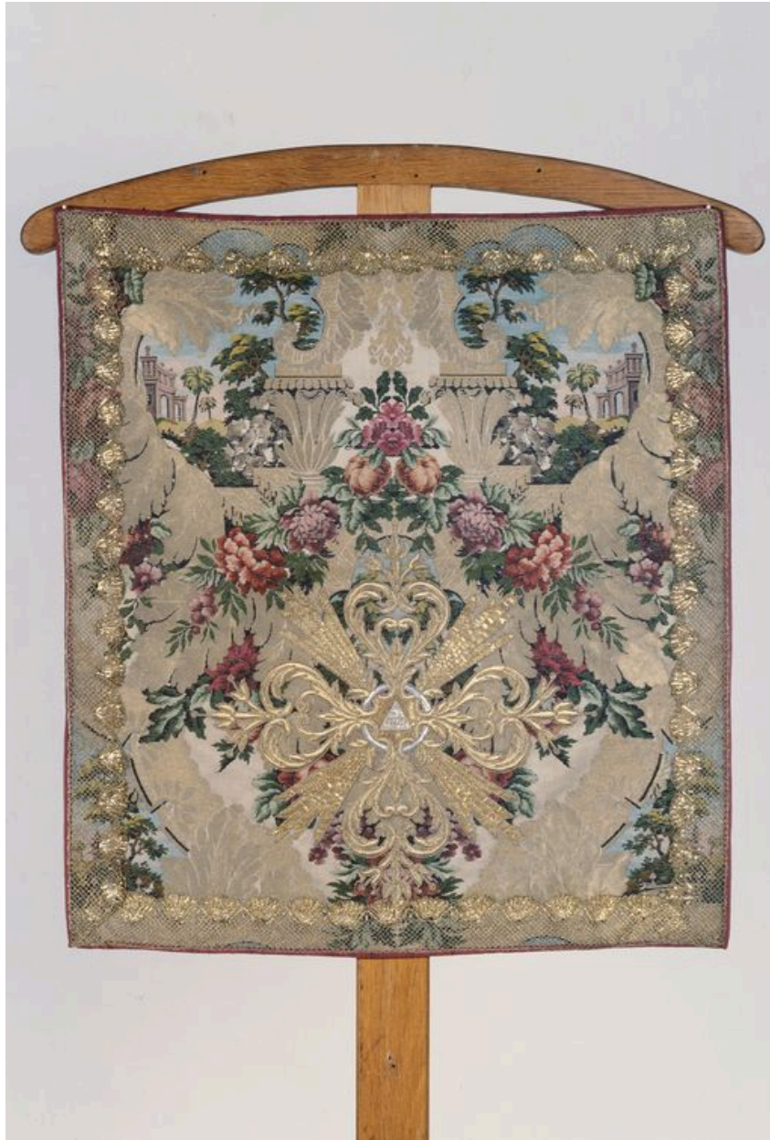
Voile de calice datant du 17e ou du 18e siècle.