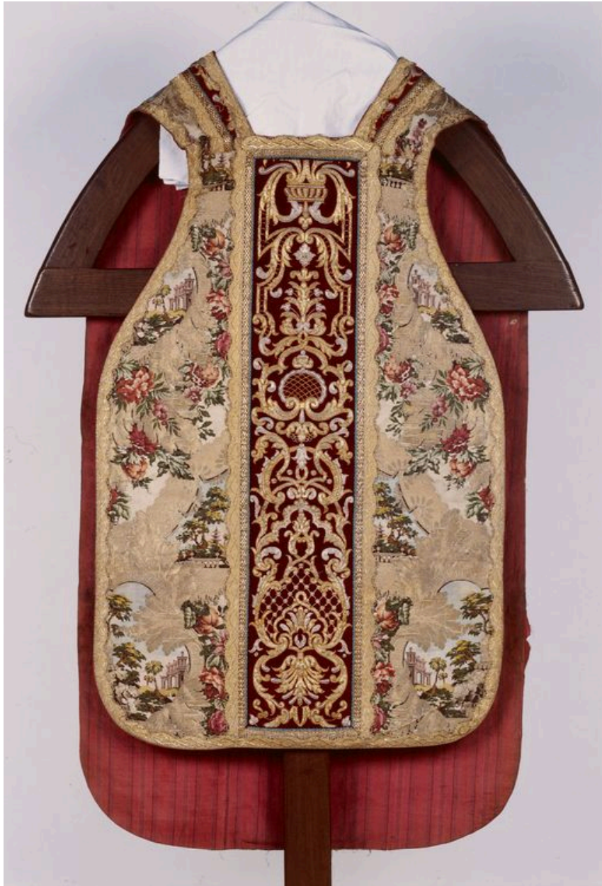
Devant de la chasuble.